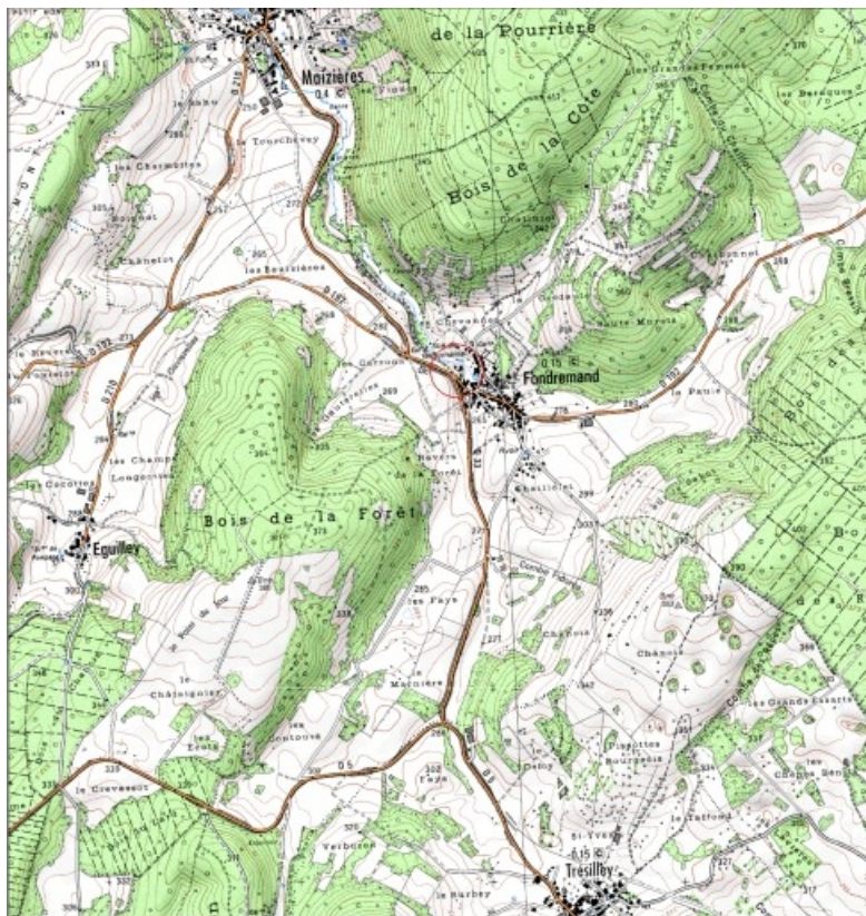
Carte de localisation. Carte topographique au 1:25000, I.G.N., Rioz, 3322 E. SCAN 25 © IGN - 2008, Licence n°2008CISE29-68. 70, Fondremand, lieudit : le Moulin