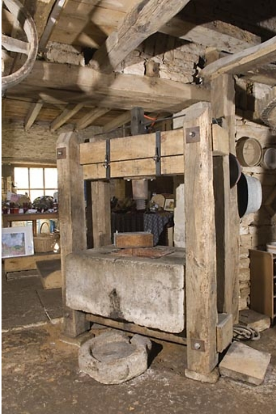
Le pressoir à huile.