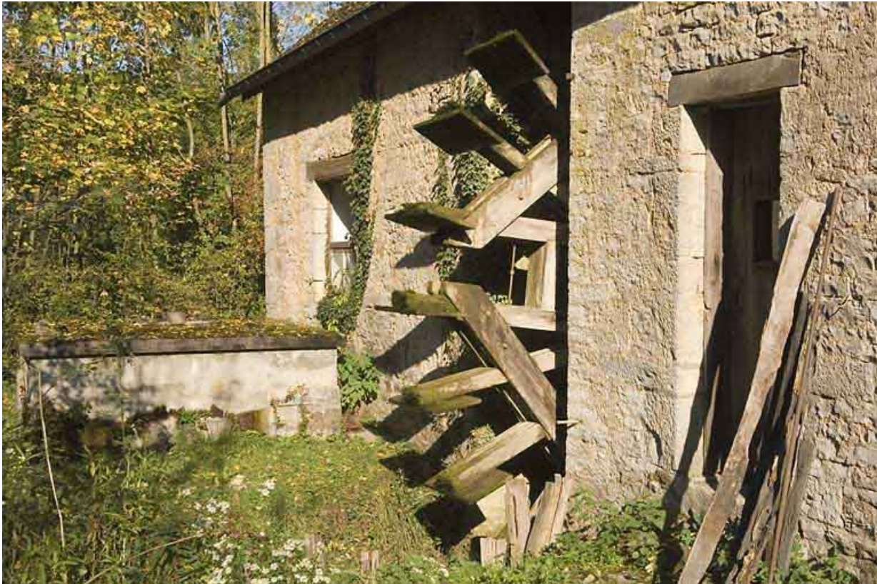
Façade postérieure. Détail de la roue.