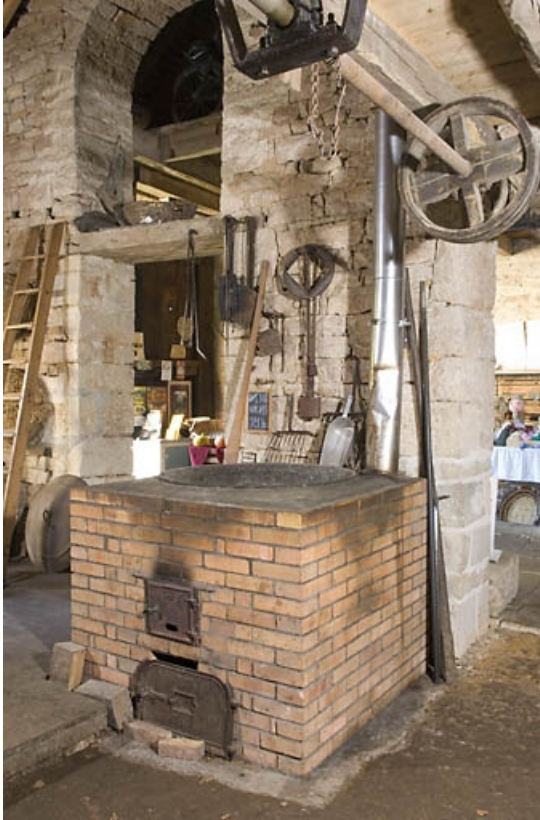
Chaudière (cuisson des matières oléagineuses).