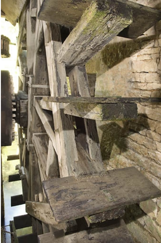
Détail de la roue hydraulique.