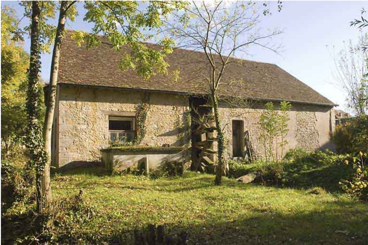
Façade postérieure du moulin.