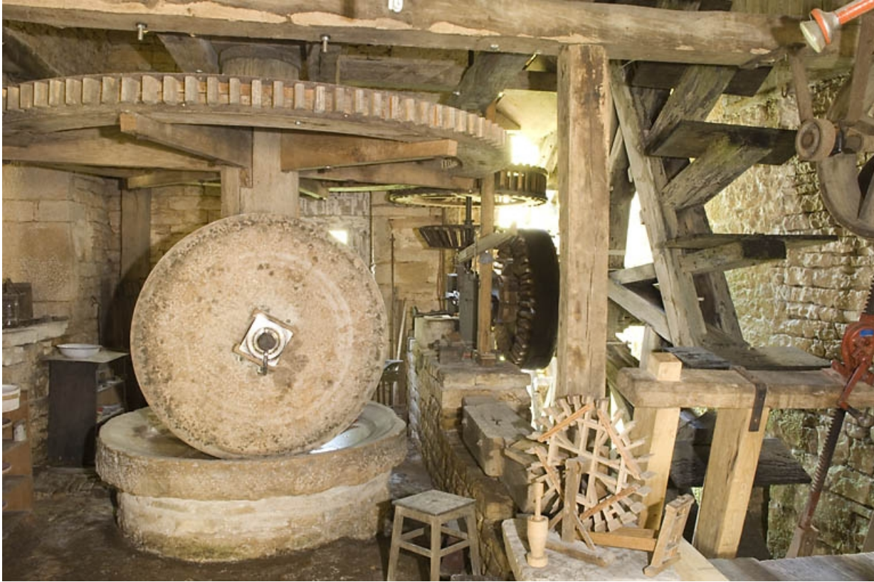
Intérieur de l'atelier de fabrication.