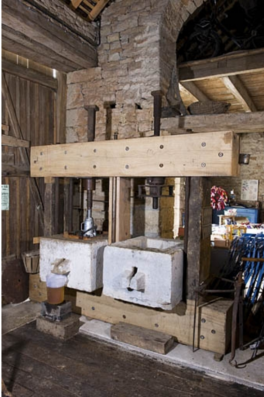
Couple de pressoirs installé début 2010.