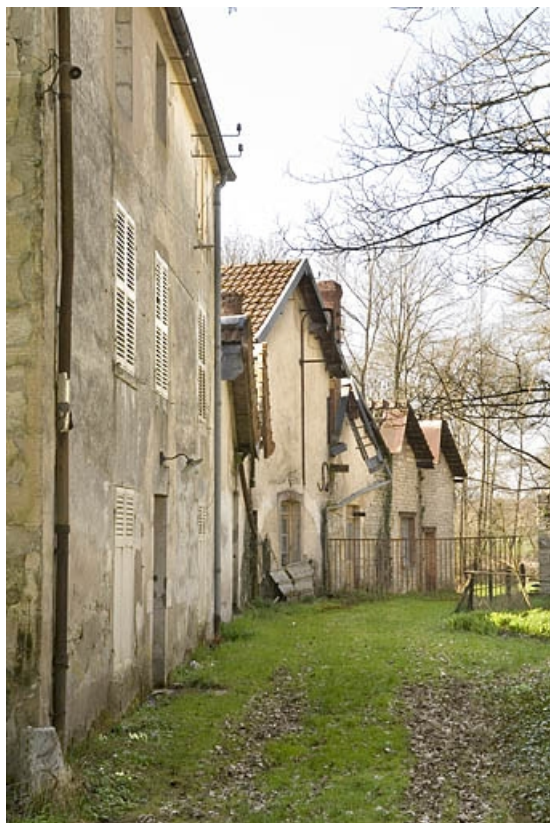
Façade du logement et pignons des ateliers depuis le nord. 70, Autet, lieudit : la Charme