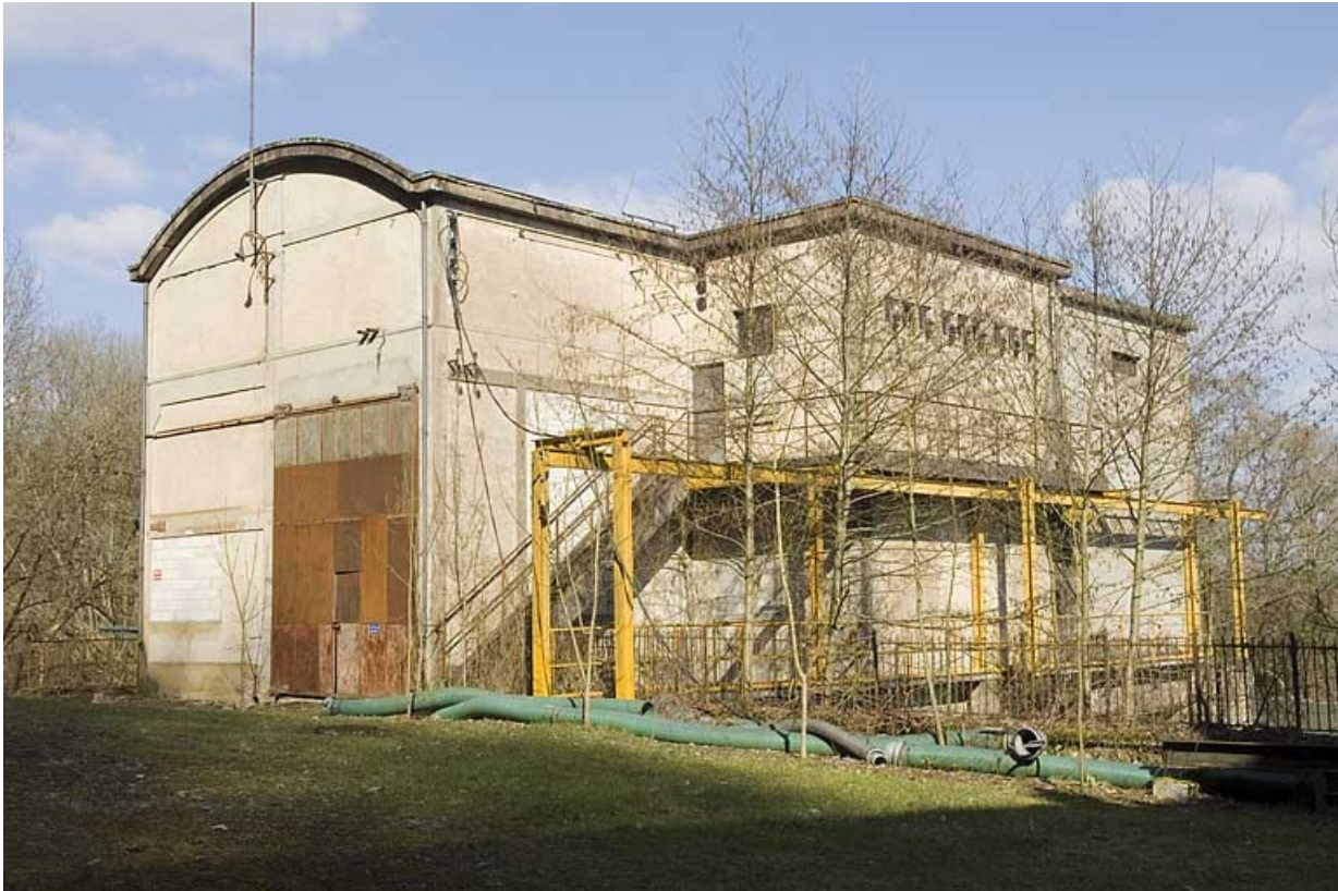
La centrale hydroélectrique vue de trois quarts.