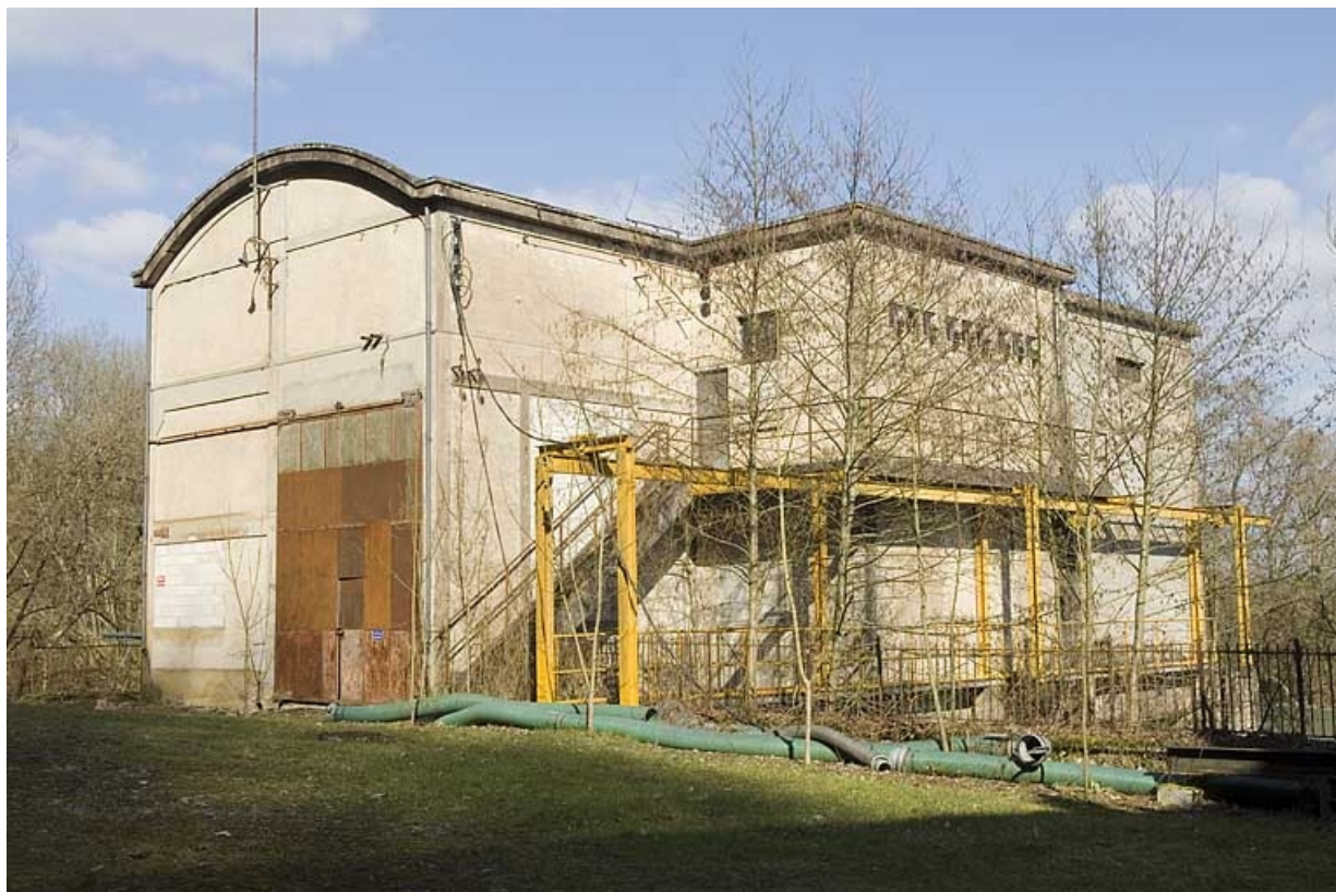
La centrale hydroélectrique vue de trois quarts. 70, Ray-sur-Saône rue du Moulin