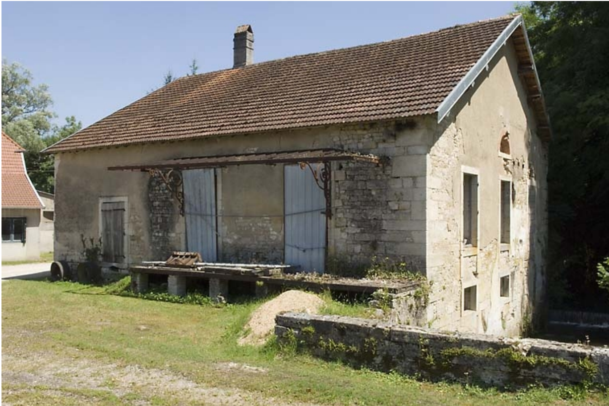
Moulin vu depuis l'ouest.

70, Vellexon-Queutrey-et-Vaudey, lieudit : le Fourneau