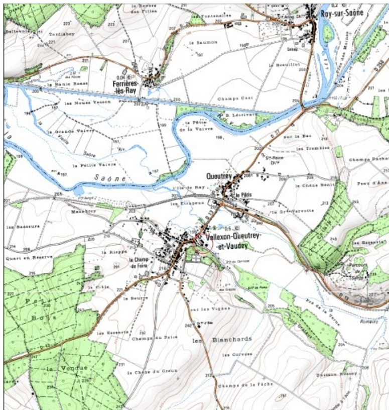
Carte de localisation. Carte topographique au 1:25000, I.G.N., Fresne-Saint-Mamès, 3321 O. SCAN 25 © IGN - 2008, Licence n°2008CISE29-68.

70, Vellexon-Queutrey-et-Vaudey, lieudit : le Fourneau