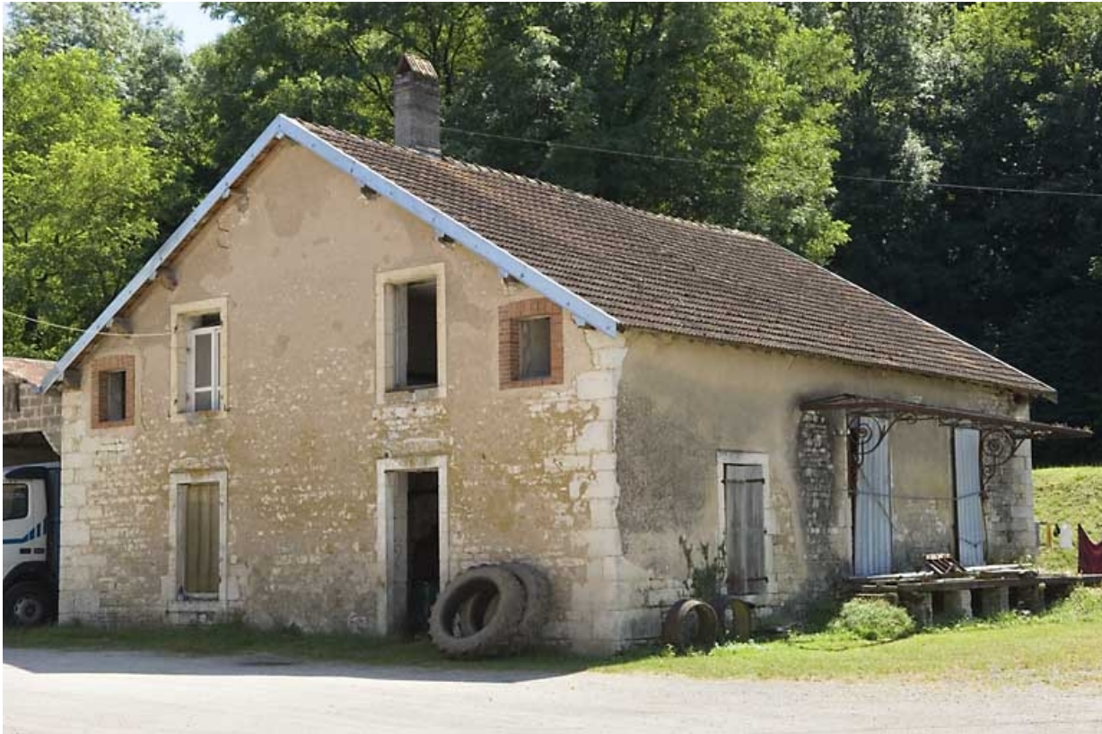
Moulin vu depuis le nord.

70, Vellexon-Queutrey-et-Vaudey, lieudit : le Fourneau