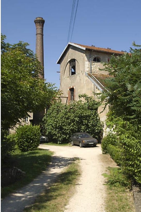
Vue du haut fourneau depuis l'entrée.

70, Beaujeu-Saint-Vallier-Pierrejux-et-Quitteur, lieudit : la Forge