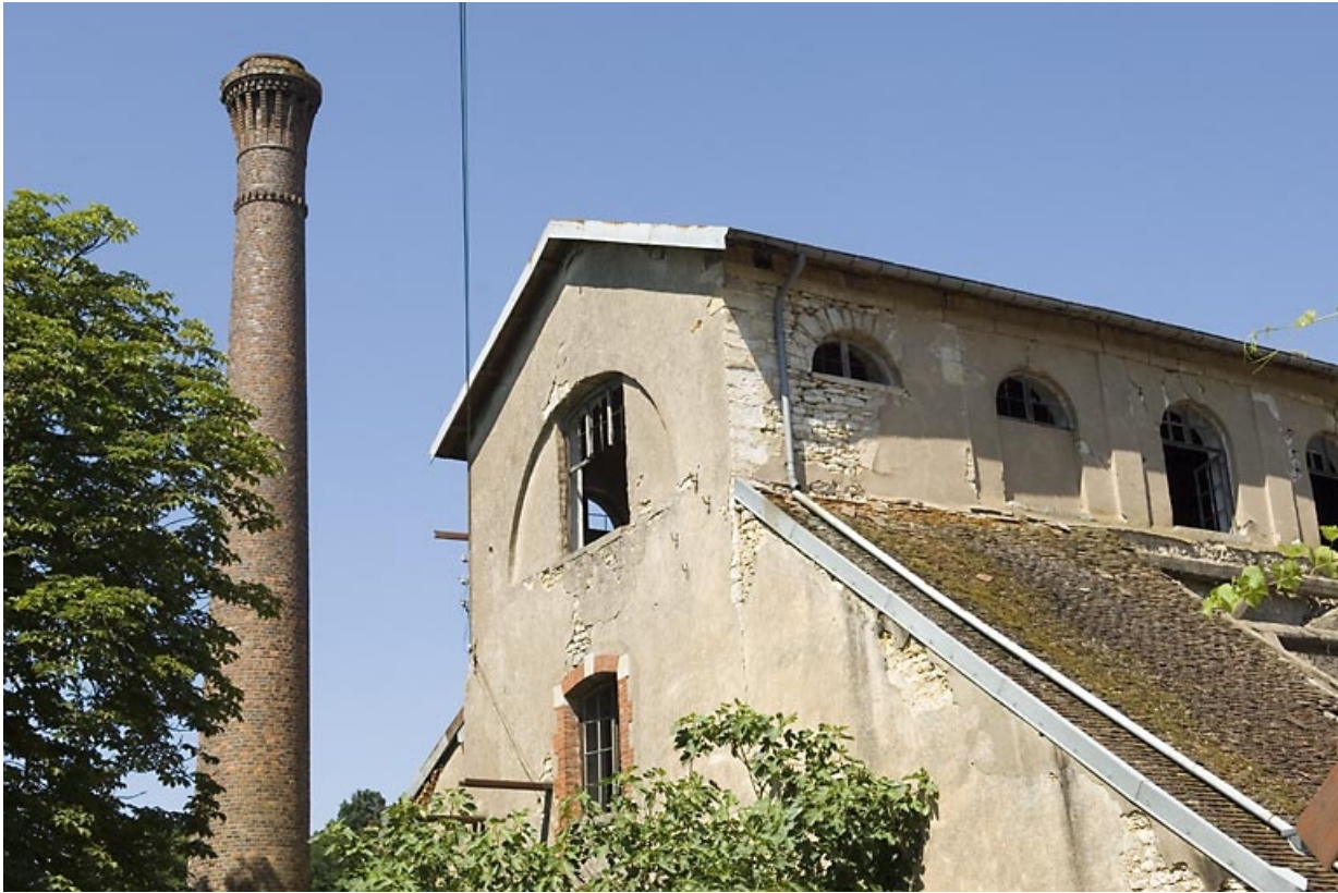
Cheminée et partie supérieure du haut fourneau.

70, Beaujeu-Saint-Vallier-Pierrejux-et-Quitteur, lieudit : la Forge