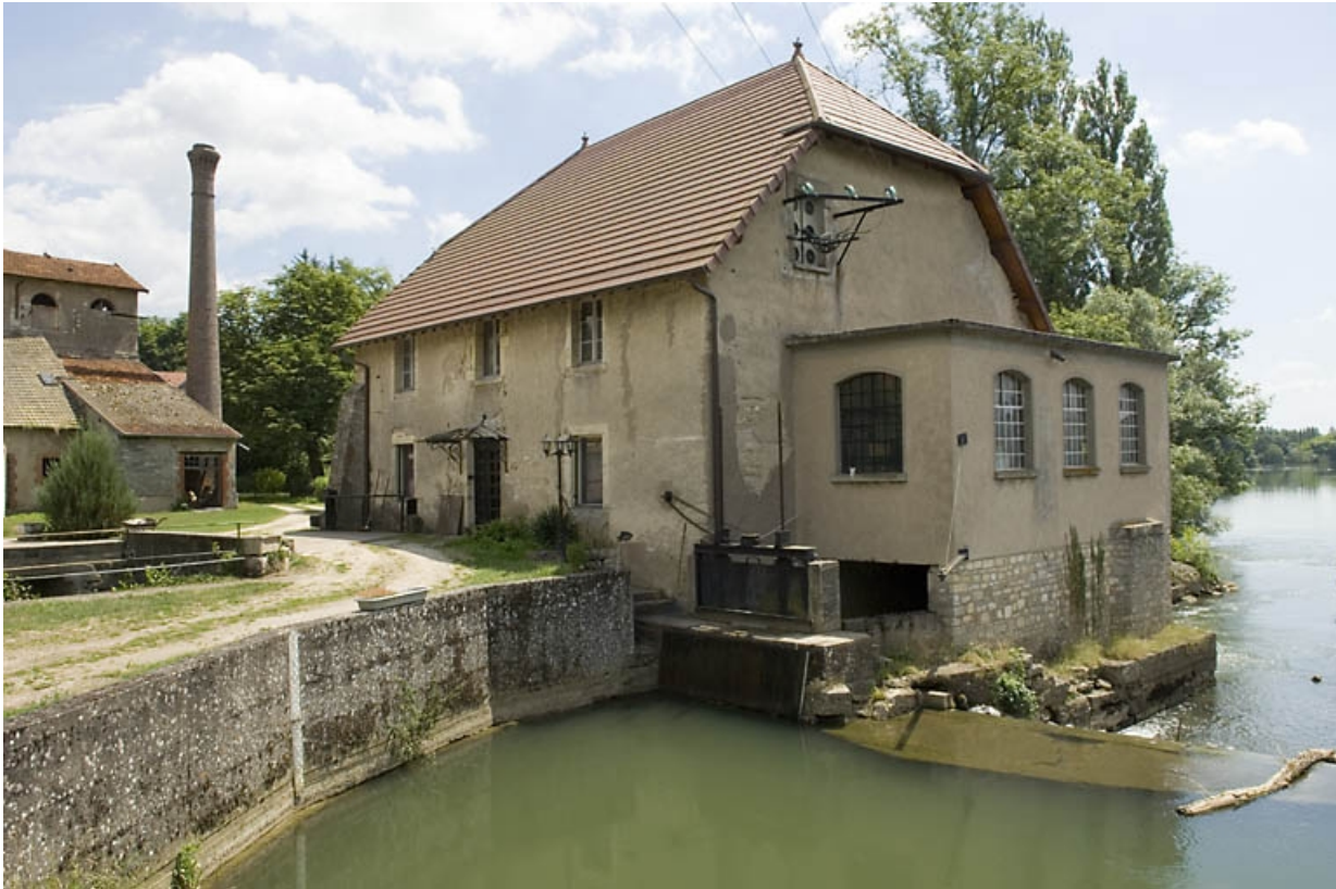
Moulin reconverti en centrale hydroélectrique.

70, Beaujeu-Saint-Vallier-Pierrejux-et-Quitteur, lieudit : la Forge