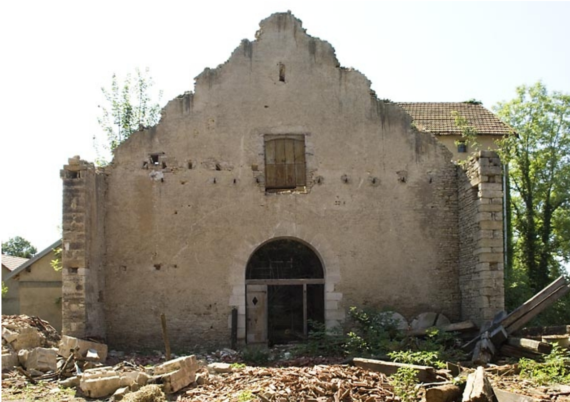
Mur sud de la halle à charbon.

70, Beaujeu-Saint-Vallier-Pierrejux-et-Quitteur, lieudit : la Forge