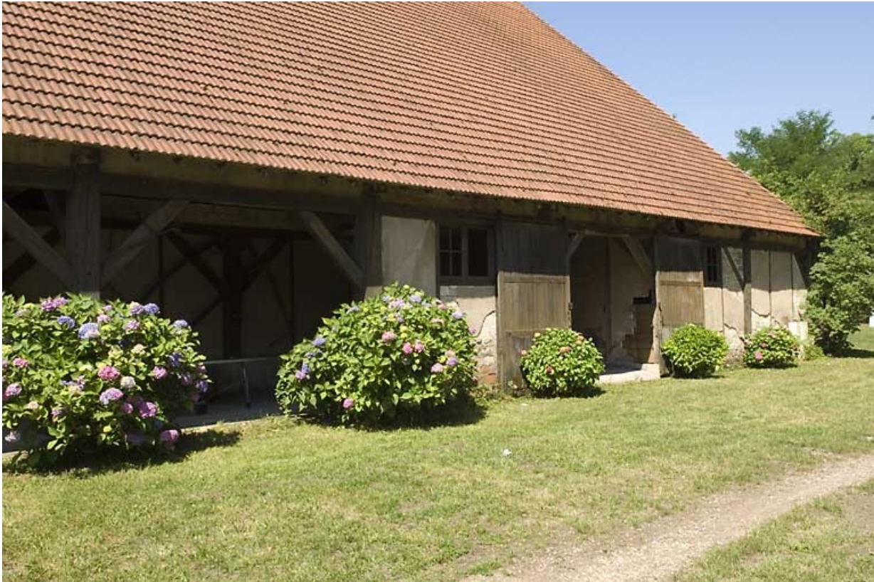
Extrémité nord de la halle à charbon.

70, Beaujeu-Saint-Vallier-Pierrejux-et-Quitteur, lieudit : la Forge