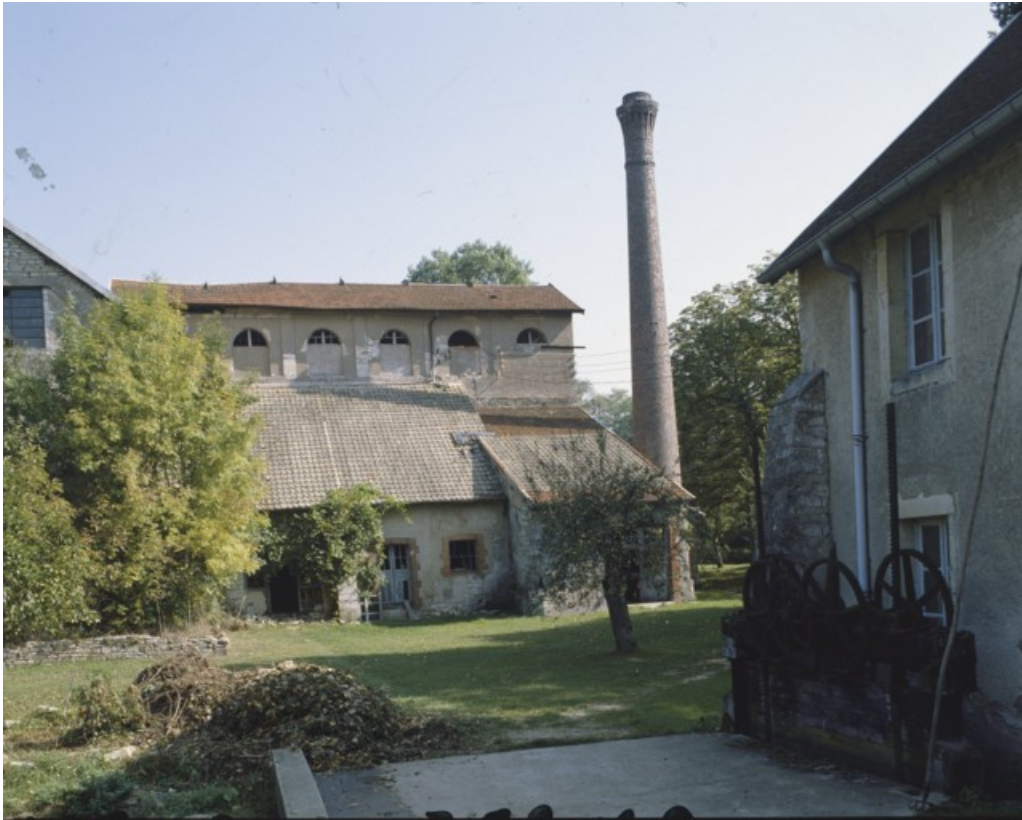
Façade ouest du haut fourneau depuis le moulin en 1989.

70, Beaujeu-Saint-Vallier-Pierrejux-et-Quitteur, lieudit : la Forge