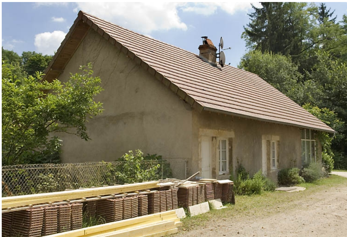
Logement à l'entrée du site.

70, Beaujeu-Saint-Vallier-Pierrejux-et-Quitteur, lieudit : la Forge