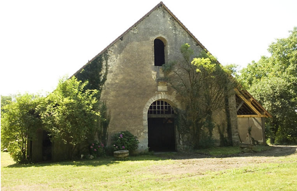
Mur-pignon nord de la halle à charbon.

70, Beaujeu-Saint-Vallier-Pierrejux-et-Quitteur, lieudit : la Forge