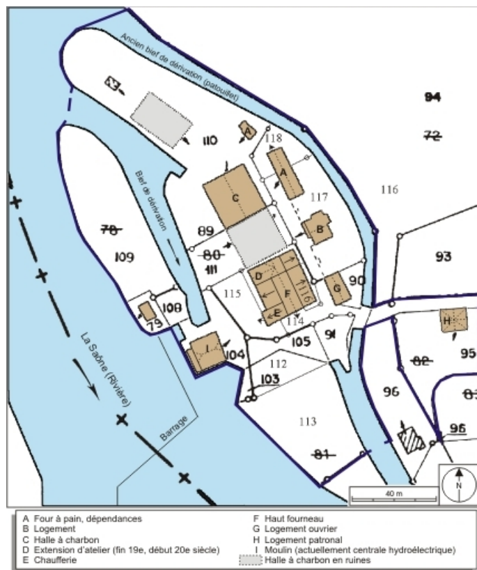
Plan-masse et de situation. Extrait du plan cadastral numérisé, 2008, section ZB, 1:2000 agrandi à 1:1250.

70, Beaujeu-Saint-Vallier-Pierrejux-et-Quitteur, lieudit : la Forge