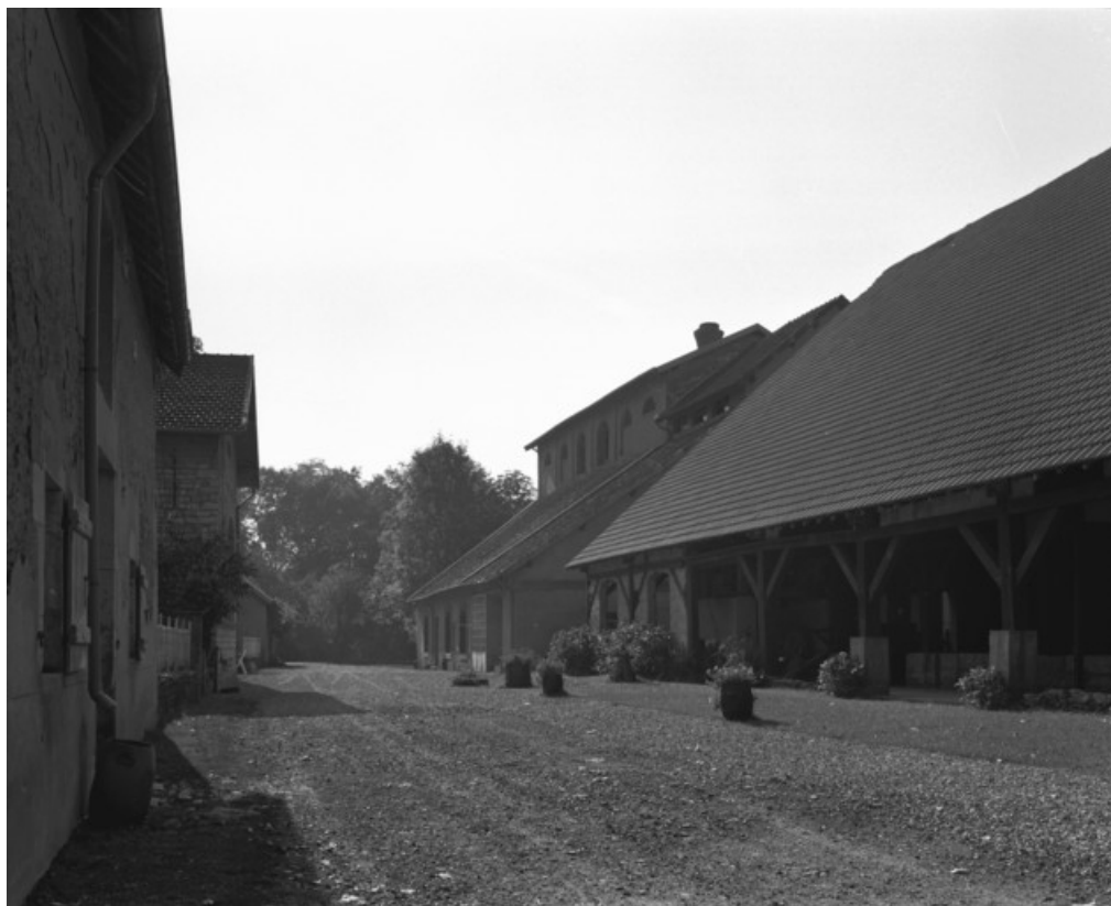
Haut fourneau et halle à charbon depuis le nord en 1990.

70, Beaujeu-Saint-Vallier-Pierrejux-et-Quitteur, lieudit : la Forge