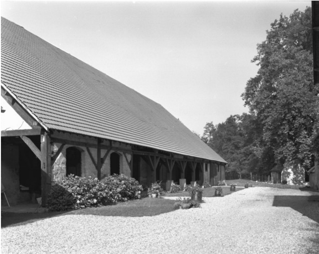
Halle à charbon vue de trois quarts en 1989.

70, Beaujeu-Saint-Vallier-Pierrejux-et-Quitteur, lieudit : la Forge