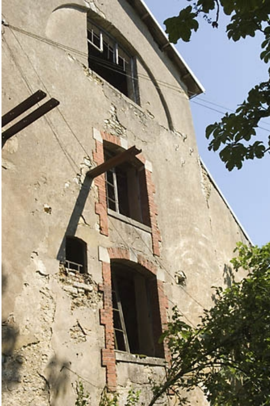
Elévation du pignon sud du haut fourneau.

70, Beaujeu-Saint-Vallier-Pierrejux-et-Quitteur, lieudit : la Forge