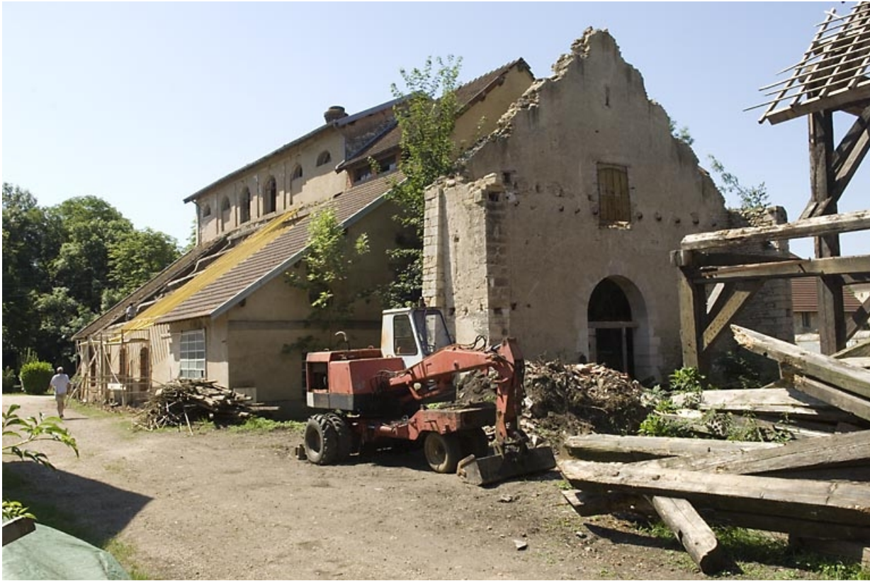
Le haut fourneau et la partie ruinée de la halle à charbon.

70, Beaujeu-Saint-Vallier-Pierrejux-et-Quitteur, lieudit : la Forge