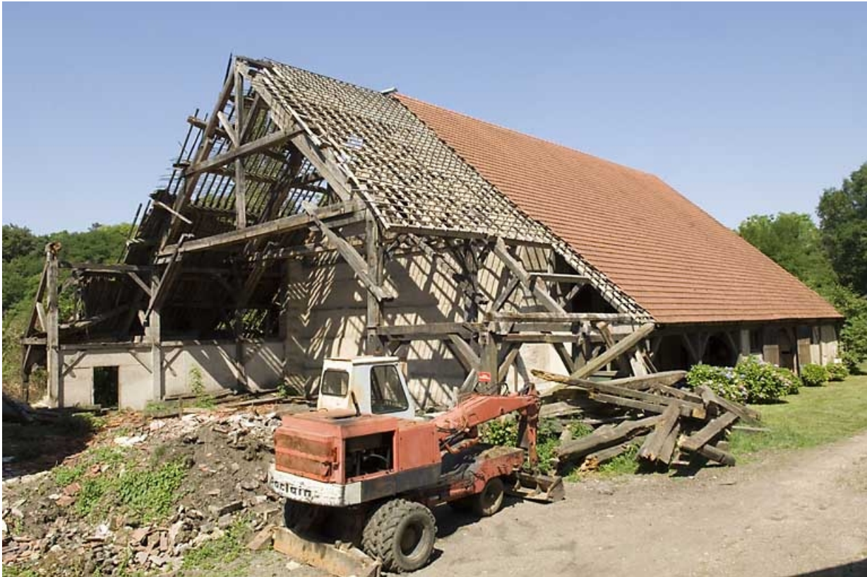
La halle à charbon vue depuis l'est.

70, Beaujeu-Saint-Vallier-Pierrejux-et-Quitteur, lieudit : la Forge