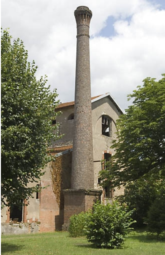
Cheminée et mur-pignon du haut fourneau depuis le sud-ouest.

70, Beaujeu-Saint-Vallier-Pierrejux-et-Quitteur, lieudit : la Forge