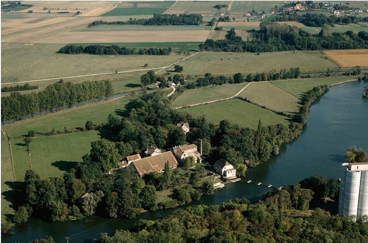
Vue aérienne depuis le nord-ouest en 1989.

70, Beaujeu-Saint-Vallier-Pierrejux-et-Quitteur, lieudit : la Forge