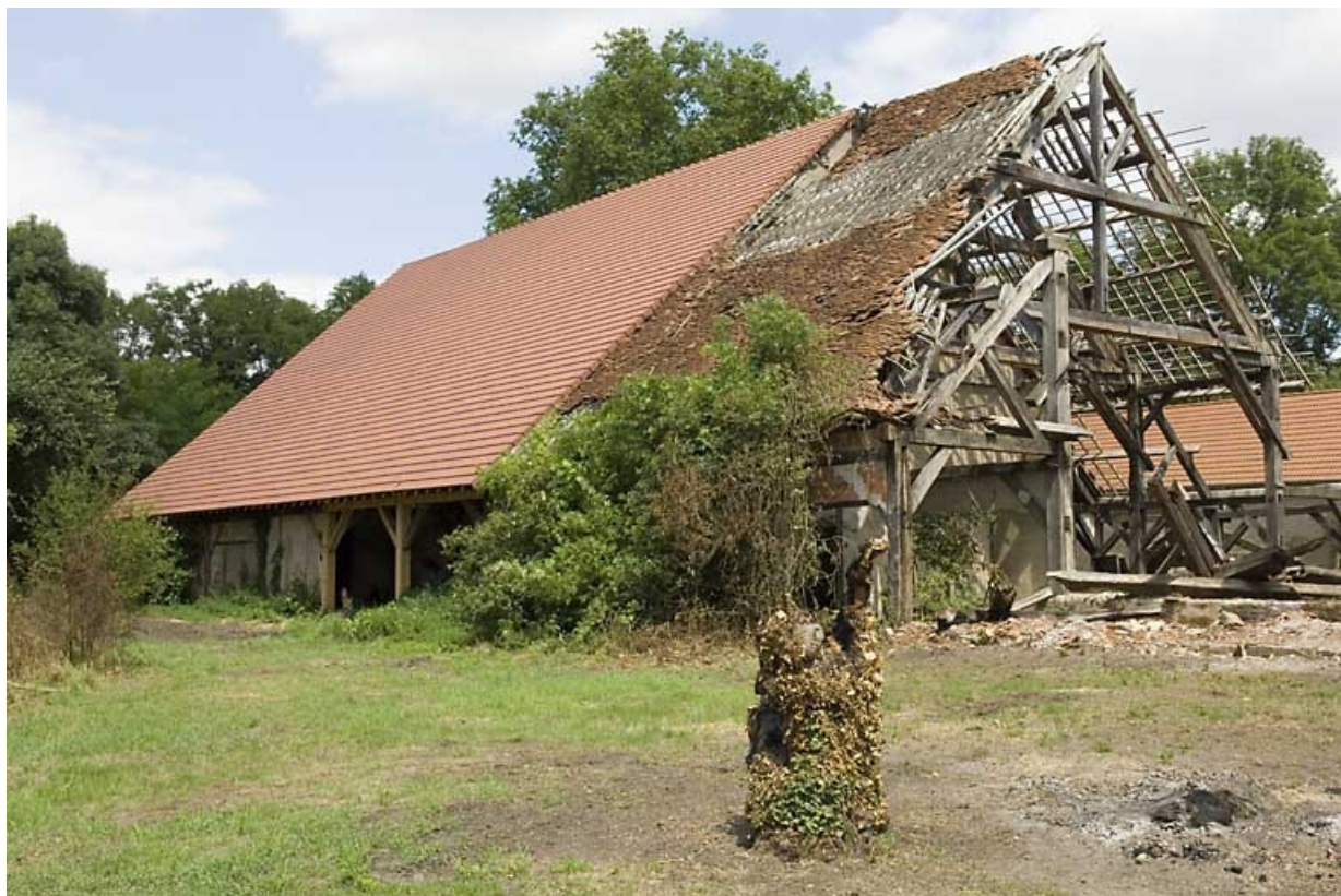
La halle à charbon vue depuis le sud.

70, Beaujeu-Saint-Vallier-Pierrejux-et-Quitteur, lieudit : la Forge