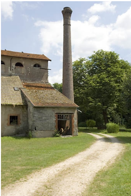
Chauferie et cheminée au sud du haut fourneau.

70, Beaujeu-Saint-Vallier-Pierrejux-et-Quitteur, lieudit : la Forge