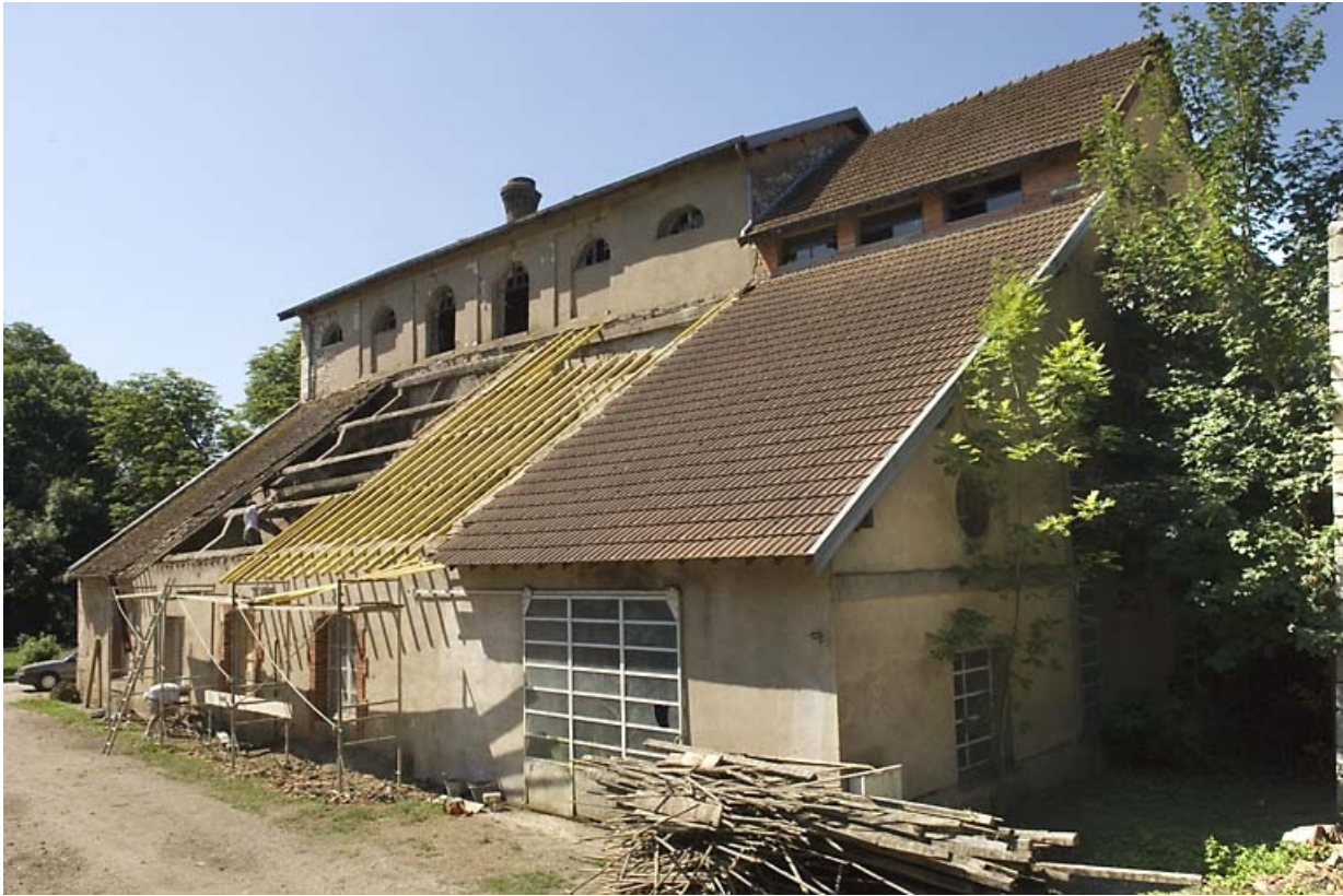
Le haut fourneau vu de trois quarts.

70, Beaujeu-Saint-Vallier-Pierrejux-et-Quitteur, lieudit : la Forge