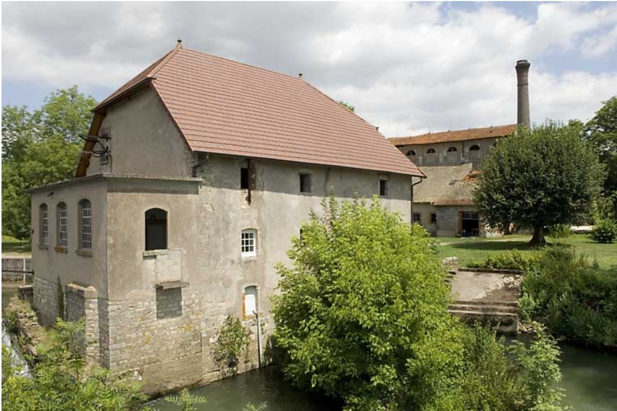
Moulin et haut fourneau depuis le sud-ouest.

70, Beaujeu-Saint-Vallier-Pierrejux-et-Quitteur, lieudit : la Forge