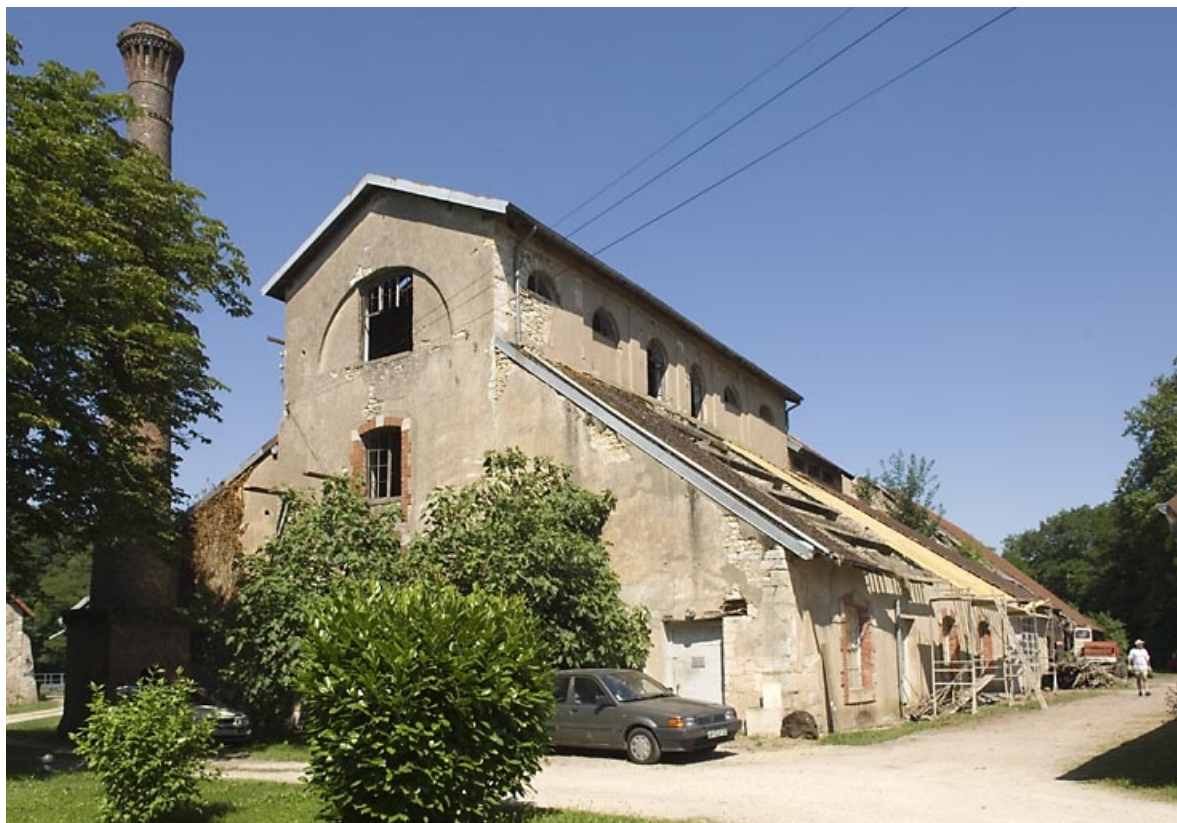
Le haut fourneau vu depuis le sud-est.

70, Beaujeu-Saint-Vallier-Pierrejux-et-Quitteur, lieudit : la Forge