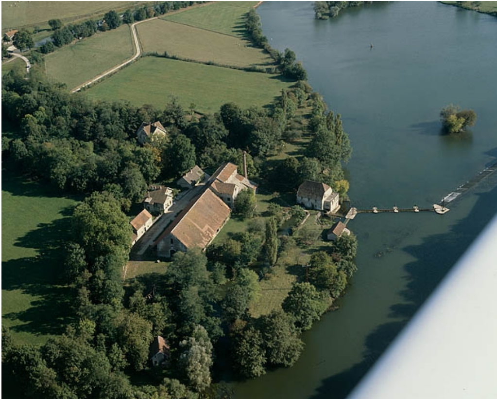
Vue aérienne plongeante depuis le nord en 1989.

70, Beaujeu-Saint-Vallier-Pierrejux-et-Quitteur, lieudit : la Forge