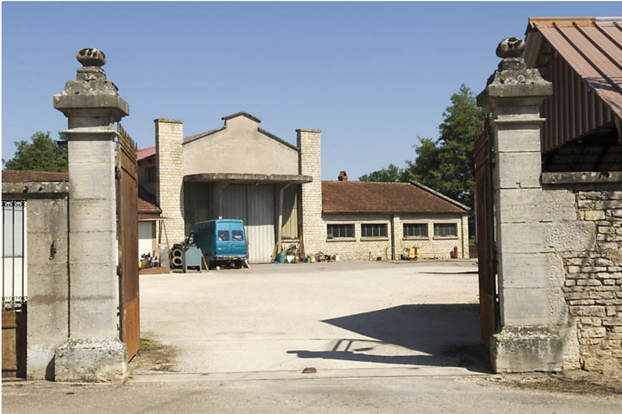
Vue depuis l'entrée.

70, Champlitte rue de l' Usine, lieudit : Neuville-lès-Champlitte