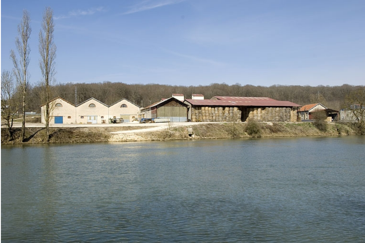
Vue d'ensemble depuis la rive gauche de la Saône.

70, Arc-lès-Gray R.D. 70, lieudit : la Féculerie