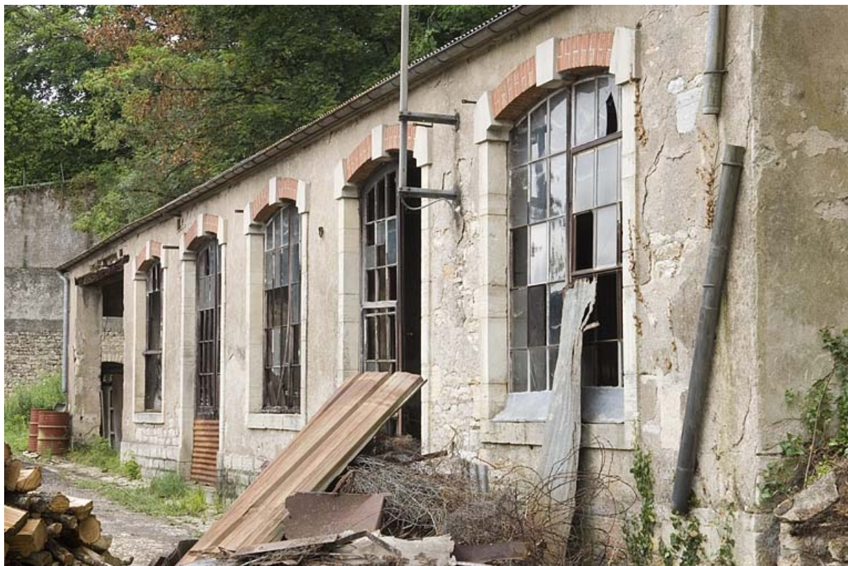
Façade d'un atelier de fabrication.