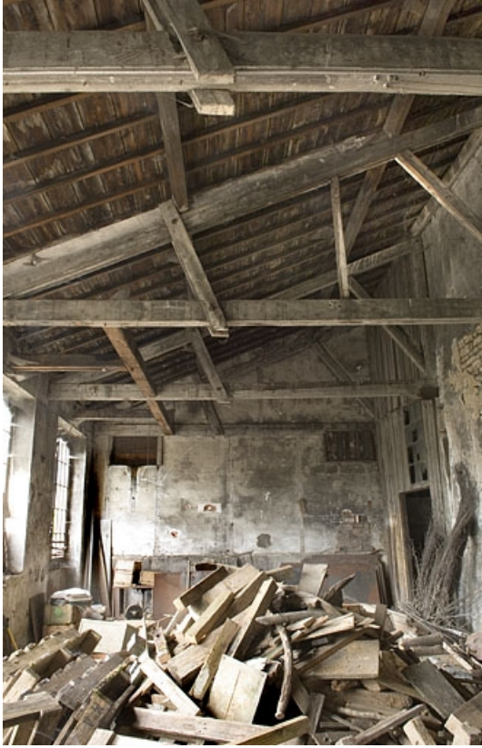
Intérieur de l'atelier à flanc de colline. Vue depuis le sud.