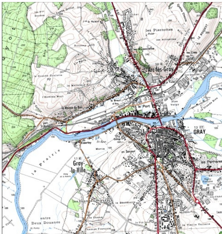
Carte de localisation. Carte topographique au 1:25000, I.G.N., Gray, 3222 E. SCAN 25 70, Arc-lès-Gray, 20 avenue Jean Jaurès