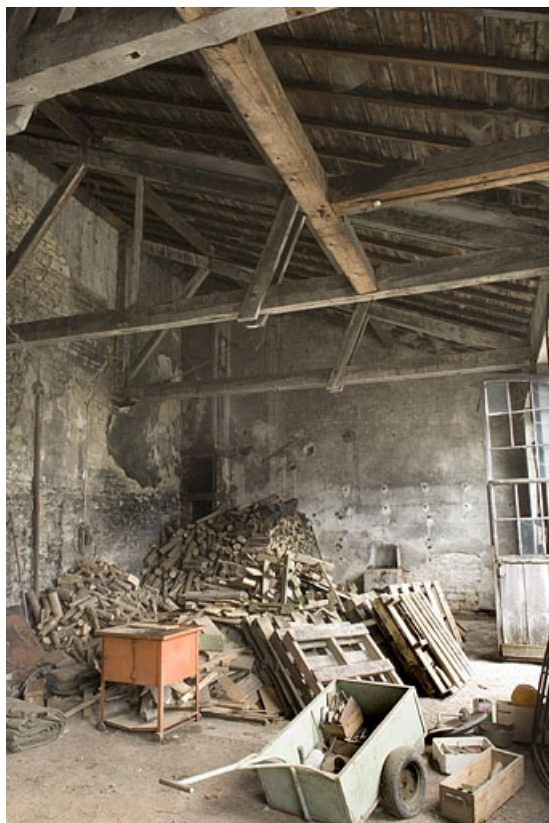
Intérieur de l'atelier à flanc de colline. Vue depuis le nord.