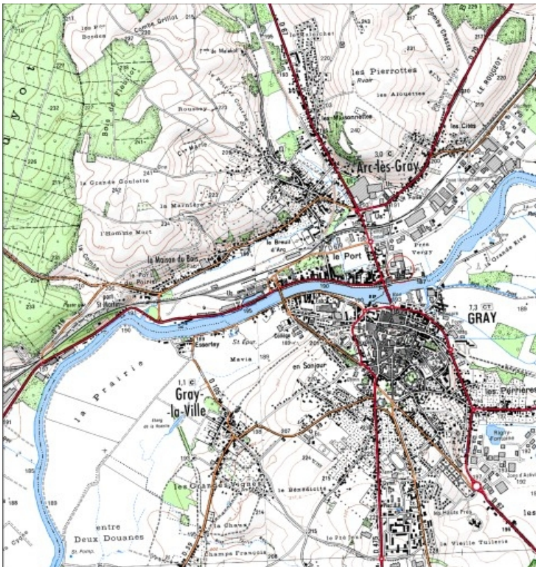
Carte de localisation. Carte topographique au 1:25000, I.G.N., Gray, 3222 E. SCAN 25, Licence n°2008CISE29-68. 70, Gray quai Vergy