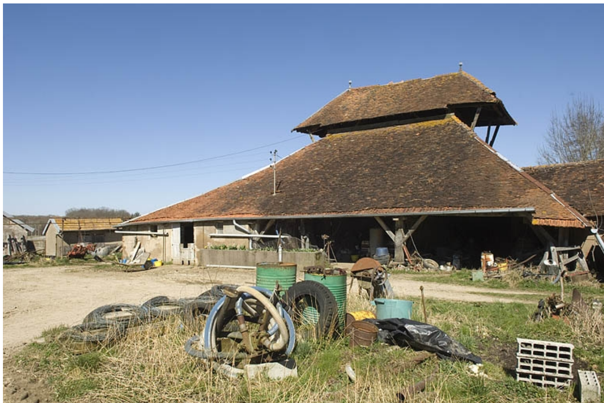
Bâtiment du four vu de trois quarts droite.

70, Champtonnay, 7 route de Besançon, lieudit : la Vendue