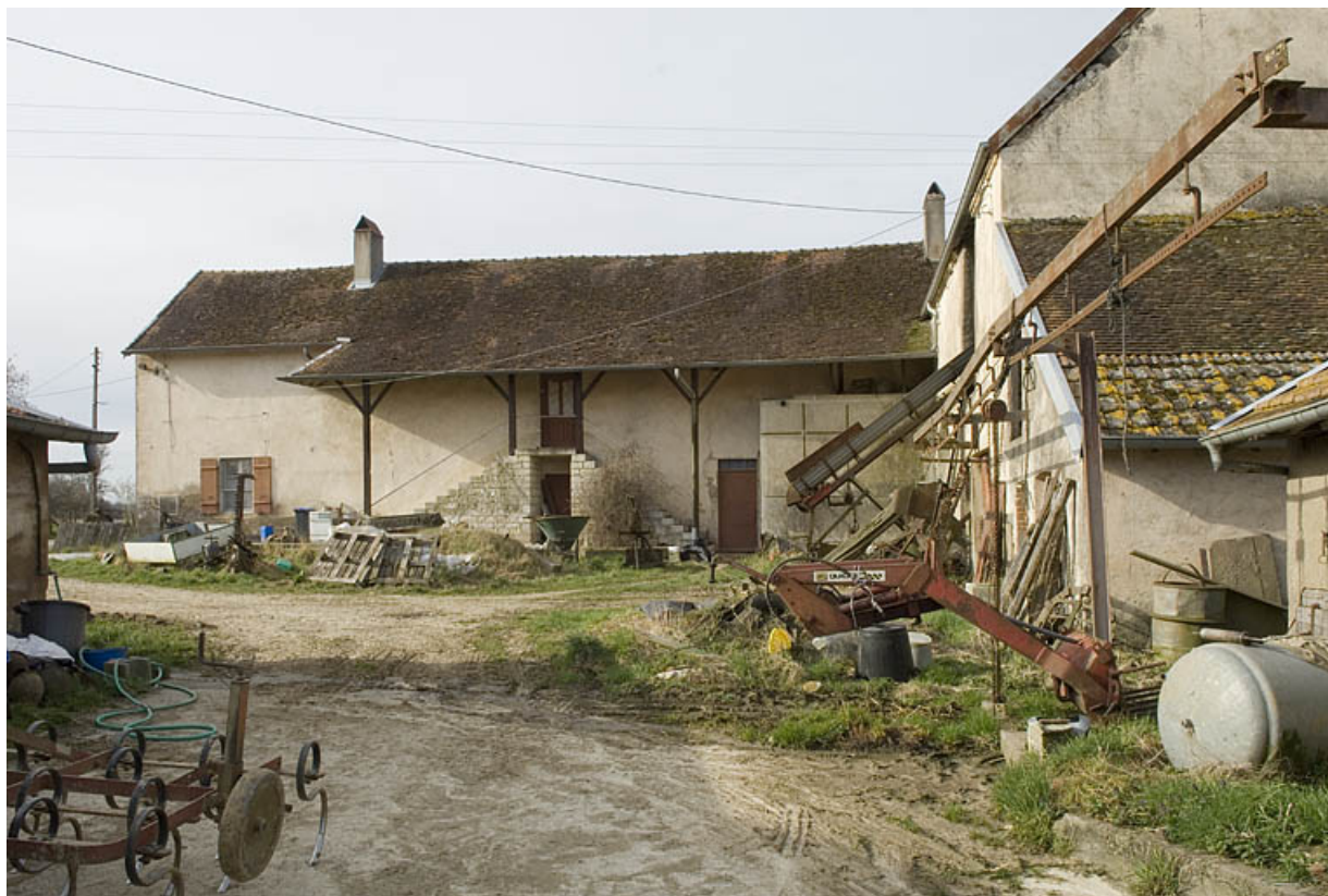
Corps de ferme depuis le nord.

70, Champtonnay, 7 route de Besançon, lieudit : la Vendue