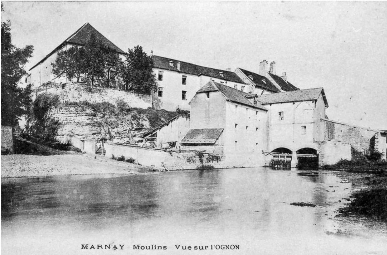
MARNAY Moulins Vue sur l'OGNON

MARNAY - Moulins - Vue sur l'Ognon. Moulin avant sa destruction.