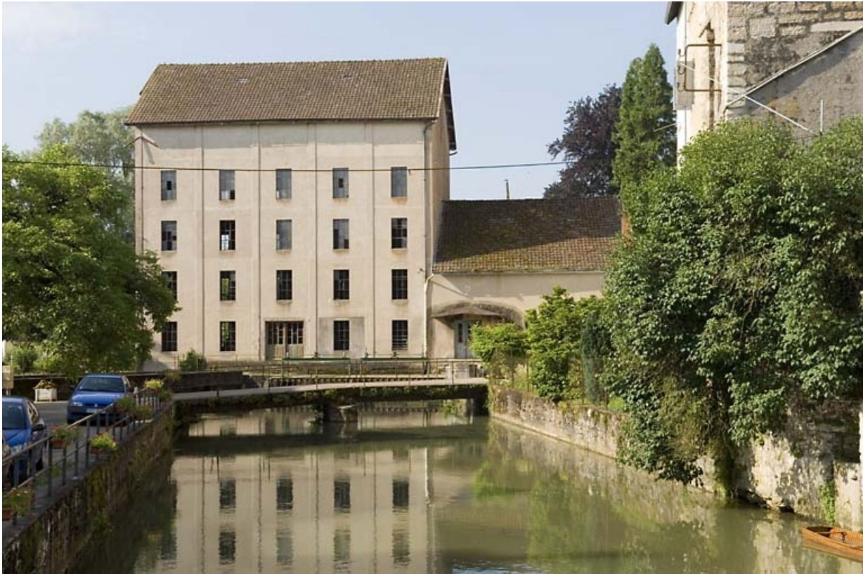
Vue depuis l'amont du bief.