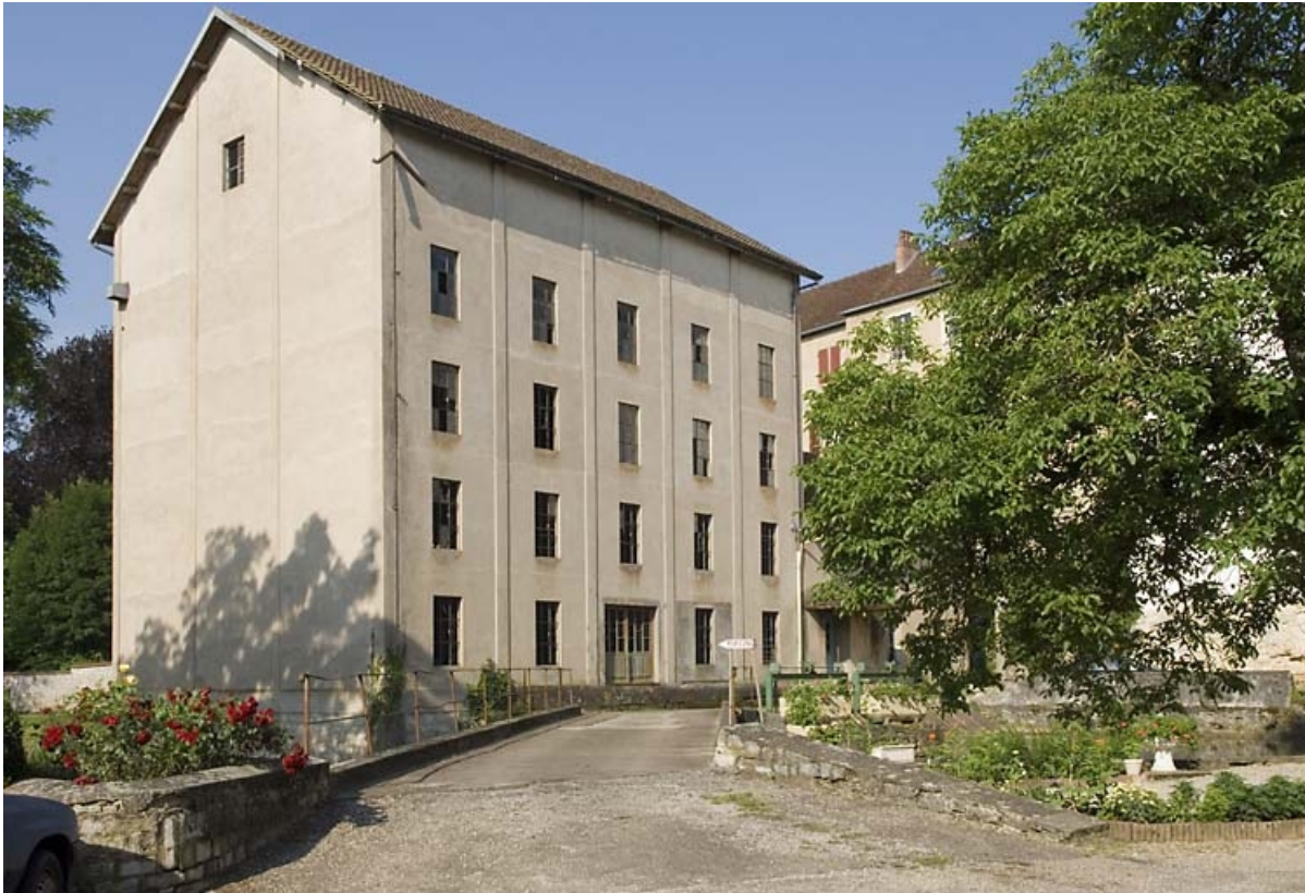
Façade antérieure de trois quarts.