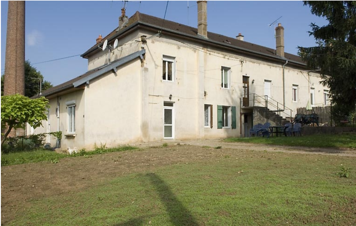
Cheminée, salle des machines et ancien atelier.