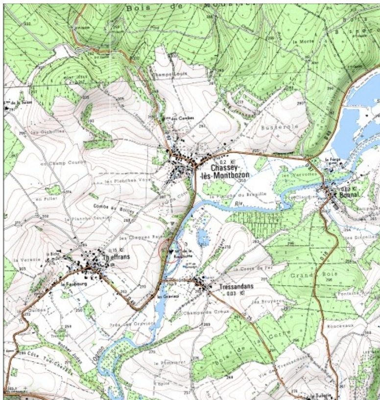
Carte de localisation. Carte topographique au 1:25000, I.G.N., Rougemont, 3422 E. SCAN 25, Licence n°2008CISE29-68. 70, Thieffrans, lieudit : la Rouchotte