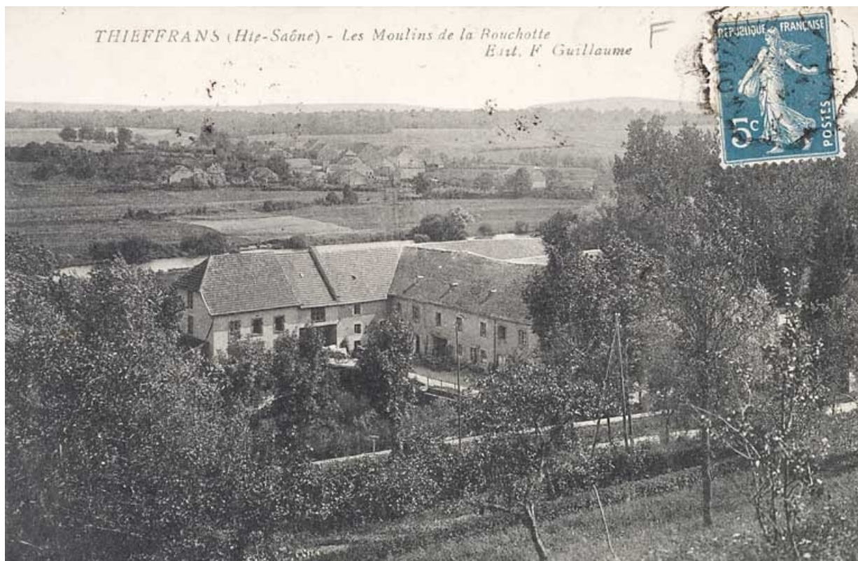
Thieffrans (Haute-Saône). - Les Moulins de la Rouchotte.