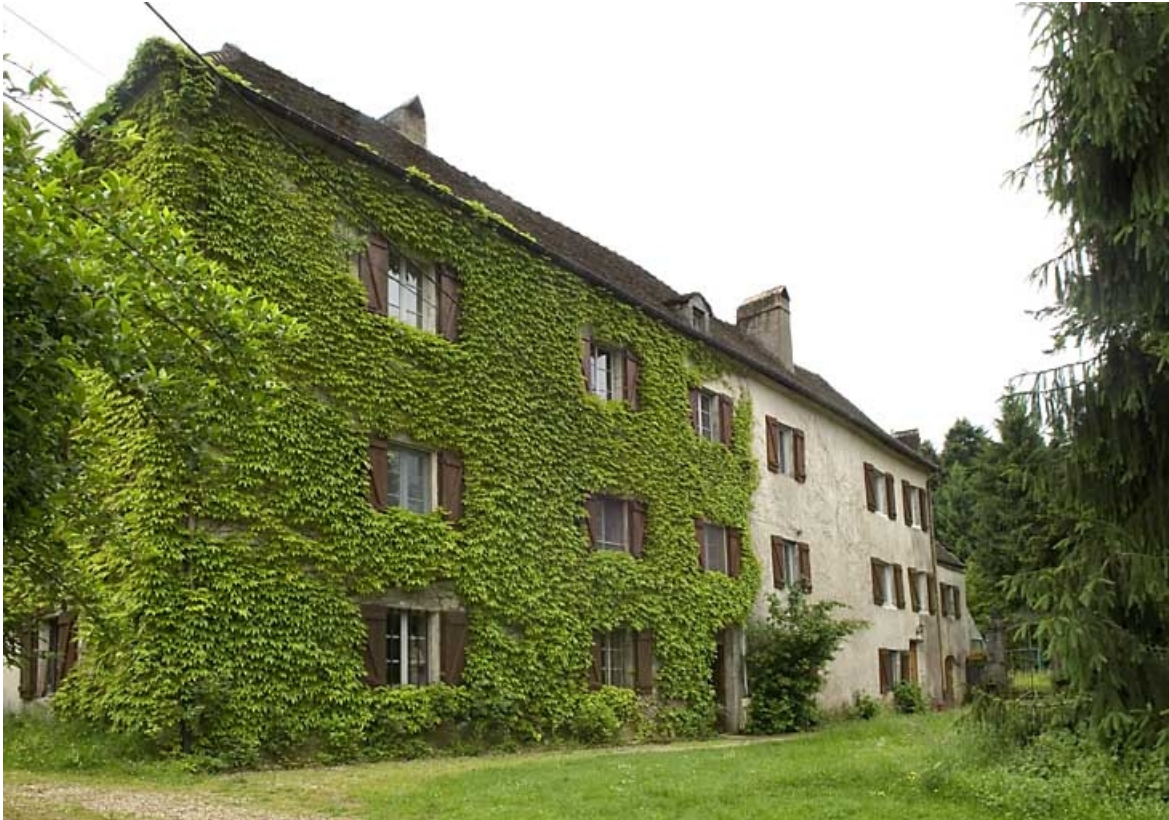
Logement patronal. Élévation ouest.