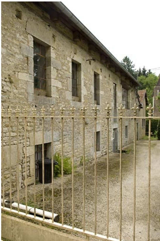
Façade ouest de l'atelier de fabrication (cadrage vertical).