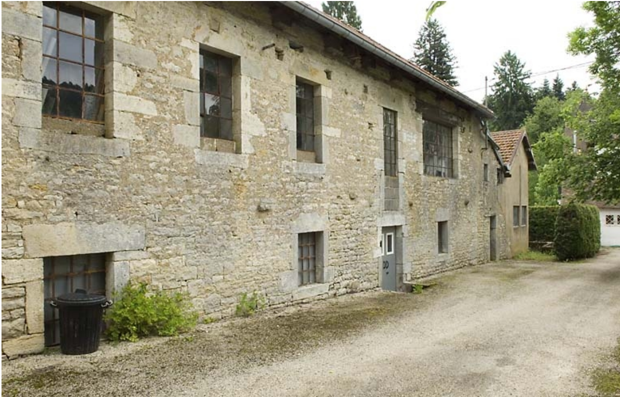
Façade ouest de l'atelier de fabrication.