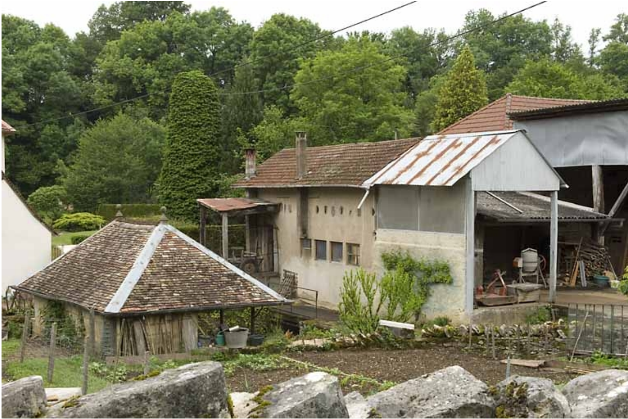
Les bâtiments industriels depuis le sud-est.