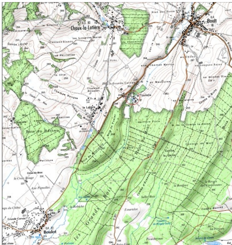
Carte de localisation. Carte topographique au 1:25000, I.G.N., Rioz, 3322 E. SCAN 25 70, Boulton, lieu-dit : la Tournelle