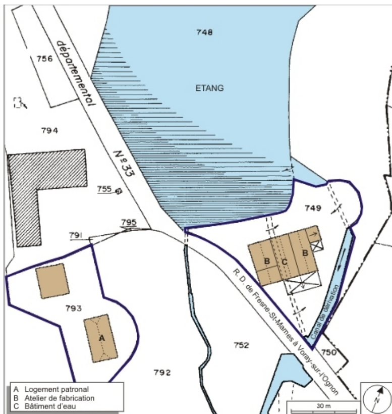
Plan-masse et de situation. Extrait du plan cadastral numérisé, 2008, section B, 1:1250 agrandi à 1:1000.

70, Montarlot-lès-Rioz R.D. 33, lieudit : la Tréfilerie