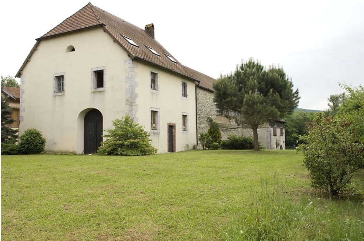
Le moulin vu de trois quarts.