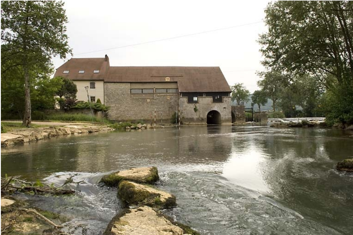
Vue d'ensemble depuis l'Ognon, en aval.