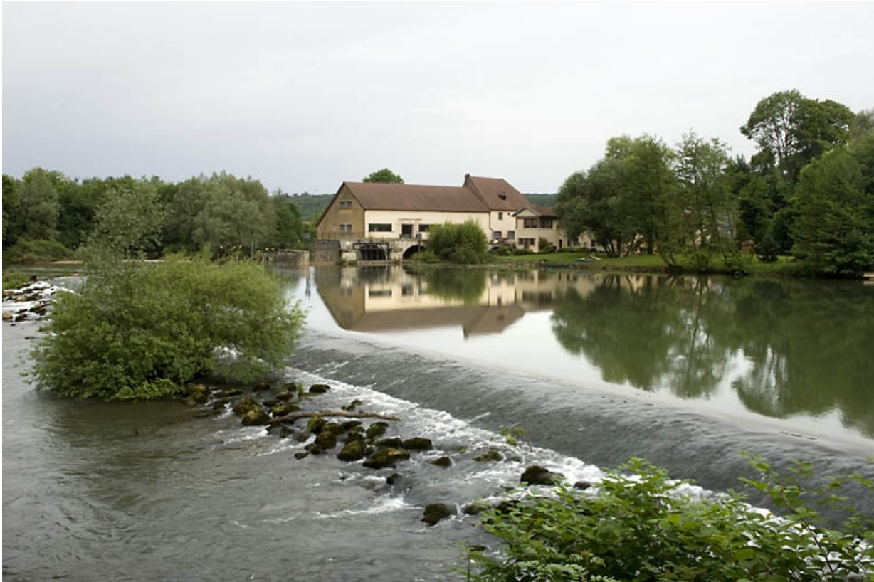
Vue d'ensemble depuis la rive gauche.