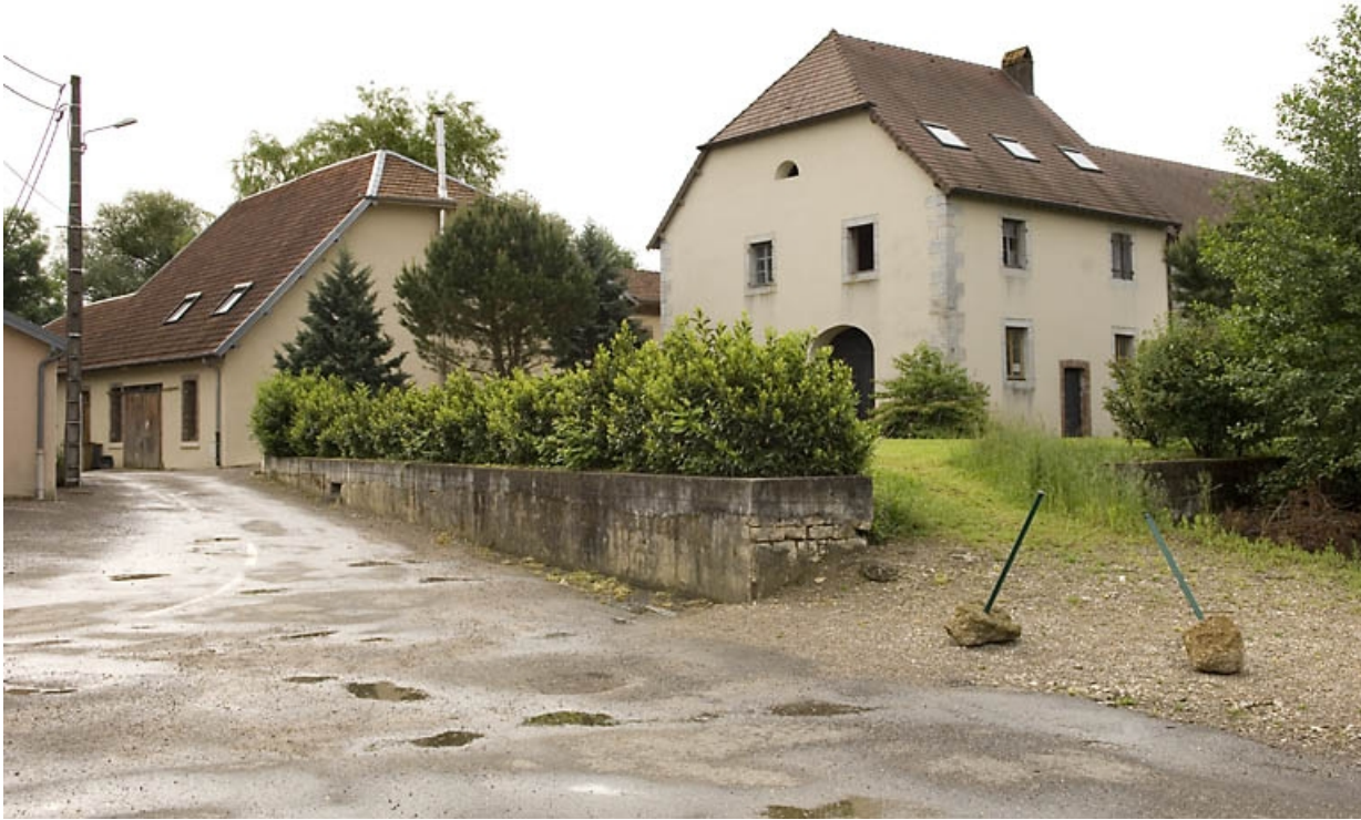
Logement et moulin vus de trois quarts.