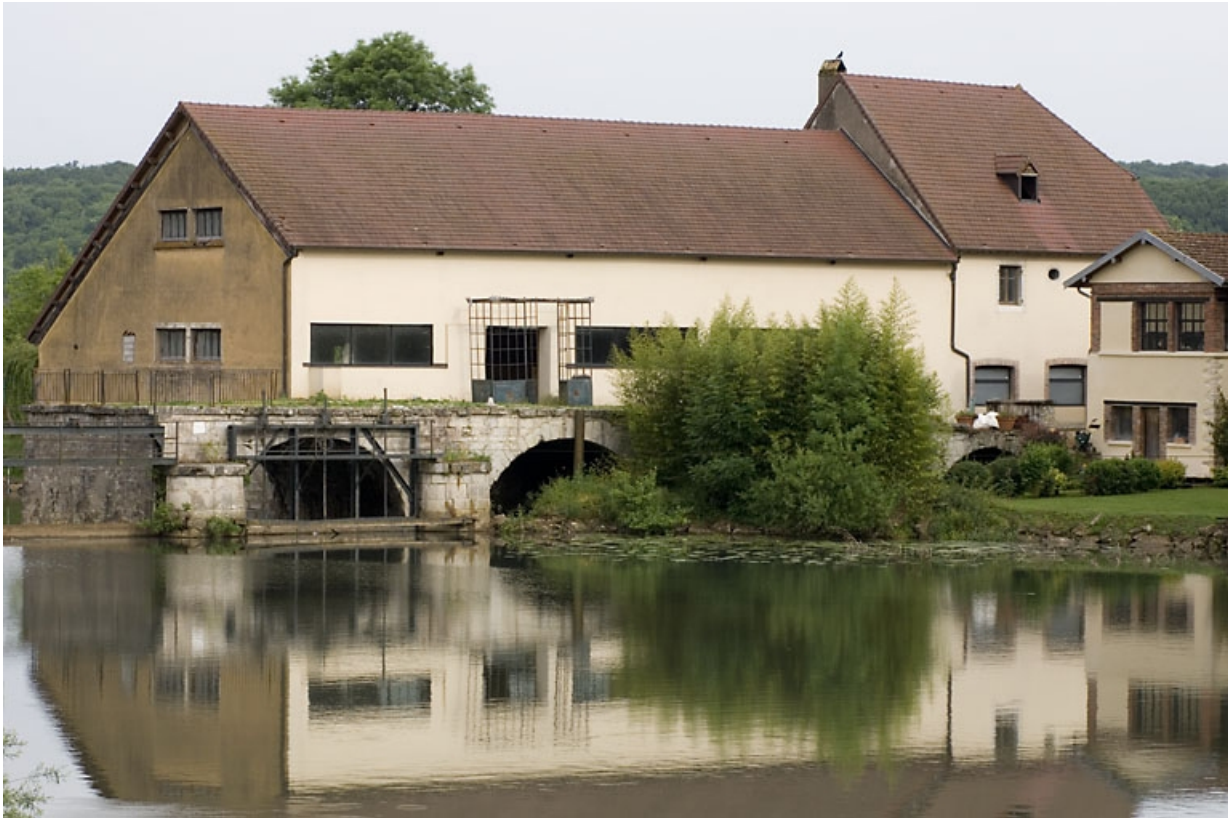
Façade est, vue de trois quarts.