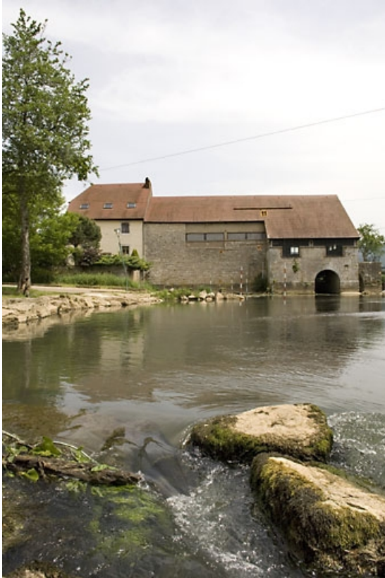
Façade ouest, depuis l'aval.