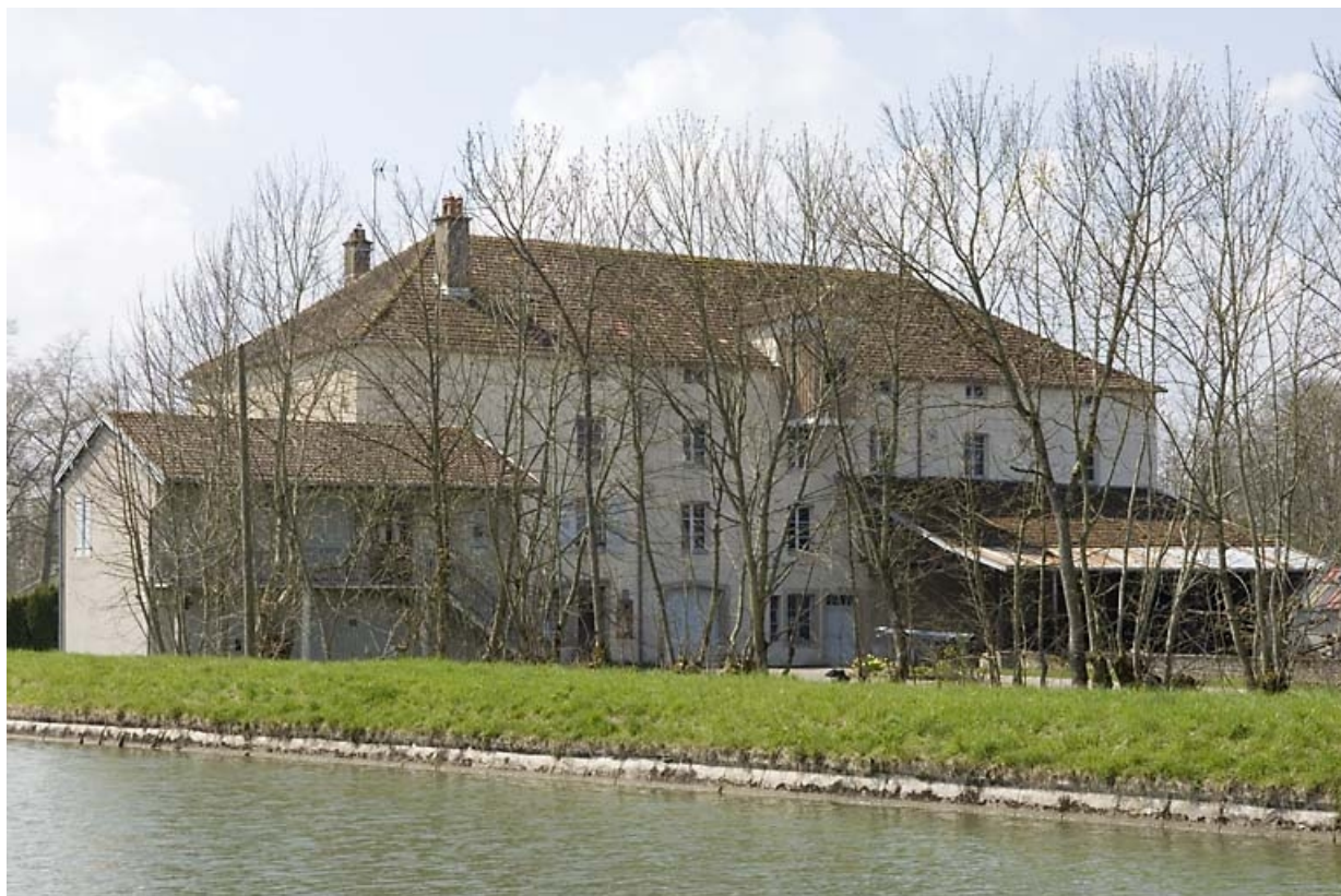
Façade antérieure vue de trois quarts gauche.

70, Ormoy, lieudit : le Moulin de Sainte-Clotilde