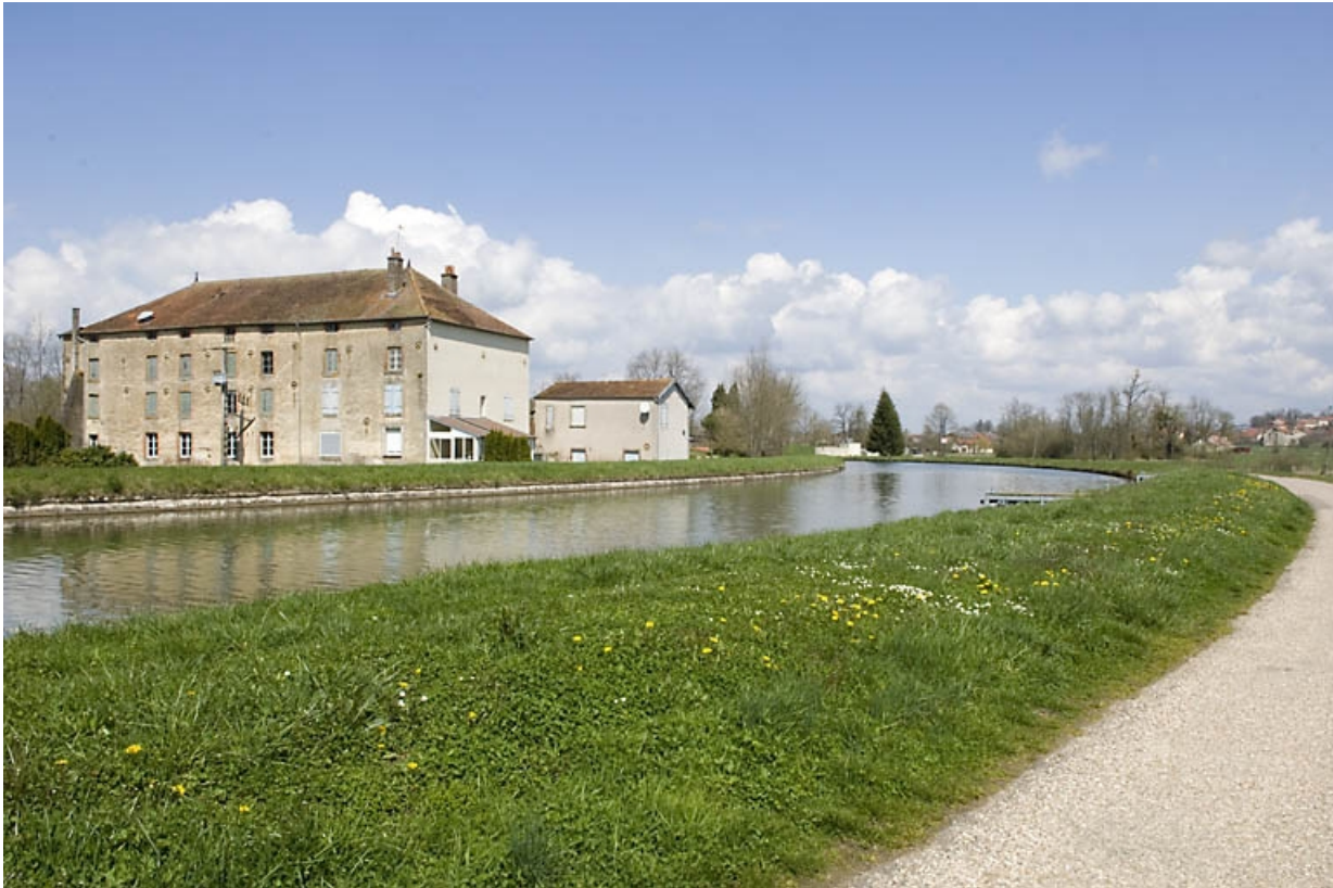
Vue d'ensemble depuis le sud-est.

70, Ormoy, lieudit : le Moulin de Sainte-Clotilde