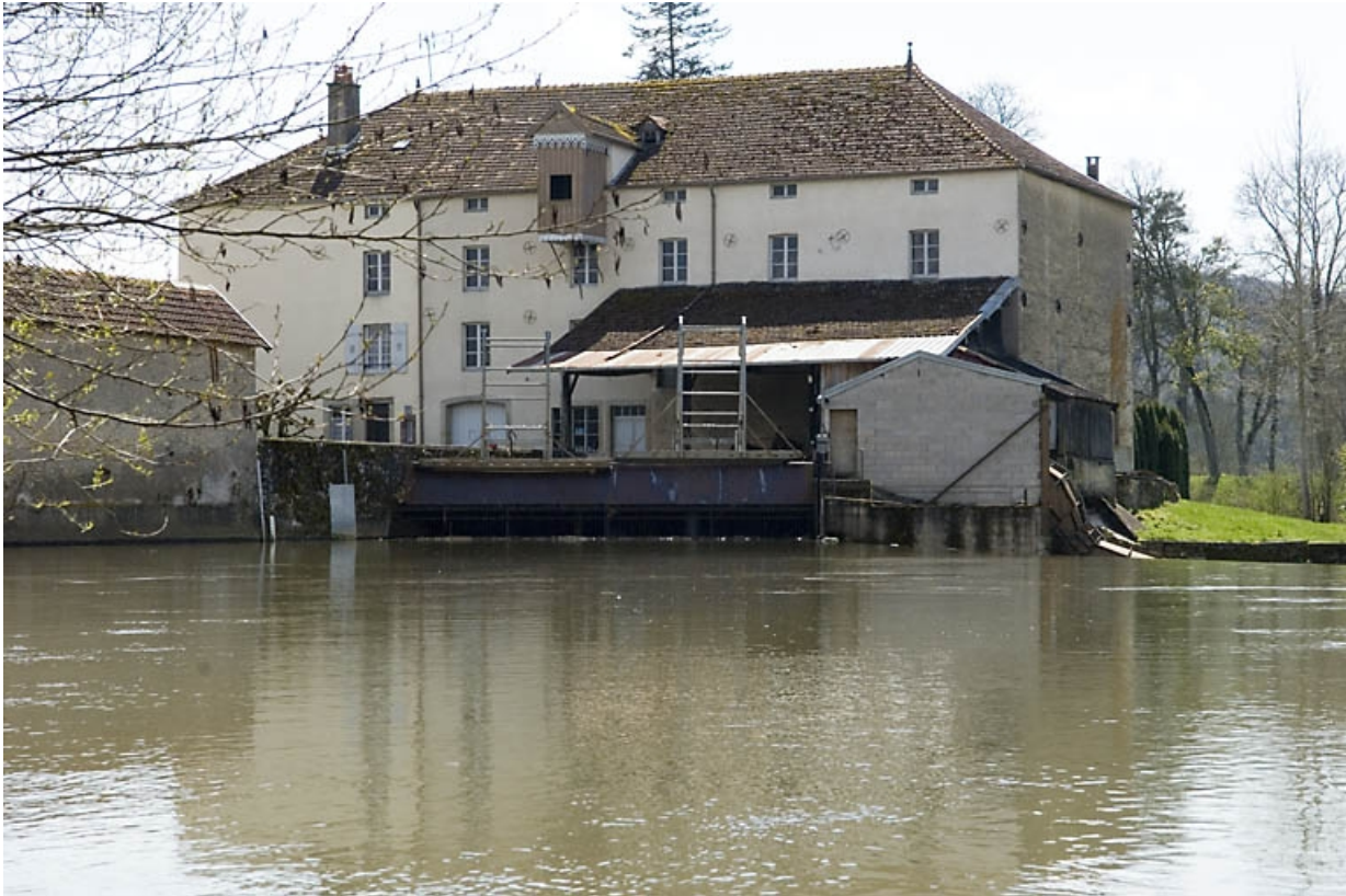
Façade antérieure depuis l'amont.

70, Ormoy, lieudit : le Moulin de Sainte-Clotilde