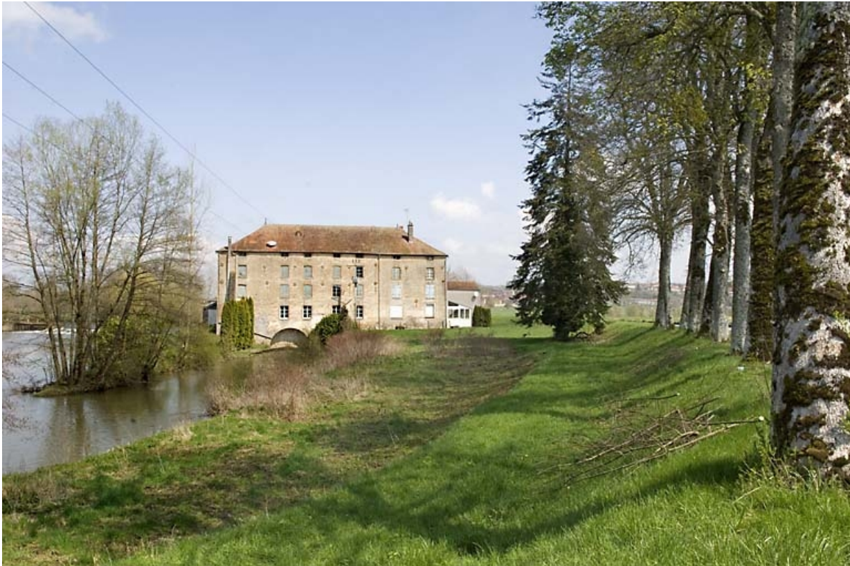
Vue d'ensemble depuis le sud-ouest.

70, Ormoy, lieudit : le Moulin de Sainte-Clotilde