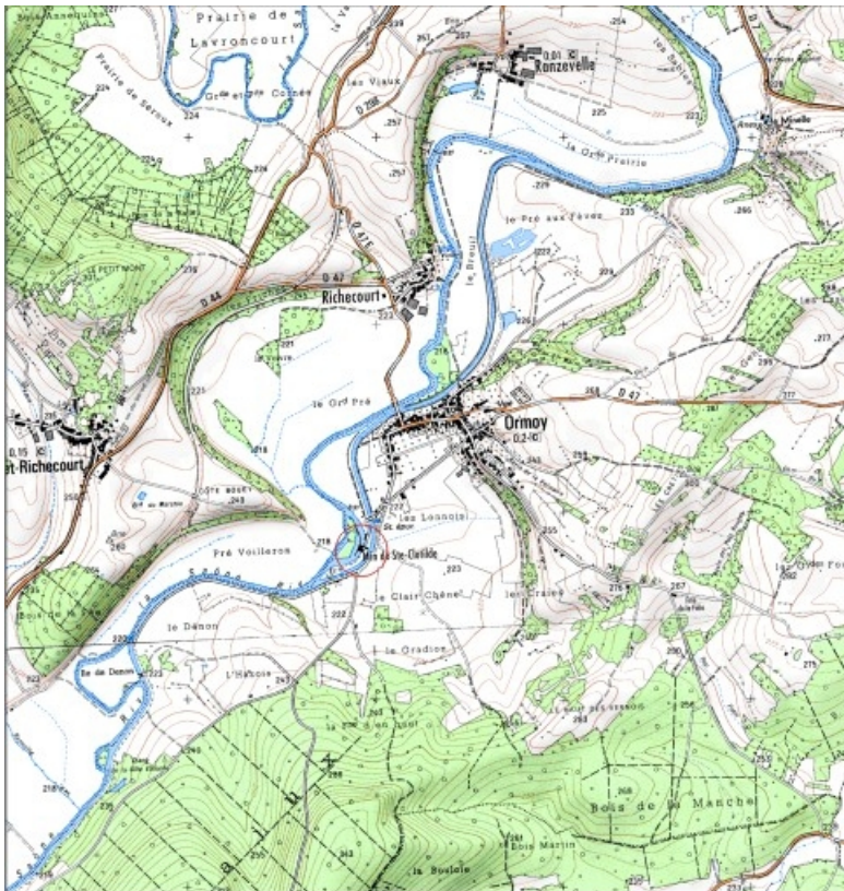
Carte de localisation. Carte topographique au 1:25000, I.G.N., Jussey, 3320 O. SCAN 25, Licence n°2008CISE29-68. 70, Ormoy, lieudit : le Moulin de Sainte-Clotilde