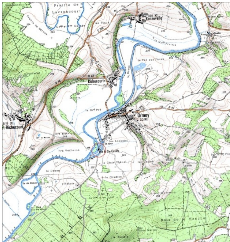
Carte de localisation. Carte topographique au 1:25000, I.G.N., Jussey, 3320 O. 70, Ormoy, lieudit : le Moulin de Sainte-Clotilde