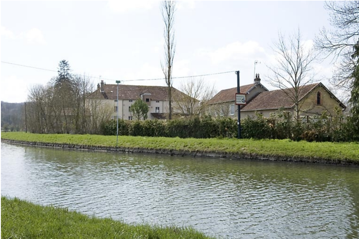
Vue d'ensemble depuis le sud.

70, Ormoy, lieudit : le Moulin de Sainte-Clotilde