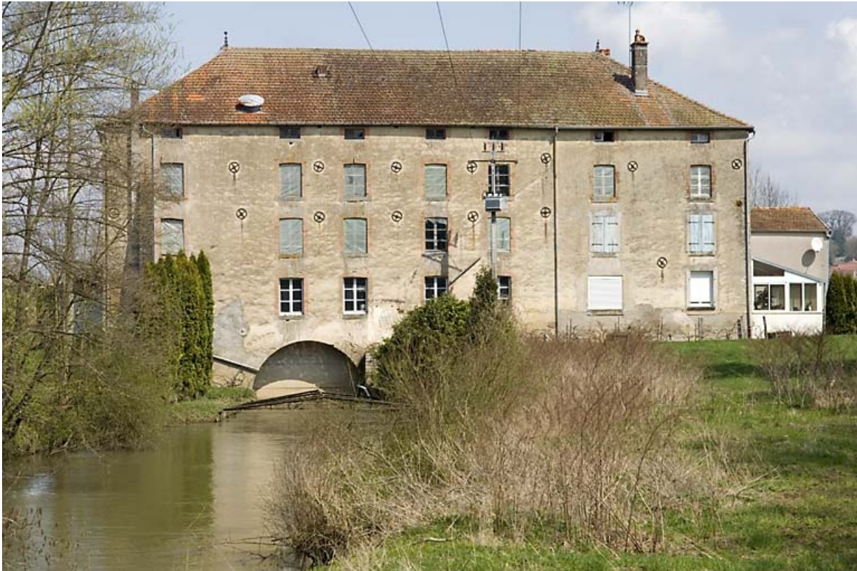
Façade postérieure vue de face.

70, Ormoy, lieudit : le Moulin de Sainte-Clotilde