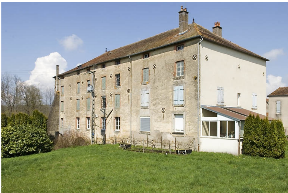
Façade postérieure vue de trois quarts arrière.

70, Ormoy, lieudit : le Moulin de Sainte-Clotilde