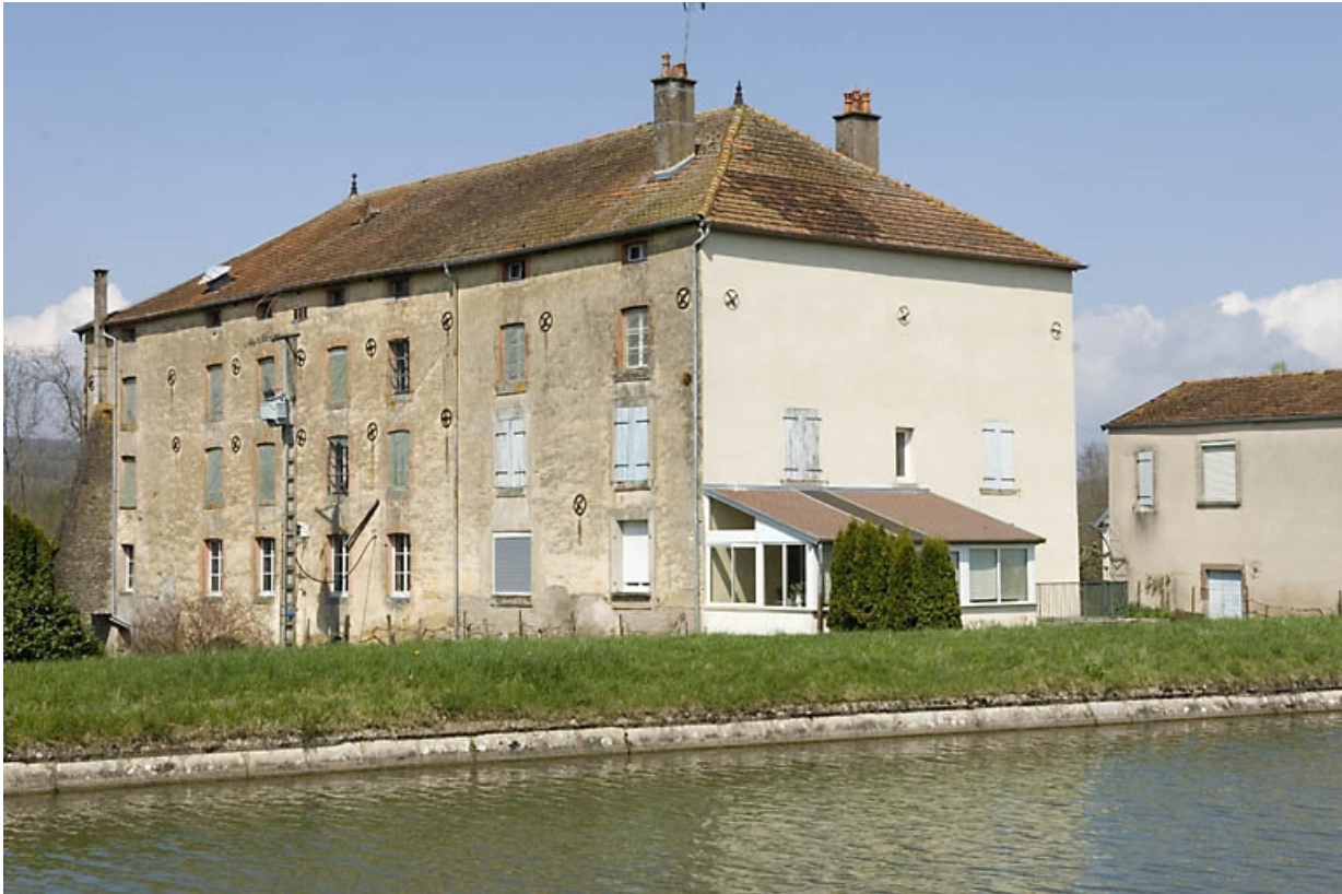
La minoterie vue de trois quarts arrière.

70, Ormoy, lieudit : le Moulin de Sainte-Clotilde