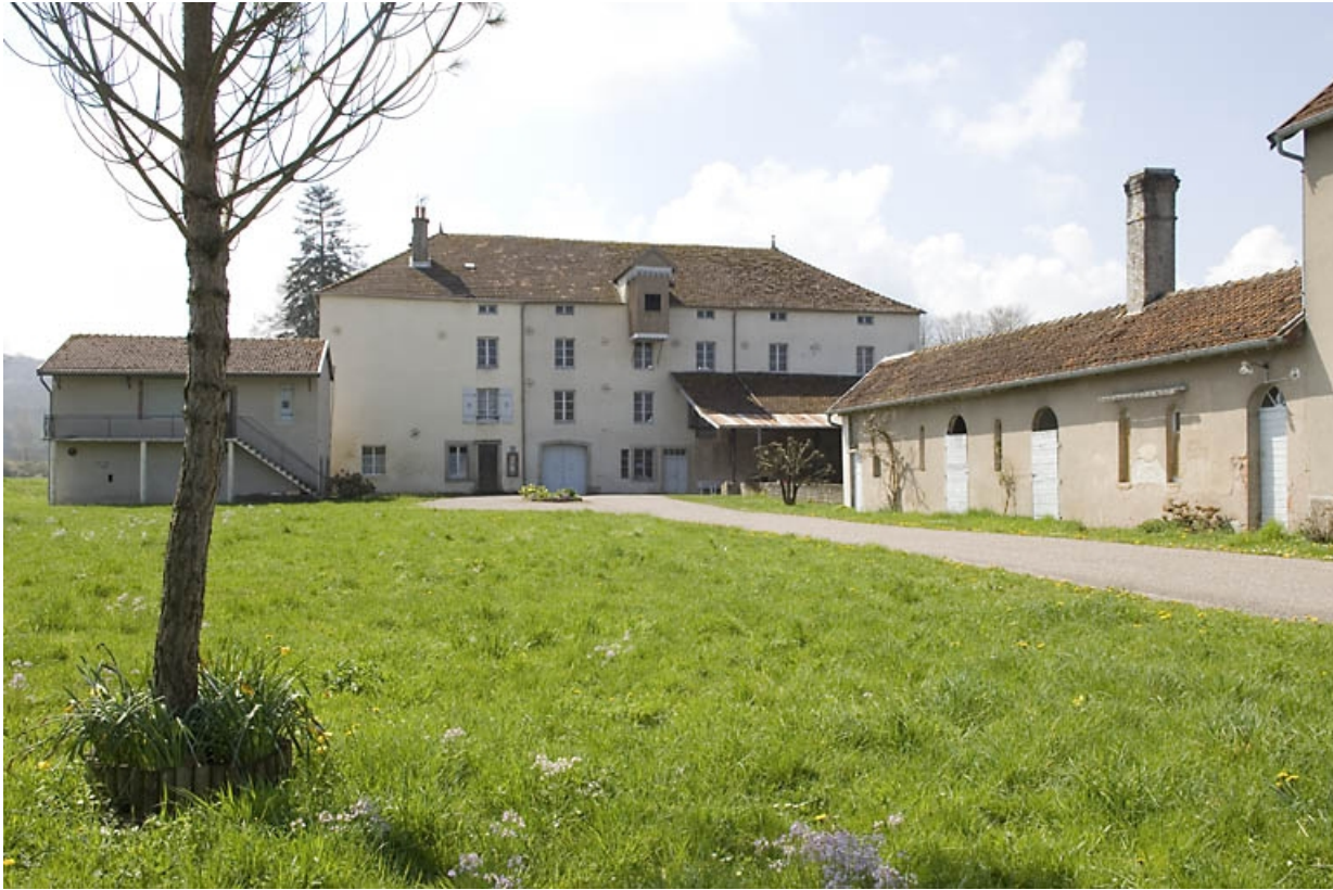
Façade antérieure et dépendances depuis l'entrée.

70, Ormoy, lieudit : le Moulin de Sainte-Clotilde