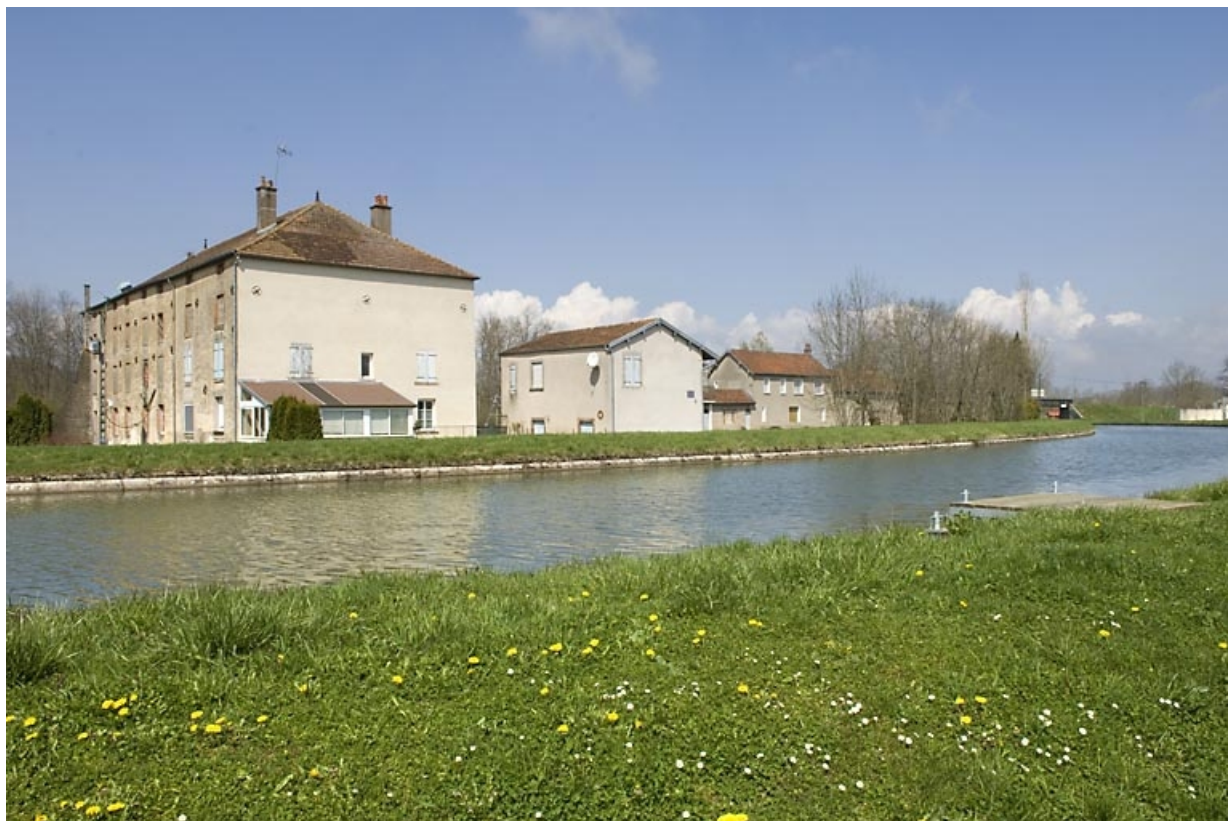
Vue rapprochée depuis le sud-est.

70, Ormoy, lieudit : le Moulin de Sainte-Clotilde