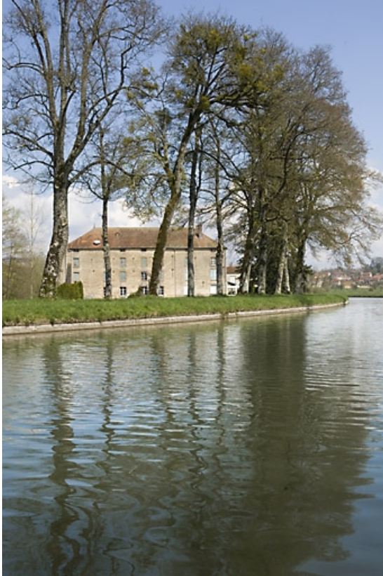
Vue d'ensemble depuis le sud.

70, Ormoy, lieudit : le Moulin de Sainte-Clotilde