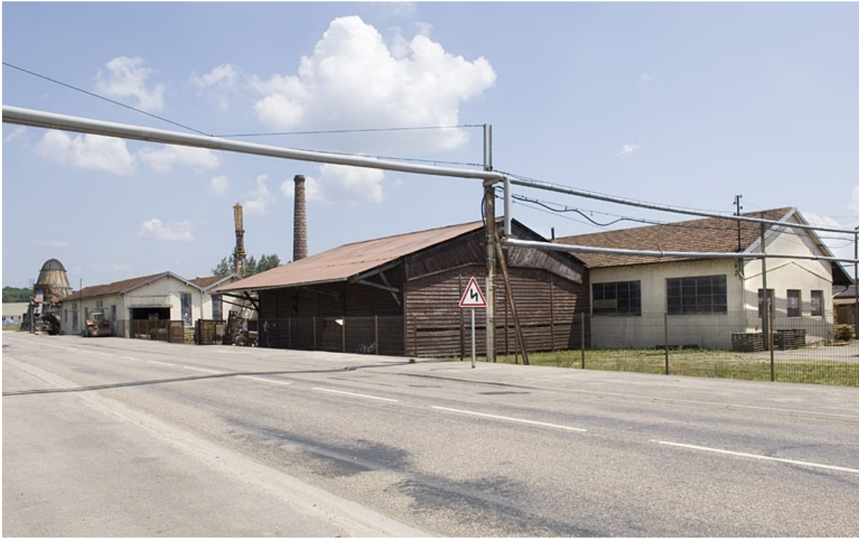
Vue d'ensemble depuis la rue Emile Hauviller.