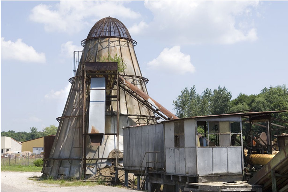
Poste d'écorçage et four à écorces.