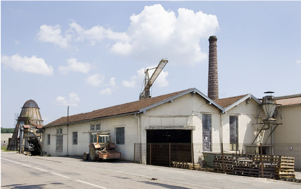
Atelier de fabrication (scie à ruban).