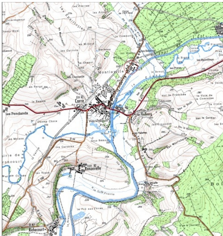
Carte de localisation. Carte topographique au 1:25000, I.G.N., Jussey, 3320 O. SCAN 25, Licence n°2008CISE29-68. 70, Corre, 65 rue Emile Hauviller