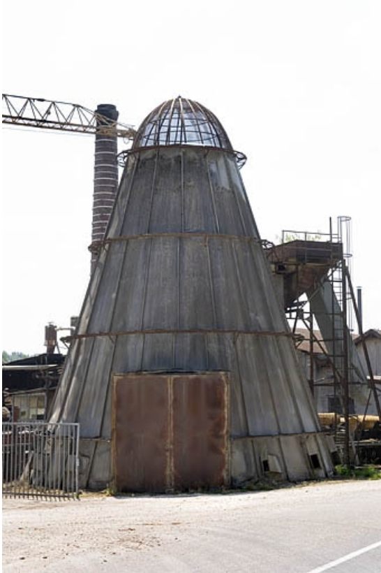
Four à écorces américain, depuis le nord-ouest. 70, Corre, 65 rue Emile Hauviller