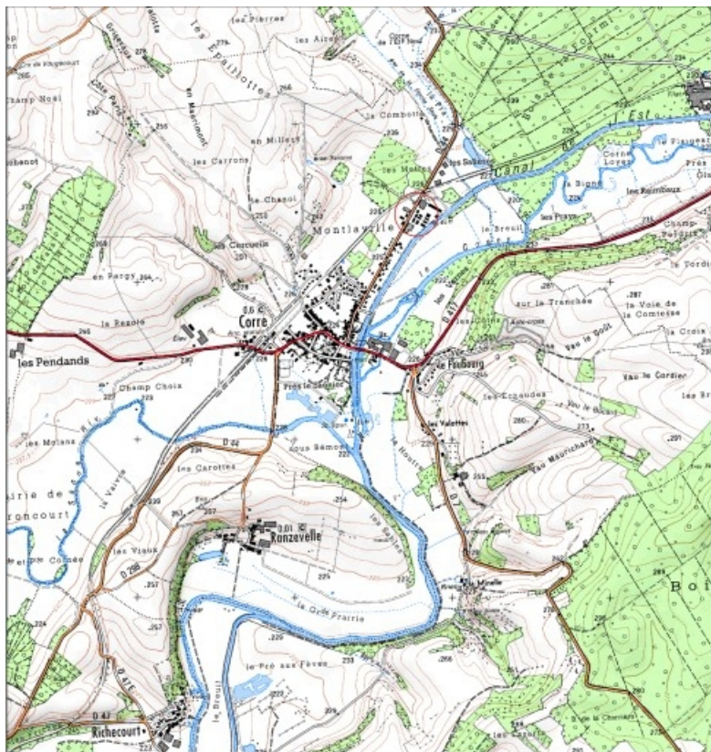
Carte de localisation. Carte topographique au 1:25000, I.G.N., Jussey, 3320 O. 70, Corre, 65 rue Emile Hauviller