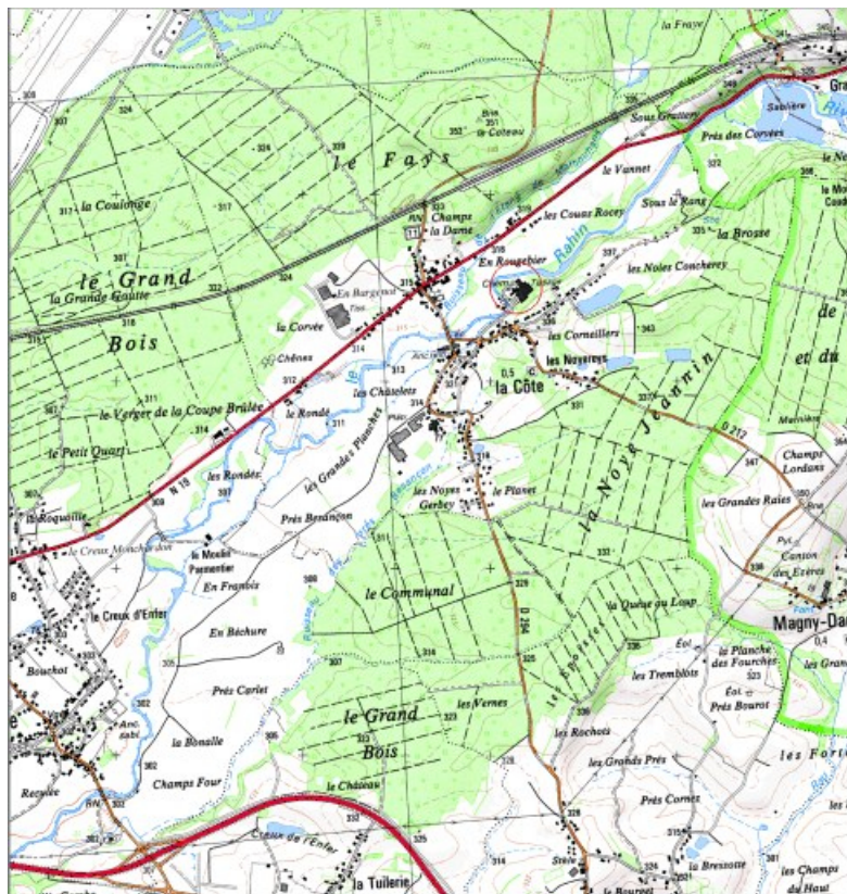
Carte de localisation. Carte topographique au 1:25000, I.G.N., Lure, 3521 O. 70, La Côte rue du Tissage