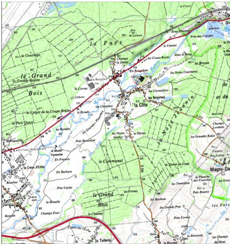
Carte de localisation. Carte topographique au 1:25000, I.G.N., Lure, 3521 O. SCAN 25, Licence n°2008CISE29-68. 70, La Côte rue du Tissage