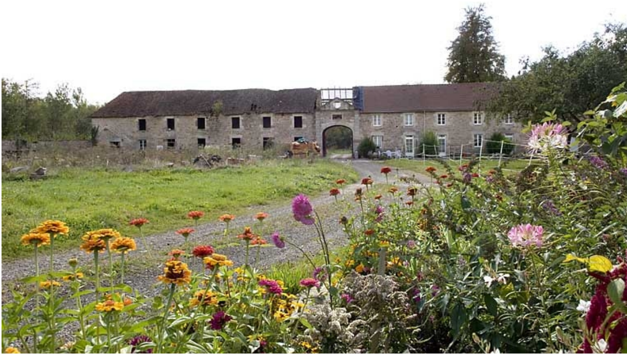
Corps de bâtiment des logements. Vue depuis le nord.