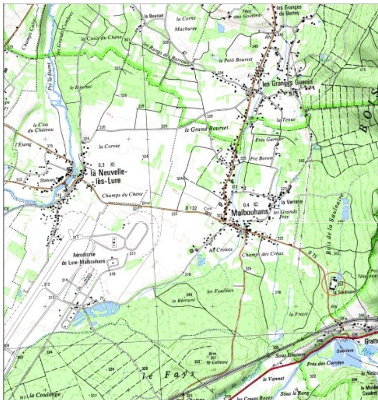
Carte de localisation. Carte topographique au 1:25000, I.G.N., Mésisey, 3520 O. SCAN 25, Licence n°2008CISE29-68. 70, Malbouhans, lieu-dit : la Saulnaire