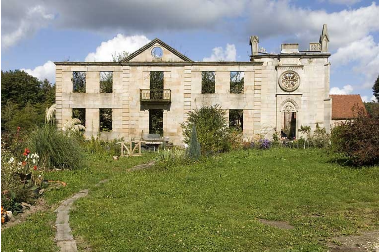
Logement patronal et chapelle. Façade antérieure.