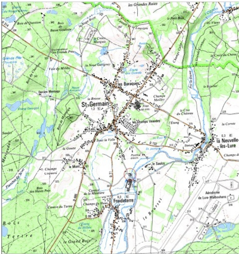
Carte de localisation. Carte topographique au 1:25000, I.G.N., Lure, 3520 O. 70, Saint-Germain, lieudit : le Saulcy