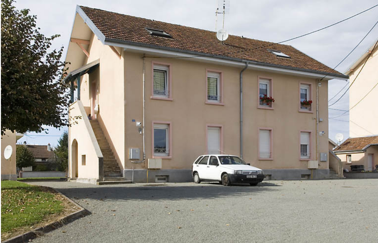
Logement ouvrier. Vue de trois quarts. 70, Saint-Germain, 38 rue des Vosges