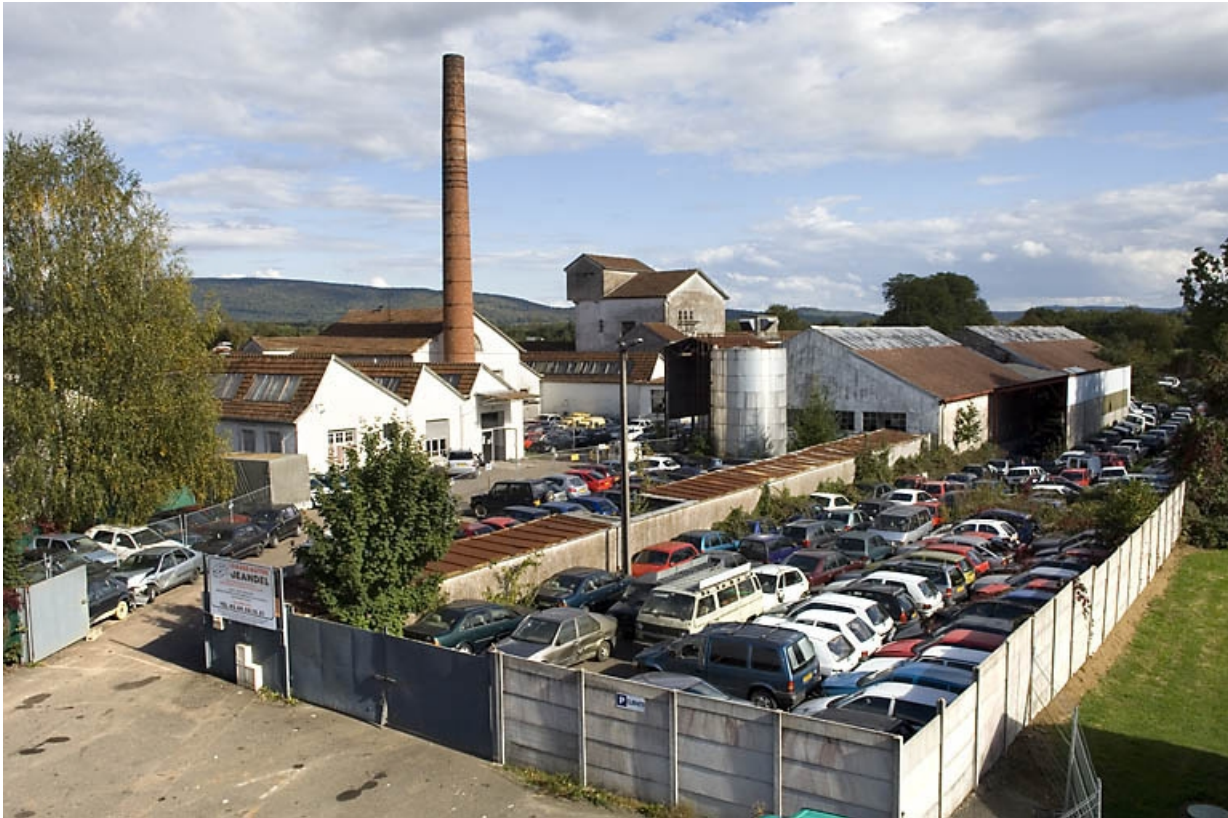
Vue plongeante depuis l'ouest.