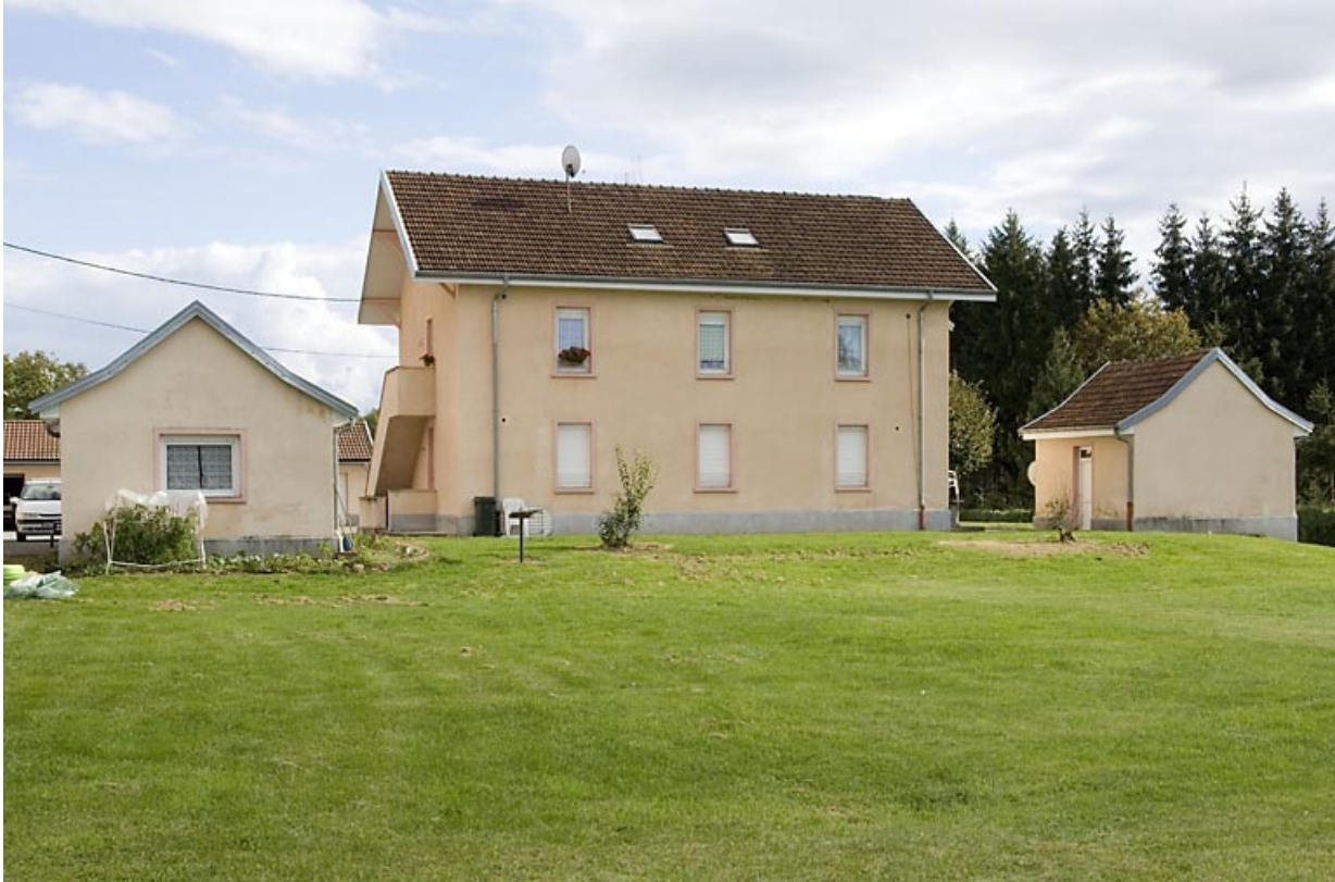
Logement ouvrier. Façade depuis la route.