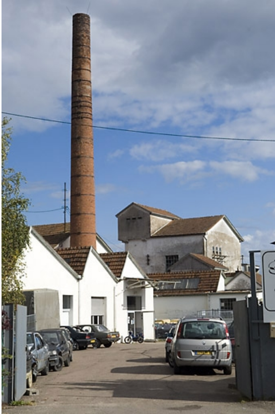
Vue depuis l'entrée.