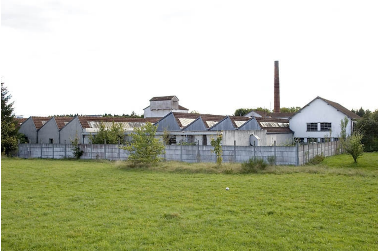
Vue rapprochée depuis le nord.