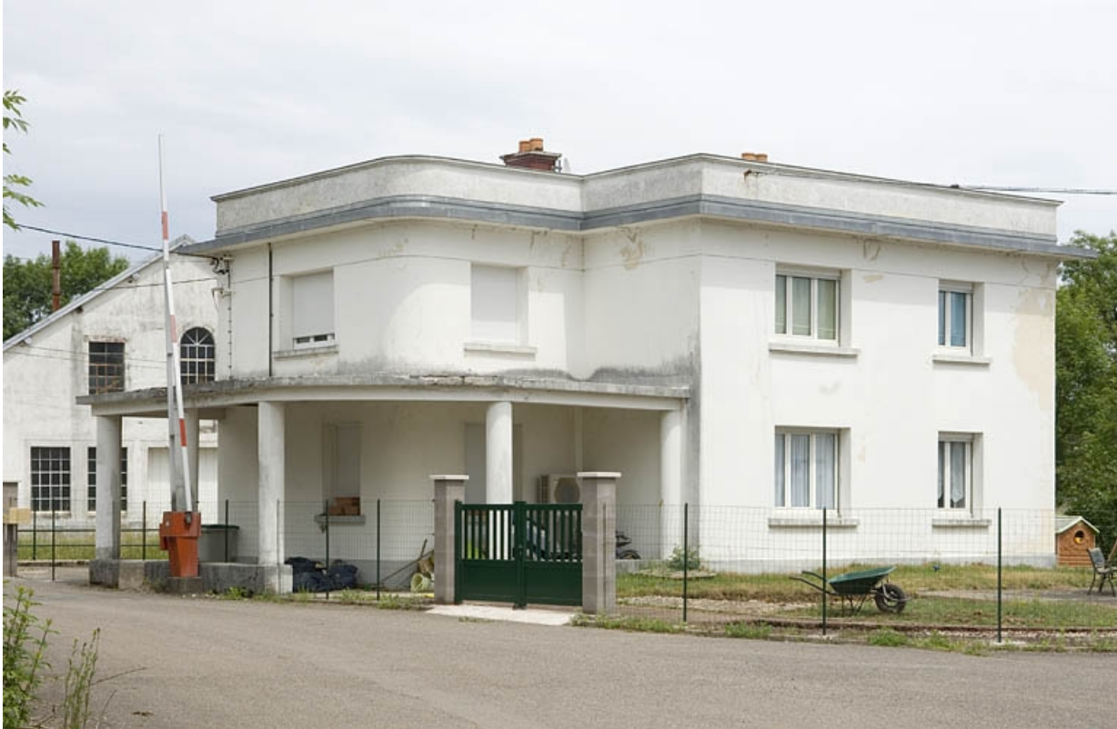
La conciergerie vue depuis la cour.