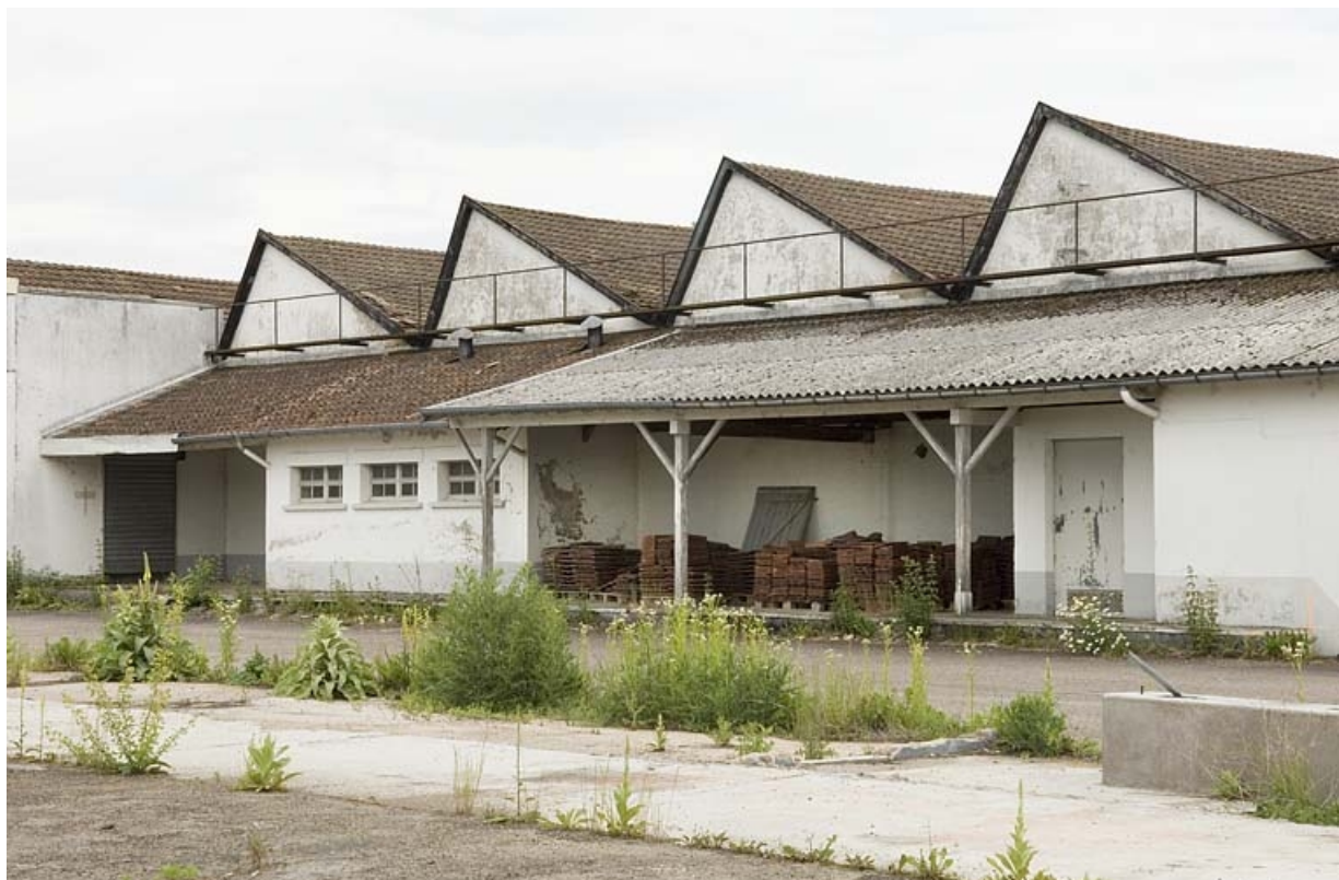
Détail des pignons des sheds de l'atelier de fabrication.