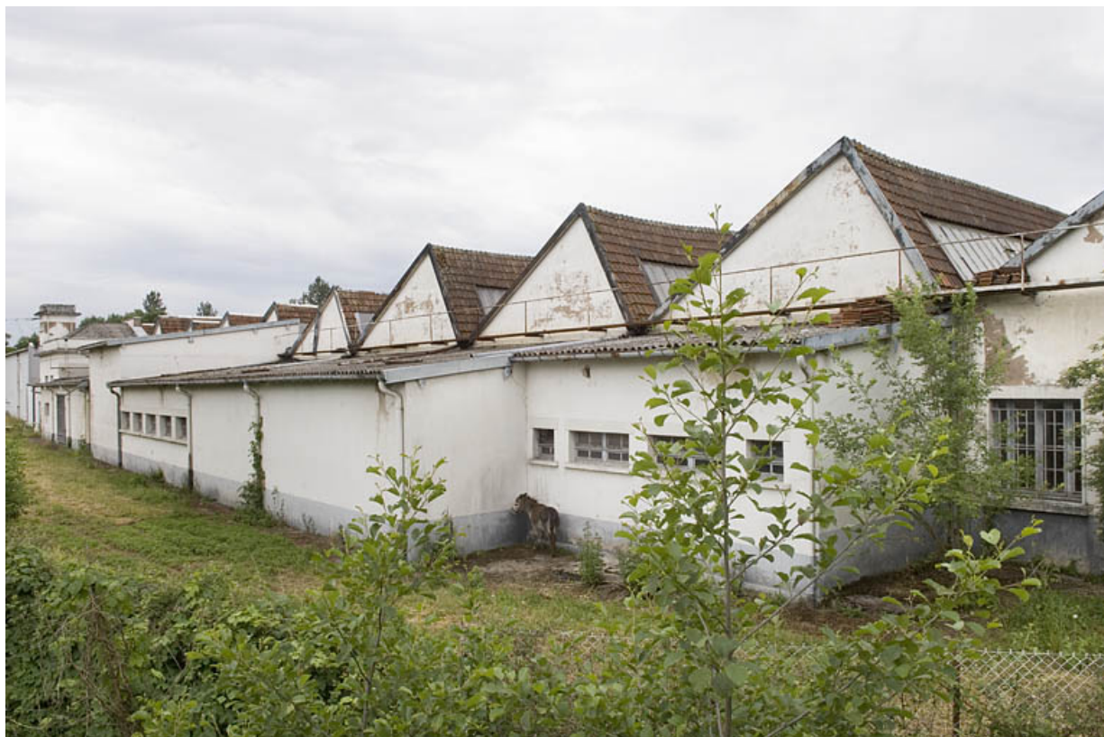
Façade est vue de trois quarts.