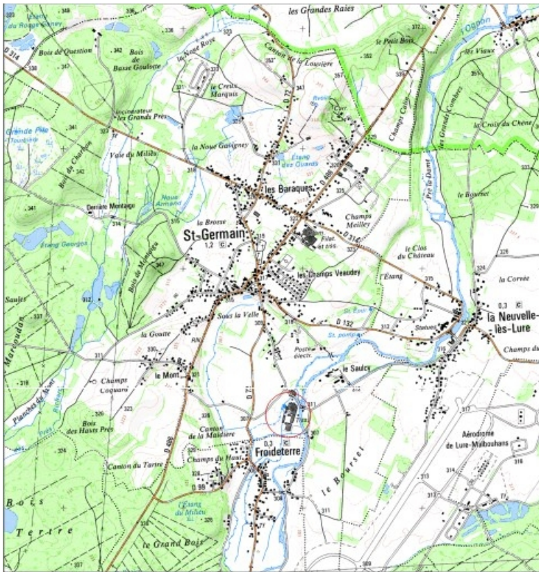
Carte de localisation. Carte topographique au 1:25000, I.G.N., Lure, 3520 O. 70, Saint-Germain, lieudit : le Saulcy