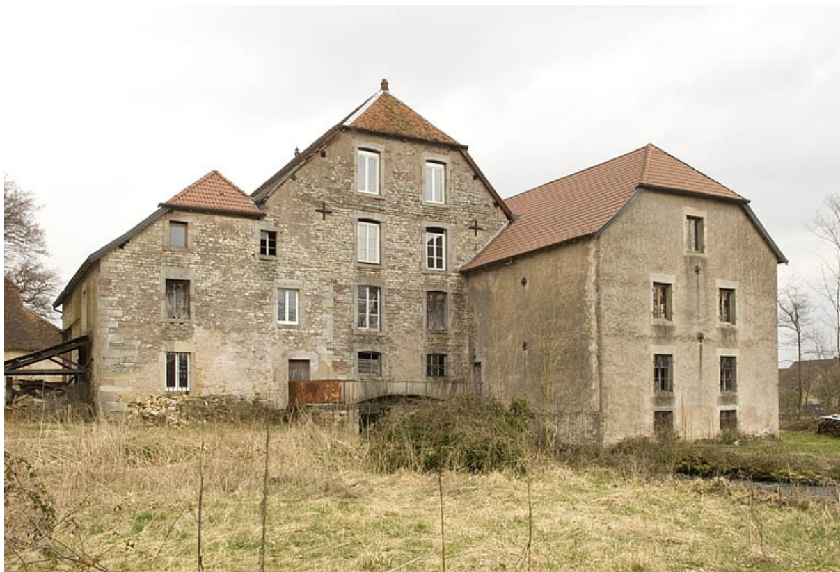
Vue de trois quarts, depuis l'ouest.