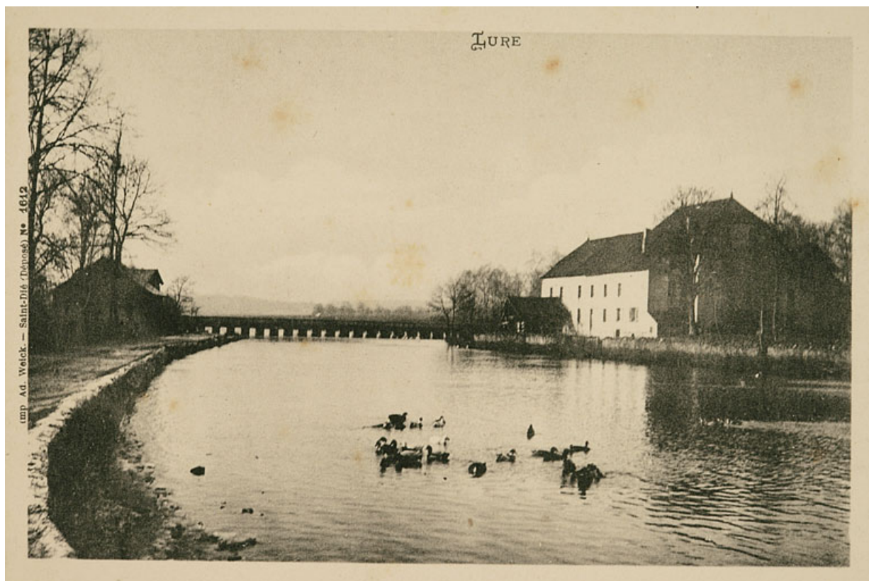
Lure. Moulin du Magny-Vernois.