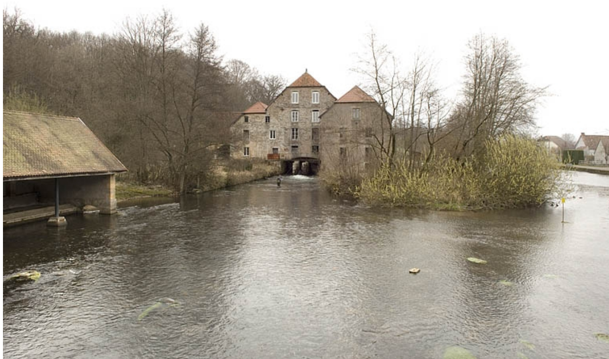
Vue d'ensemble depuis le pont.