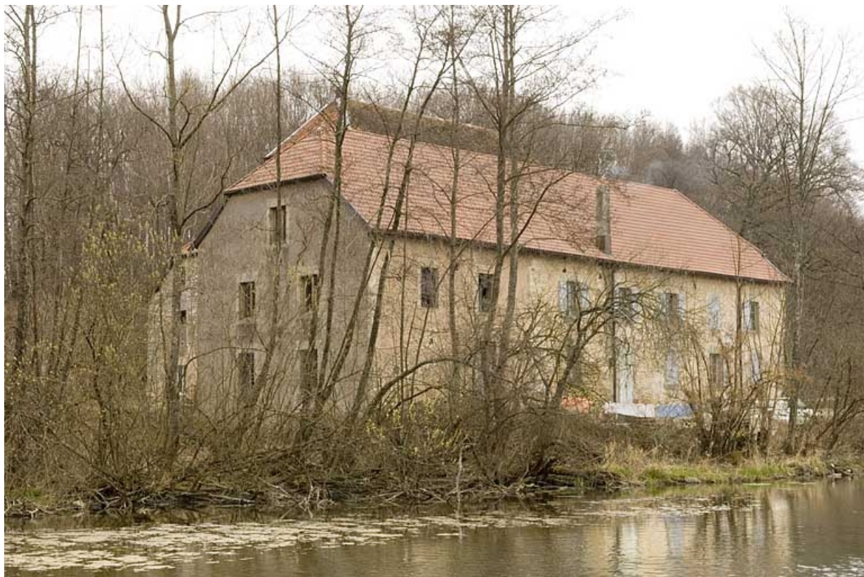
Vue rapprochée depuis le sud.