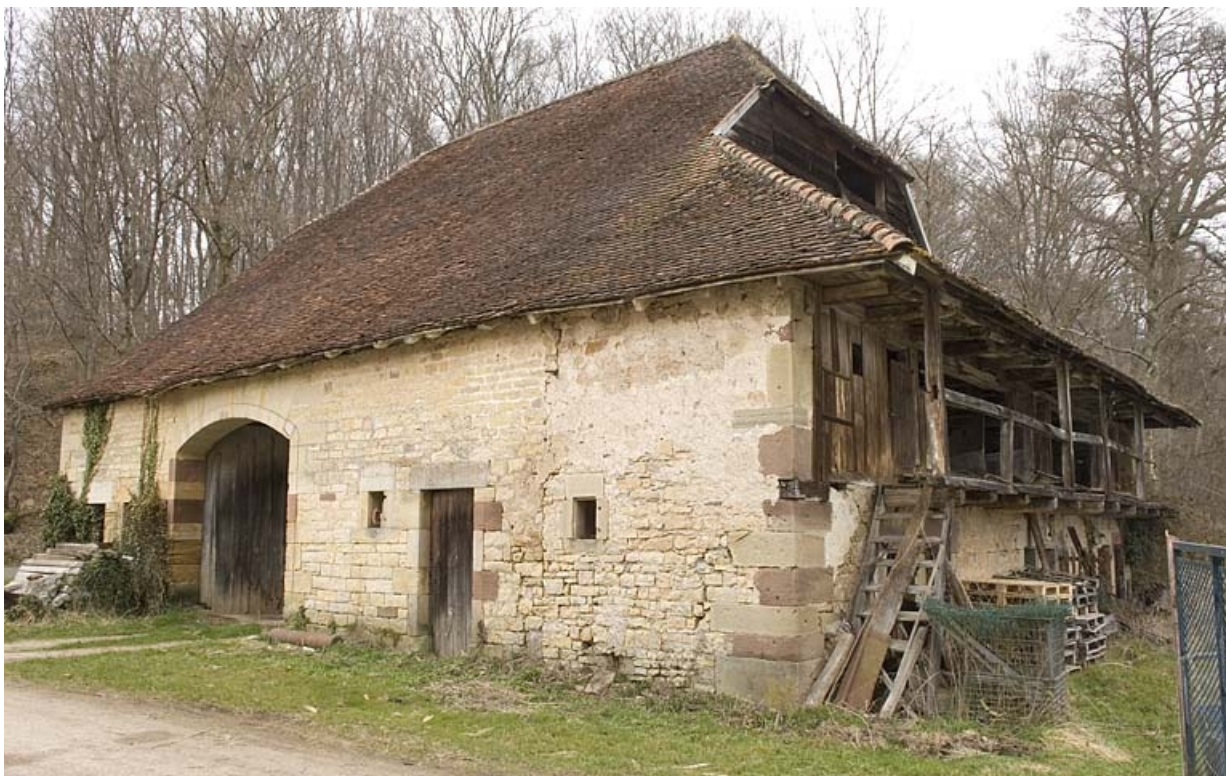
Bâtiment agricole (remise, grange, écurie). Vue de trois quarts.