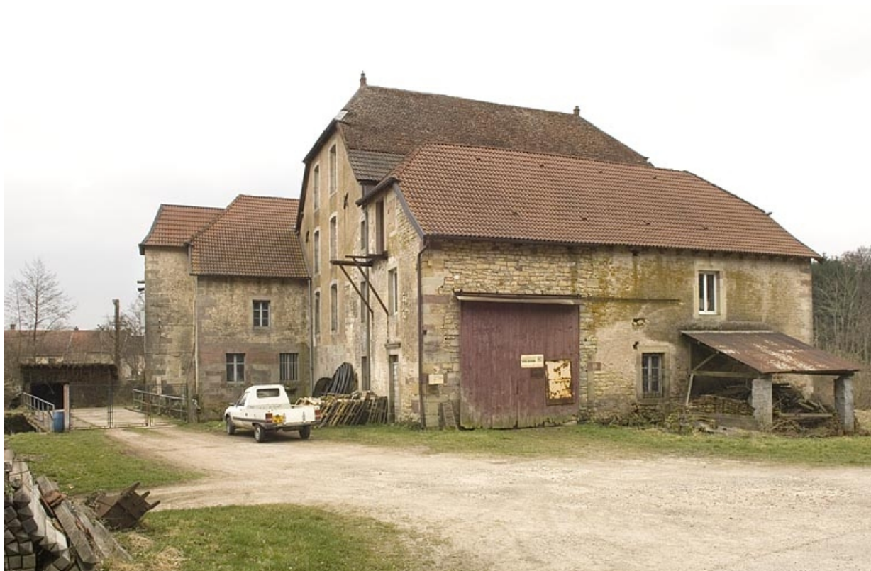
Vue depuis l'ouest.