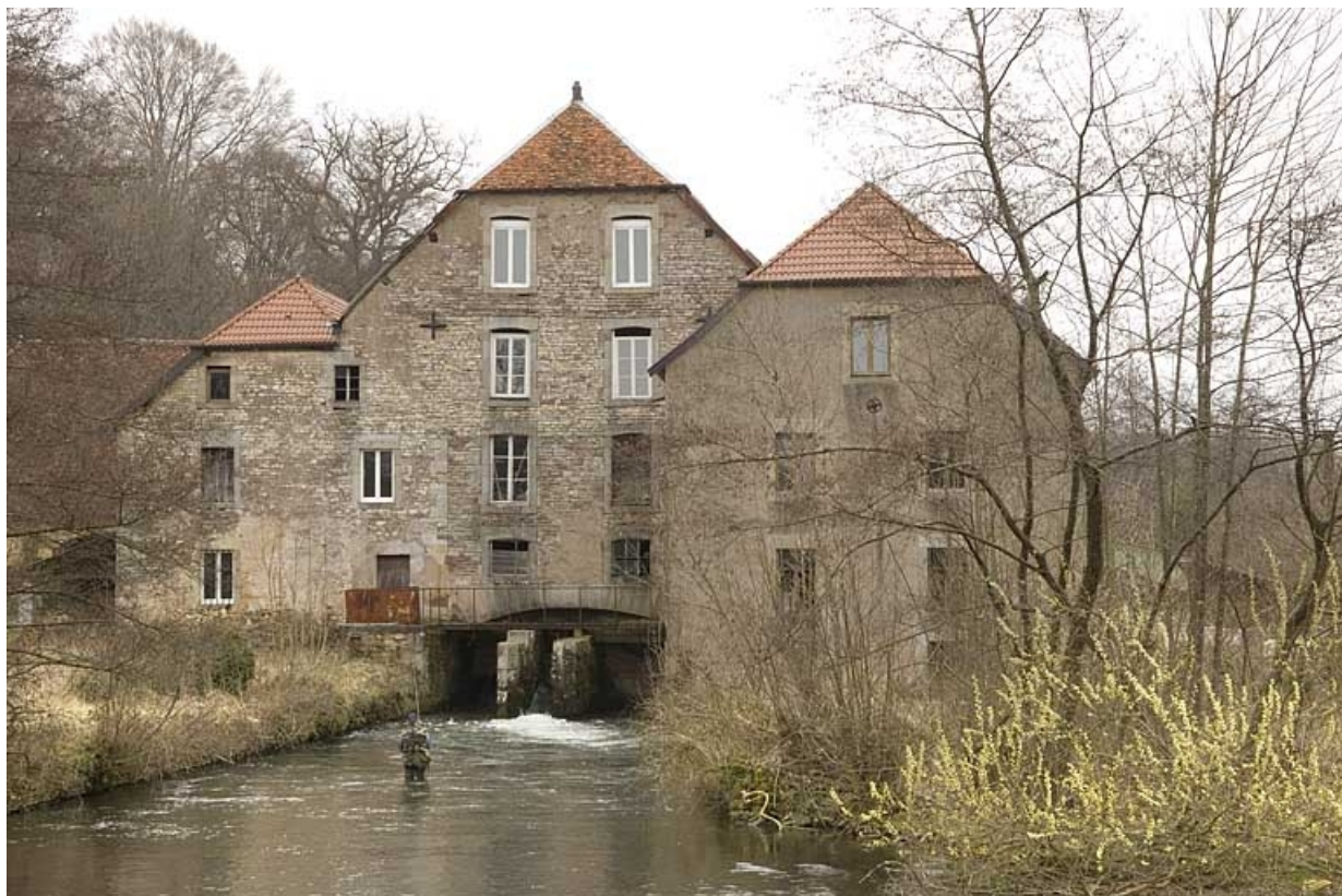
Vue rapprochée depuis l'aval du bief.