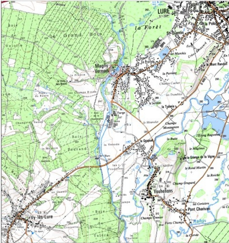
Carte de localisation. Carte topographique au 1:25000, I.G.N., Villersexel, 3421 E. 70, Magny-Vernois, lieu-dit : le Moulin