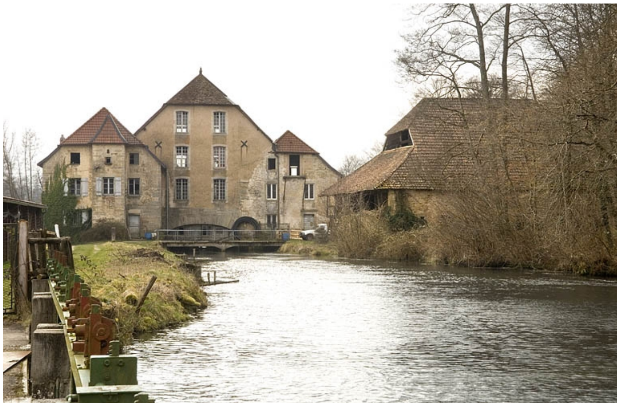
Vue d'ensemble depuis l'amont.