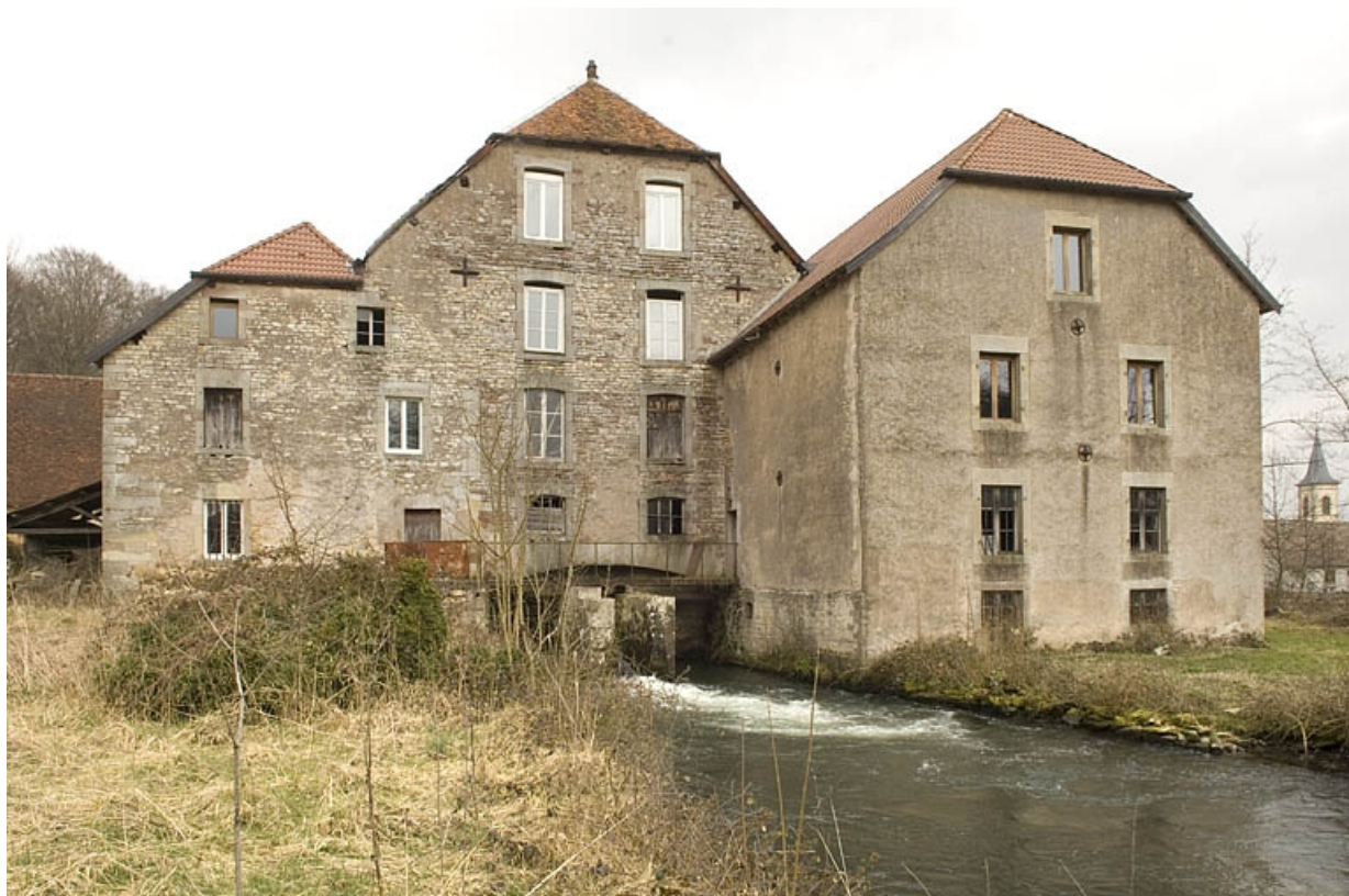
Vue rapprochée depuis la rive droite.