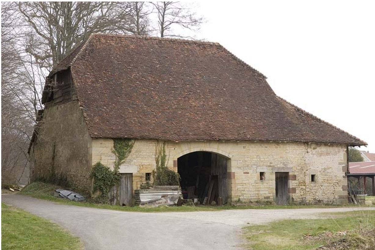
Bâtiment agricole (remise, grange, écurie).