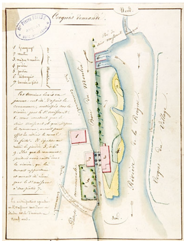
[Plan-masse et de situation du moulin].