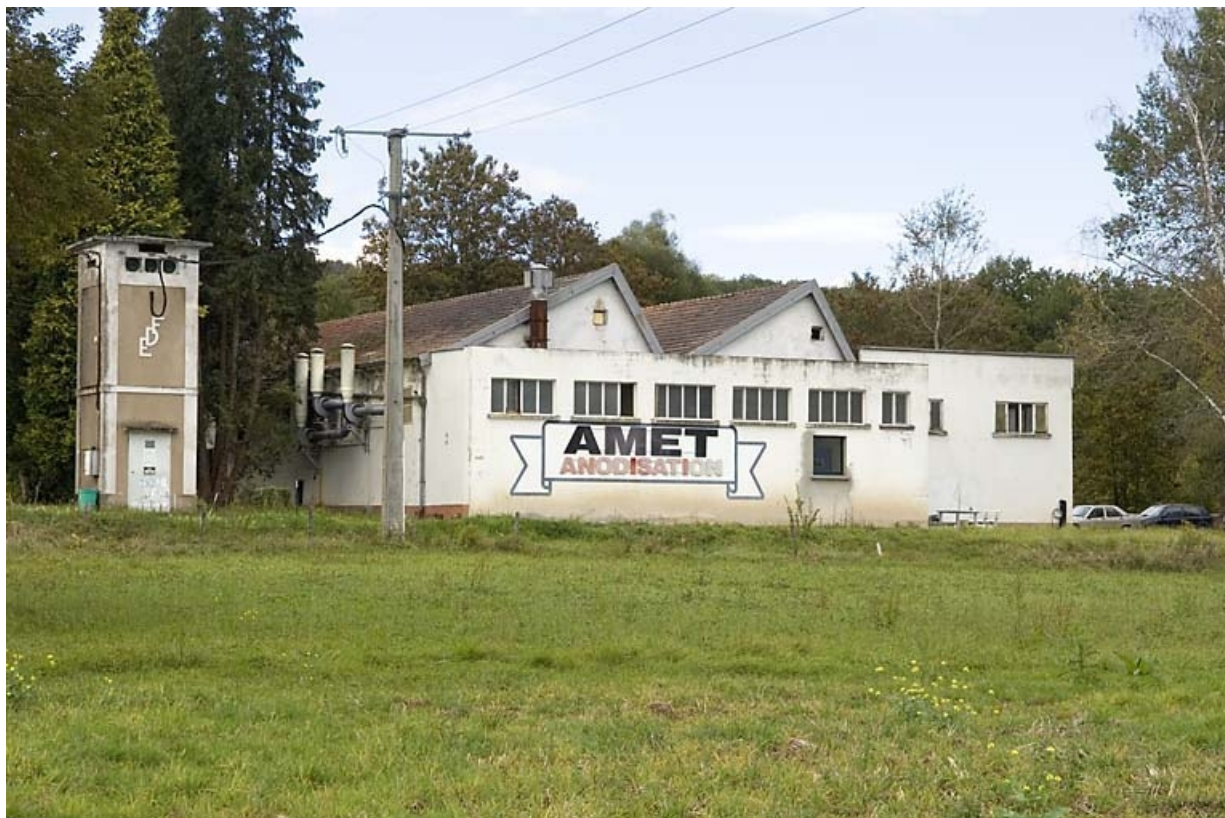
Vue depuis le sud.

70, Genevreville route de la Gare, lieudit : la Conche