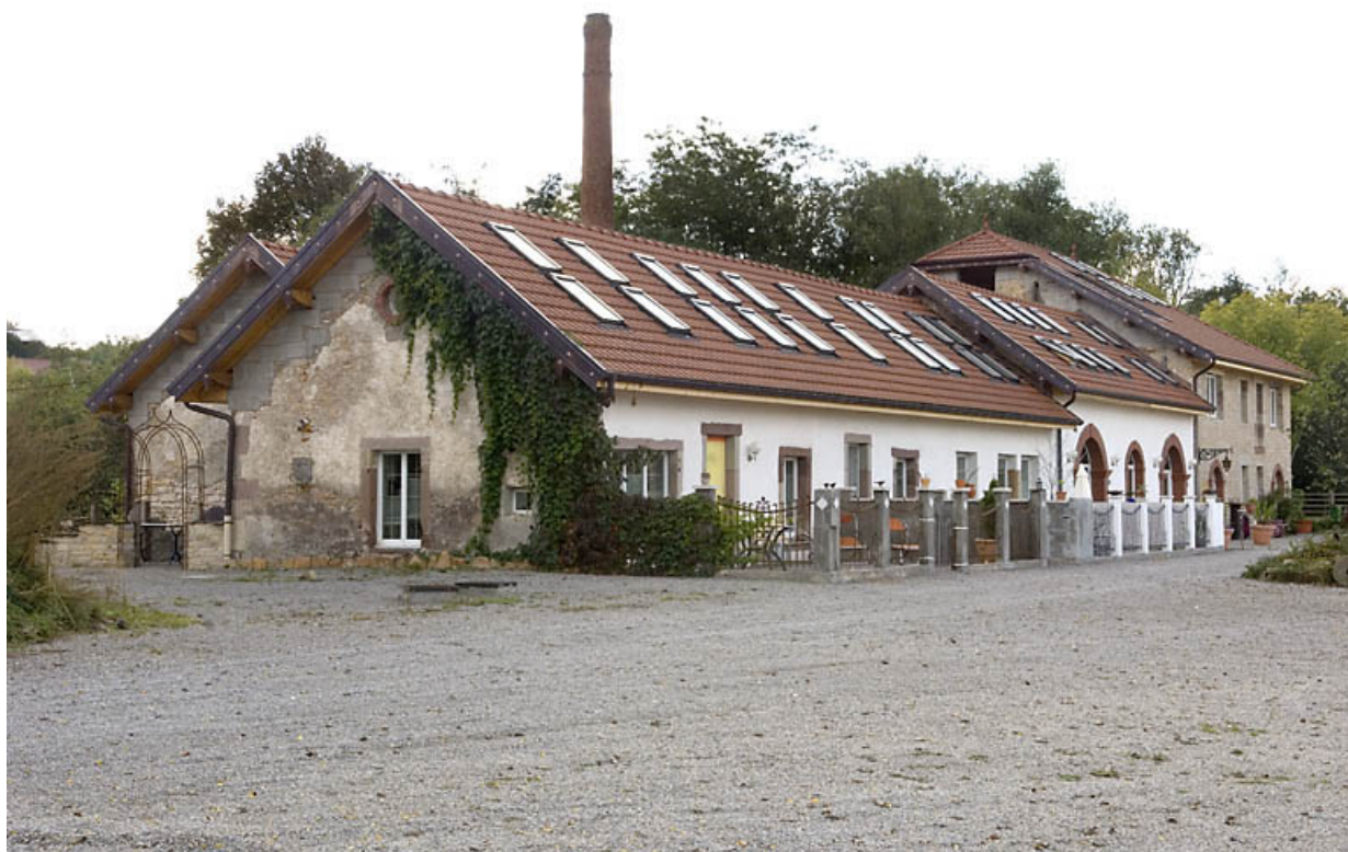
Atelier de fabrication vu de trois quarts.