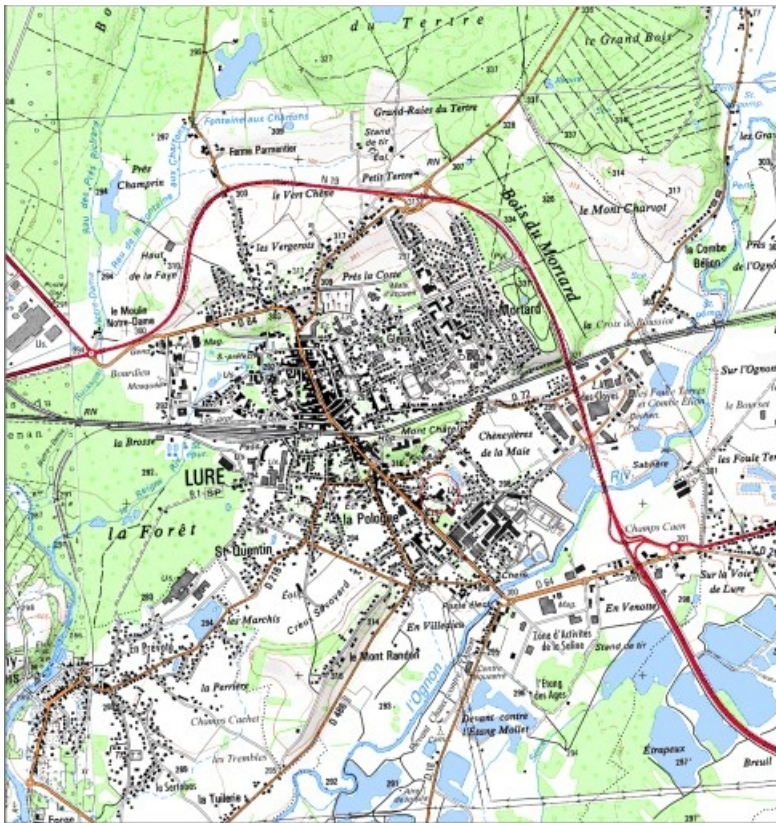
Carte de localisation. Carte topographique au 1:25000, I.G.N., Lure, 3521 O. SCAN 25, Licence n°2008CISE29-68. 70, Lure, 15 rue des Cloies