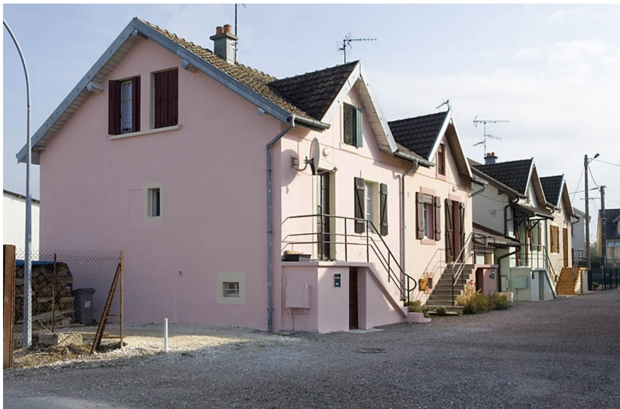
Logements doubles. Vue en enfilade depuis l'ouest.