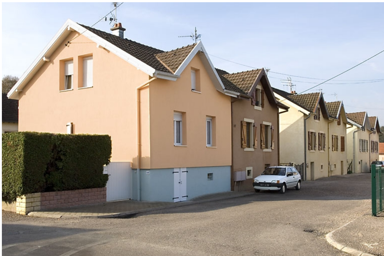
Logements doubles. Façades nord.