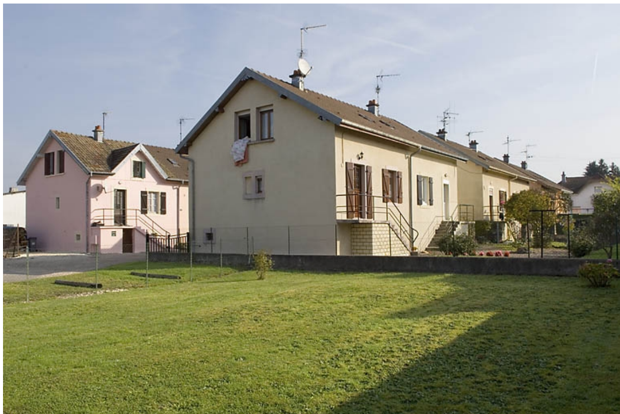
Ensemble de logements doubles.