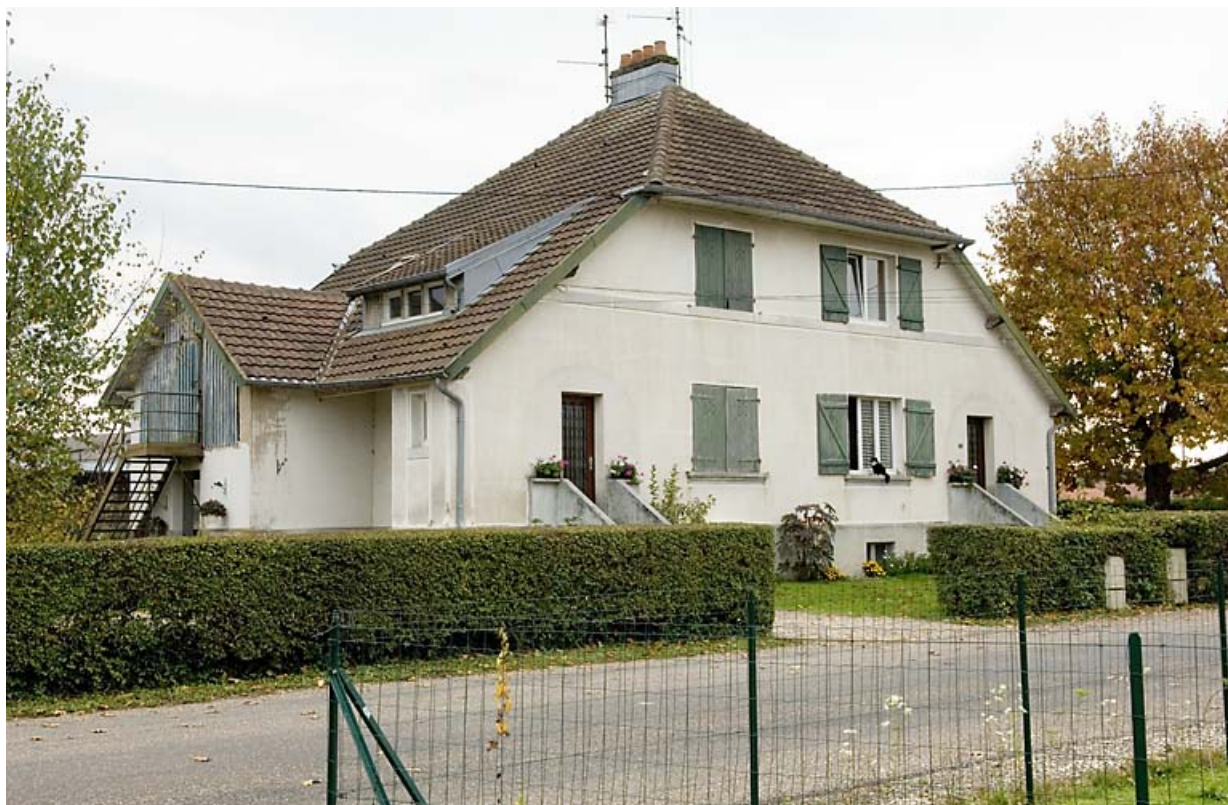
Logement double (de contremaître ?).