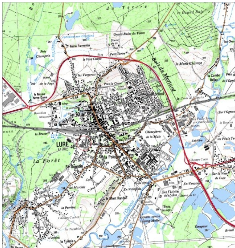
Carte de localisation. Carte topographique au 1:25000, I.G.N., Lure, 3521 O. 70, Lure rue de la Métairie