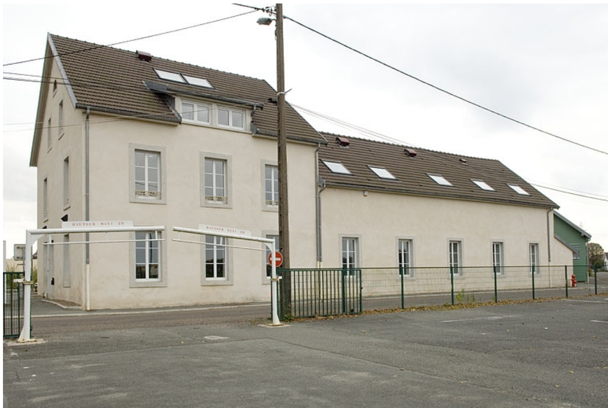
Logement et bureau (?). Vue de face.