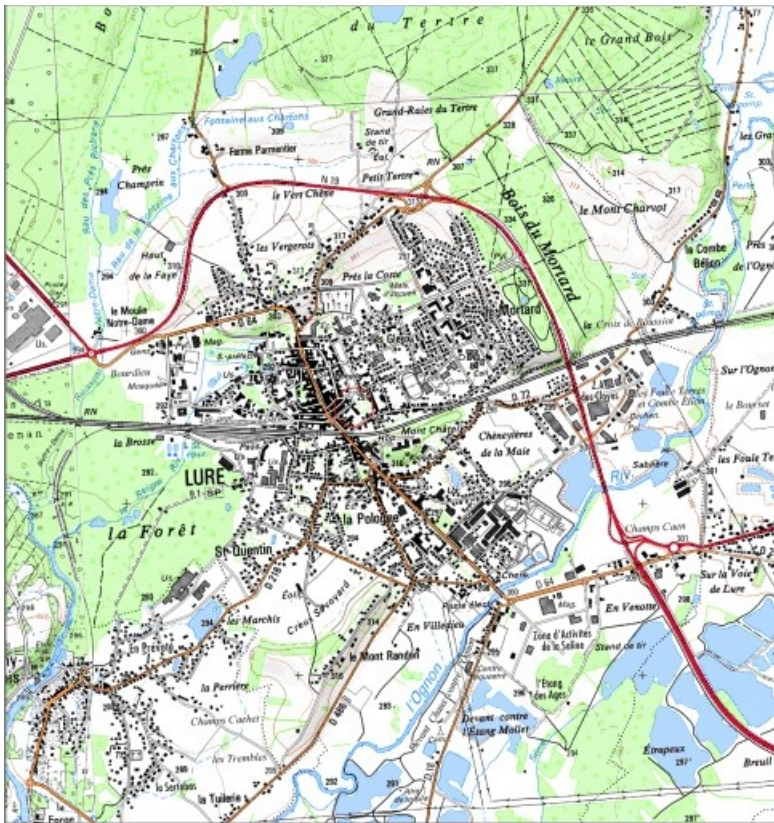
Carte de localisation. Carte topographique au 1:25000, I.G.N., Lure, 3521 O. SCAN 25 70, Lure, 14, 16 rue des Gloux