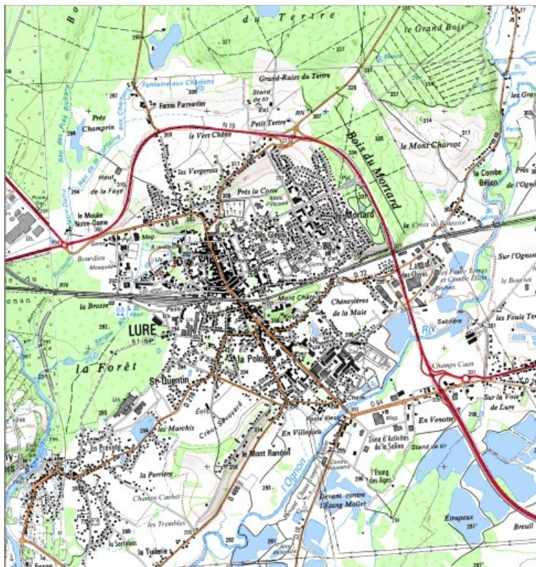
Carte de localisation. Carte topographique au 1:25000, I.G.N., Lure, 3521 O. SCAN 25 70, Lure, 4 rue Parmentier