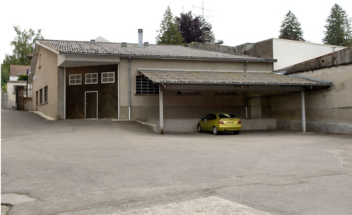
Atelier de fabrication (?). Vue depuis la cour. 70, Luxeuil-les-Bains, 11 rue de Grammont