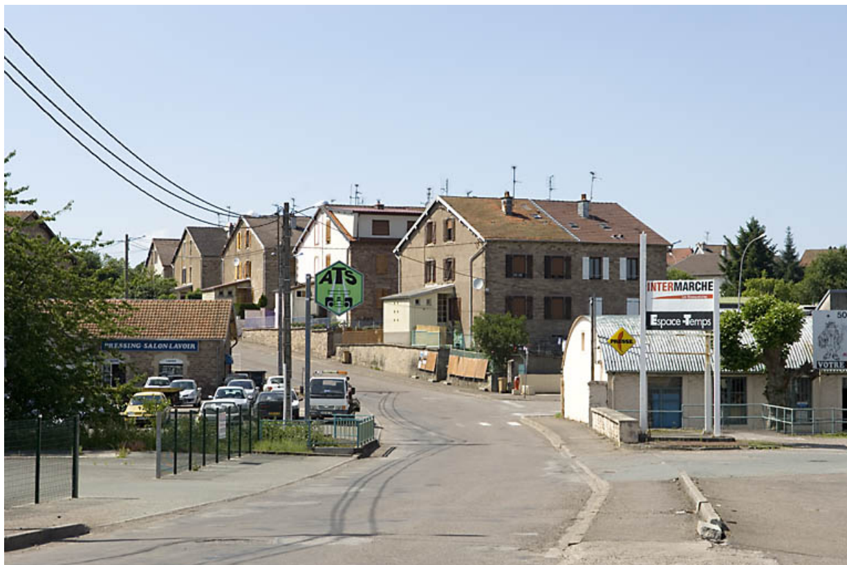
Vue d'ensemble de la cité ouvrière.