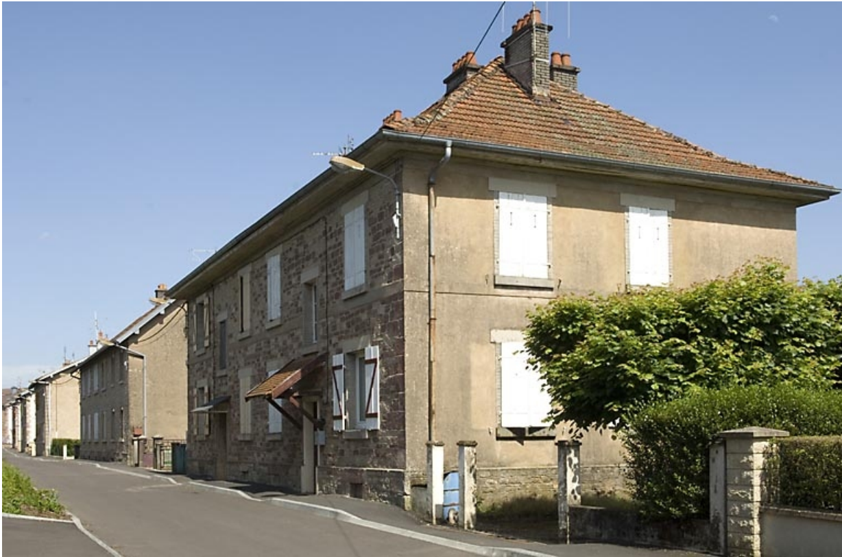
Enfilade de logements d'ouvriers (rue du Tissage).