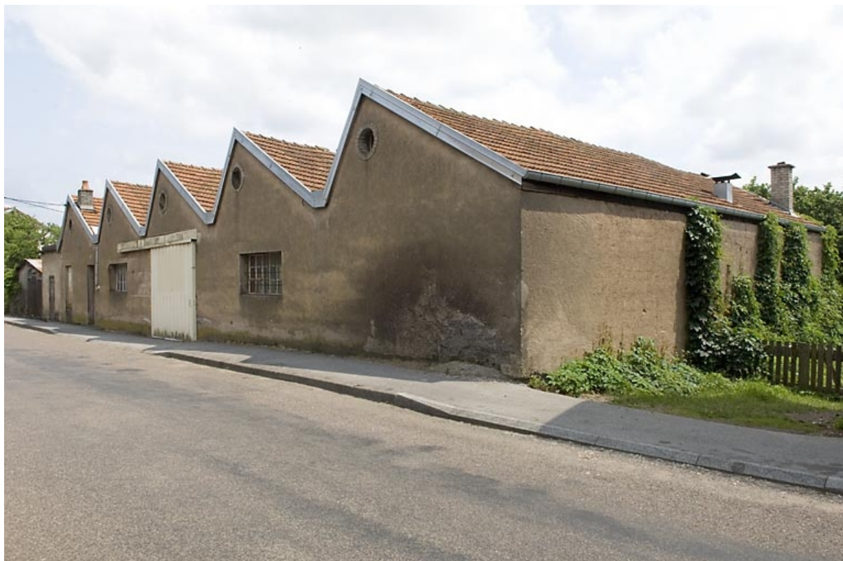
Vue de trois quart droite.

70, Luxeuil-les-Bains, 17 rue Alphonse Odeph