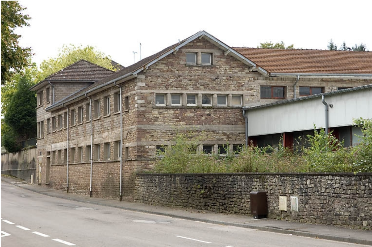
Atelier de fabrication. Vue de trois quarts.

70, Luxeuil-les-Bains, 60 rue Georges Moulimard