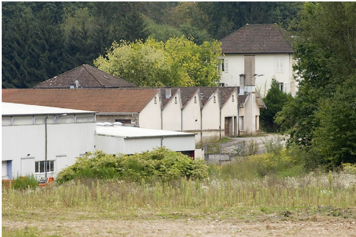
Vue d'ensemble depuis le nord-ouest.

70, Luxeuil-les-Bains, 60 rue Georges Moulimard