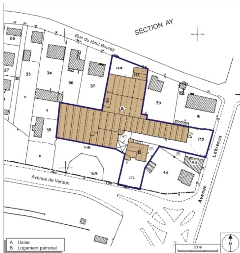
Plan-masse et de situation. Extrait du plan cadastral numérisé, 2008, section AZ, 1:1000.

70, Luxeuil-les-Bains, 23 avenue Labiénus