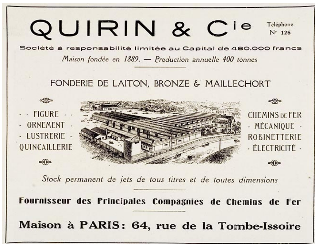
Fonderie de laiton, bronze et maillechort Quirin et Cie [encart publicitaire]. 70, Luxeuil-les-Bains, 23 avenue Labiénus

Gravure, s.n., s.d. [1929]. Dans : " L'illustration économique et financière : La Haute-Saône,[...] ", 1929, p. 42.