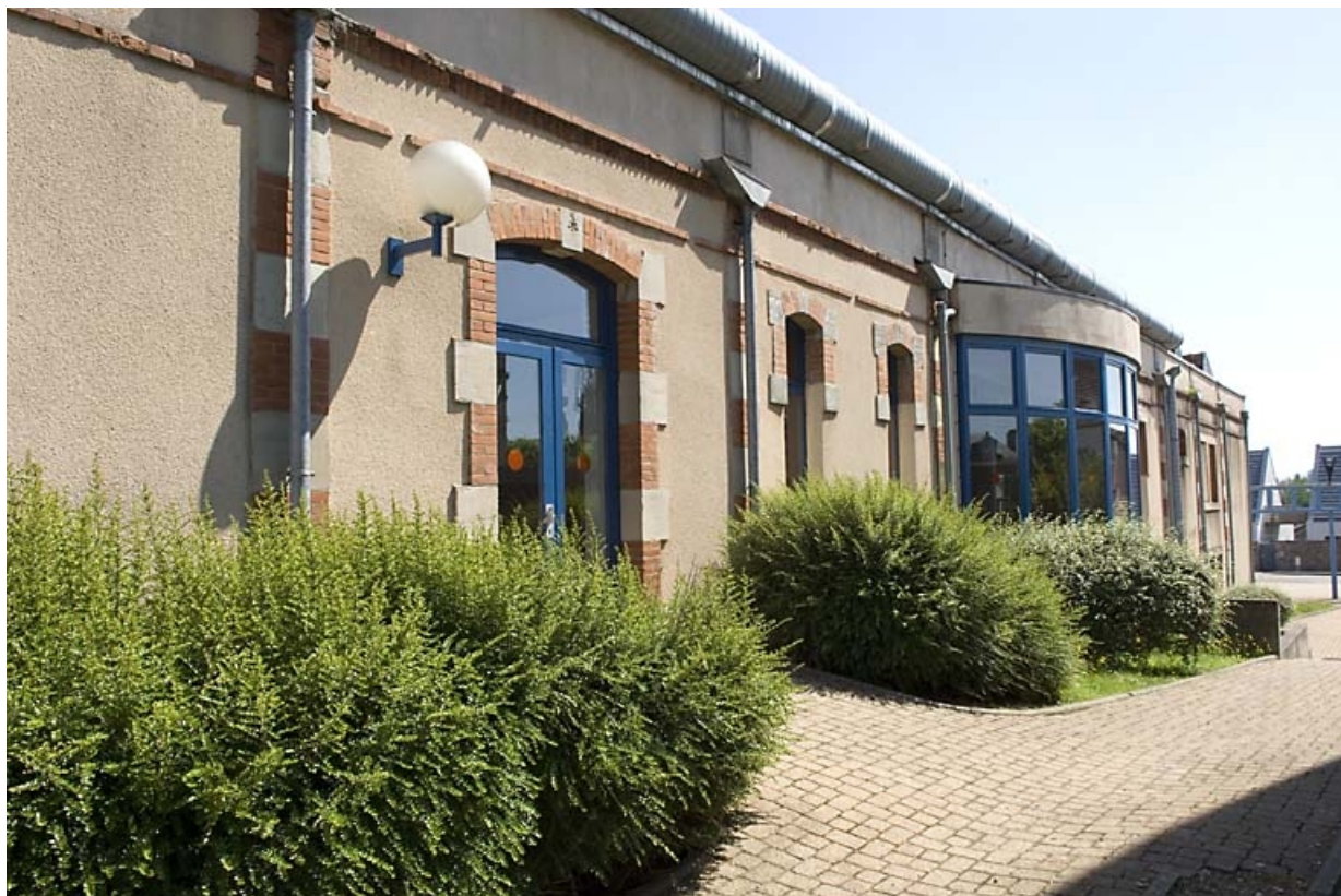
Façade sud de l'atelier de fabrication.

70, Luxeuil-les-Bains, 23 avenue Labiénus