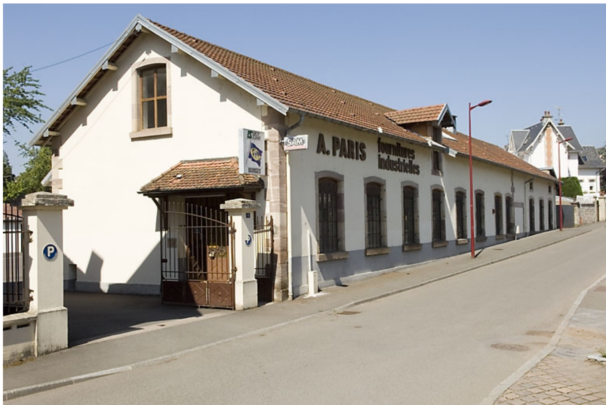
Atelier de fabrication vu de trois quarts.

70, Luxeuil-les-Bains, 2, 4 rue de la Saline