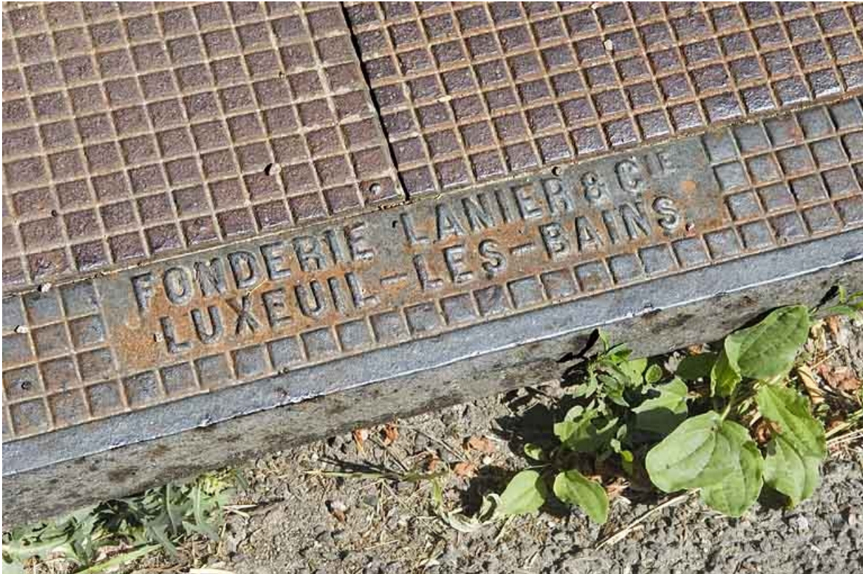
Plaque de voirie en fonte. Détail (commune de Fougerolles).

70, Luxeuil-les-Bains, 37 rue du Haut-Bourey