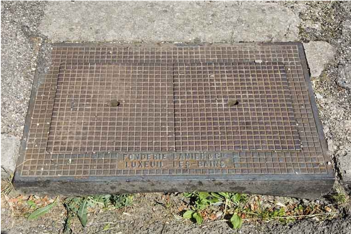
Plaque de voirie en fonte. (commune de Fougerolles).

70, Luxeuil-les-Bains, 37 rue du Haut-Bourey