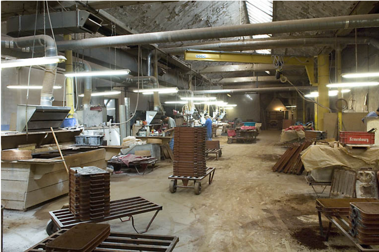
Atelier de moulage. Postes de mouleurs.

70, Saint-Sauveur, 44 rue du Maréchal Lyautey