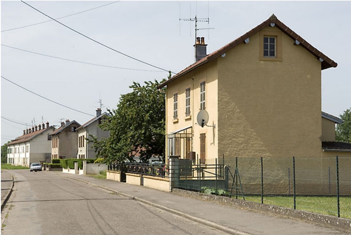
Cité ouvrière (rue Pasteur).

70, Saint-Sauveur, 44 rue du Maréchal Lyautey