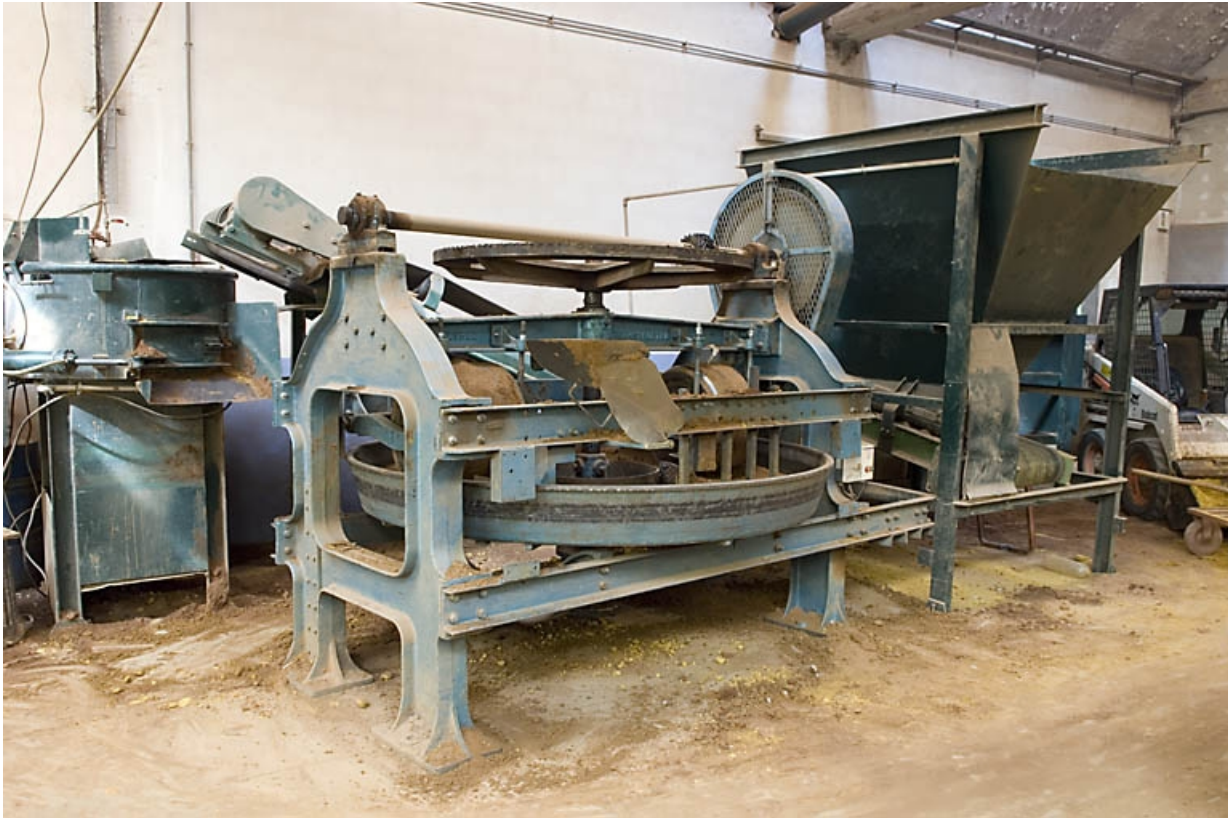
Malaxeur (préparation du sable pour les moules).

70, Saint-Sauveur, 44 rue du Maréchal Lyautey