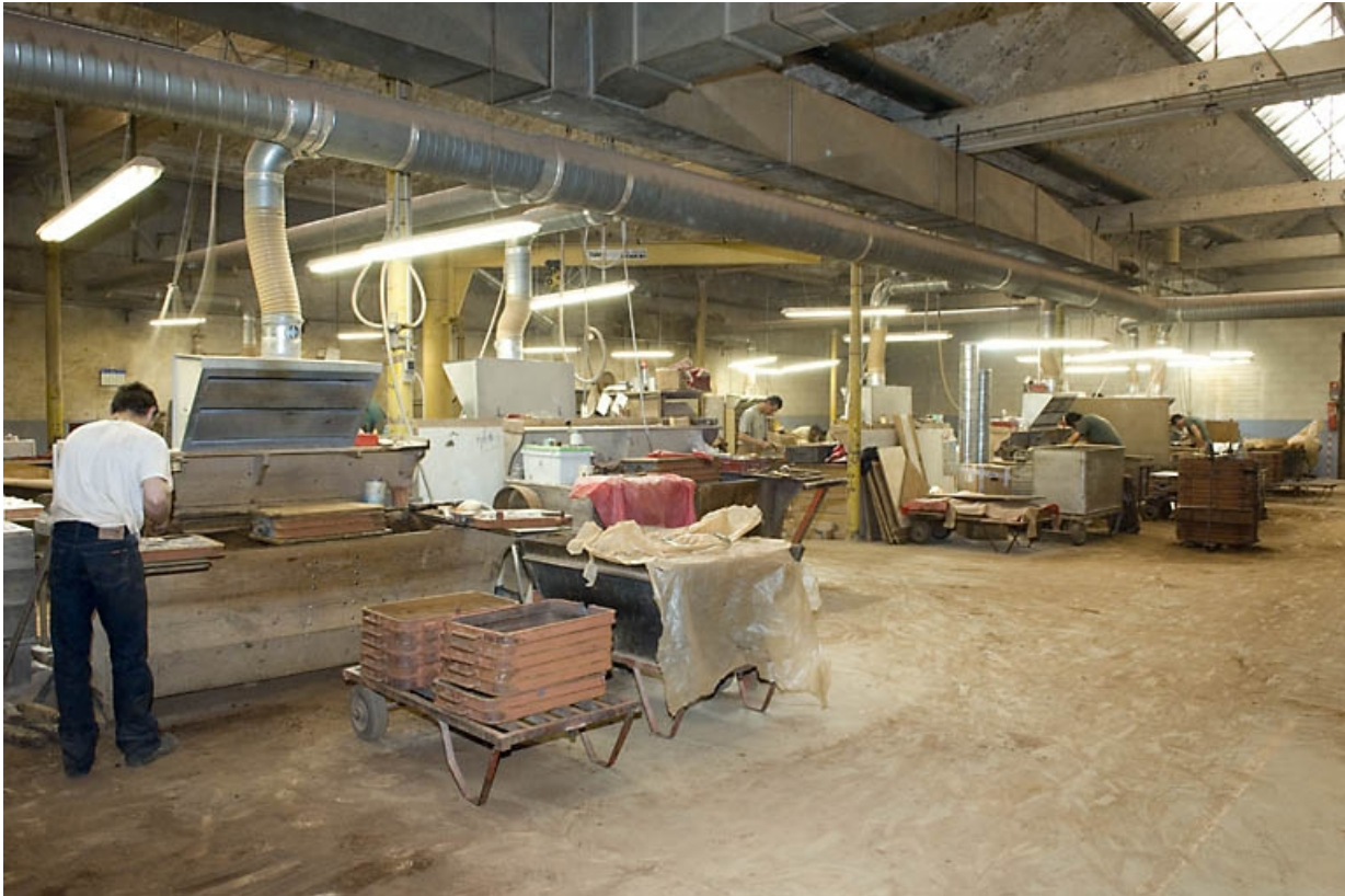
Atelier de moulage. Vue d'ensemble depuis l'ouest.

70, Saint-Sauveur, 44 rue du Maréchal Lyautey