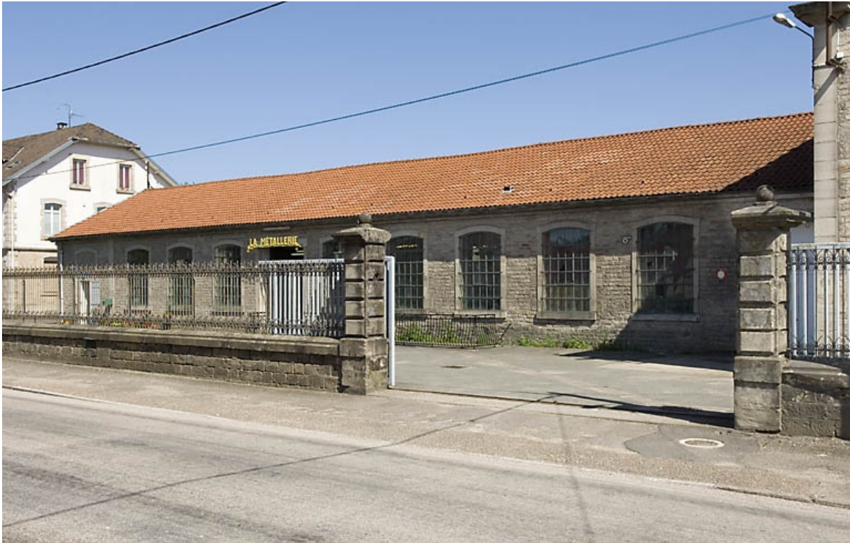
Cour et bâtiment nord en rez-de-chaussée.

70, Saint-Sauveur, 44 rue du Maréchal Lyautey