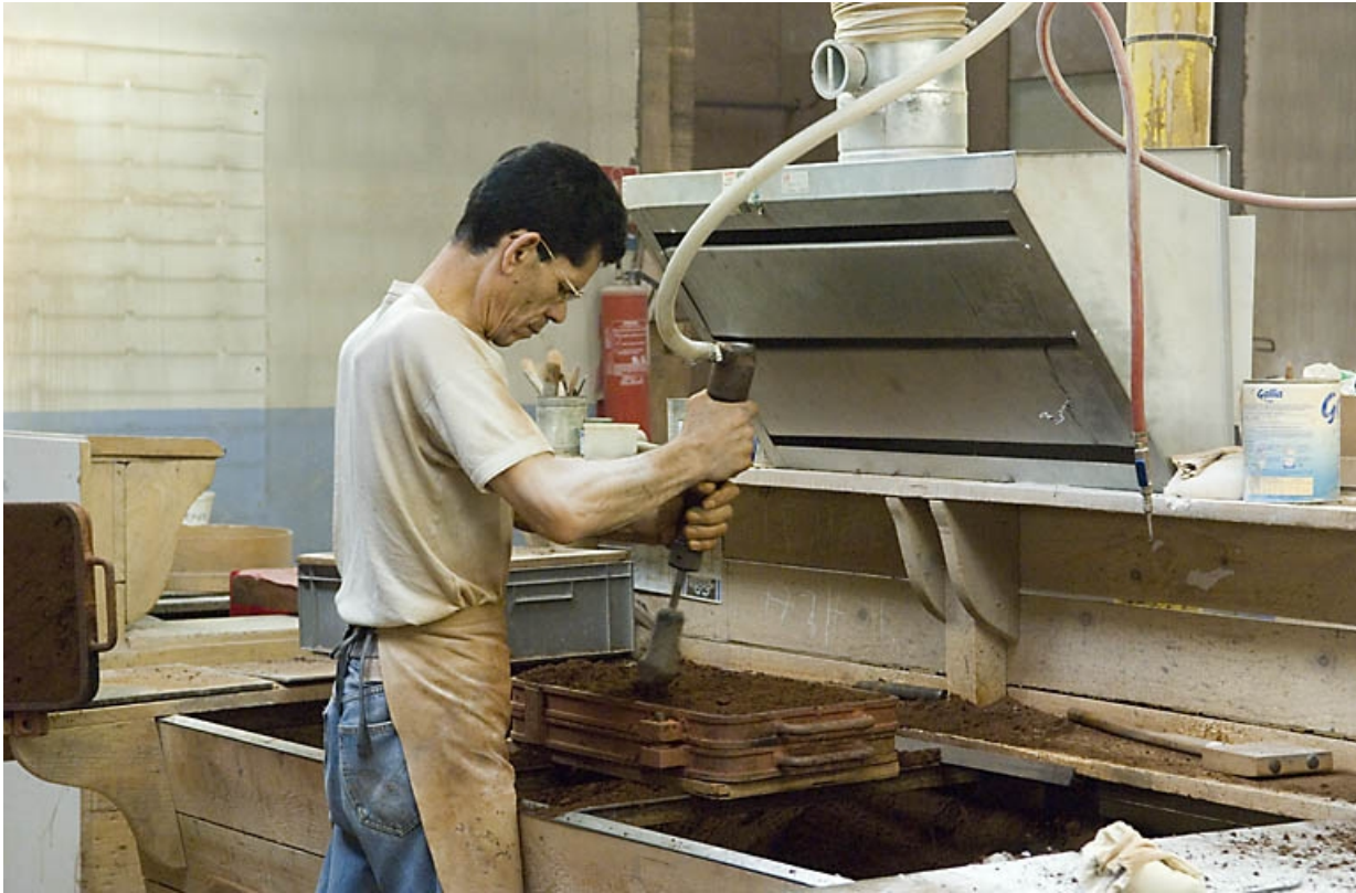
Poste de moulage. Le sable est tassé avec un outils pneumatique.

70, Saint-Sauveur, 44 rue du Maréchal Lyautey