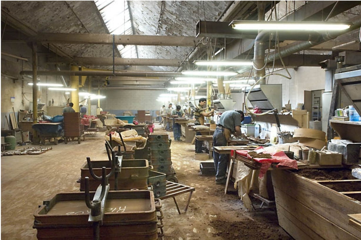
Atelier de moulage. Vue d'ensemble depuis le nord-ouest.

70, Saint-Sauveur, 44 rue du Maréchal Lyautey