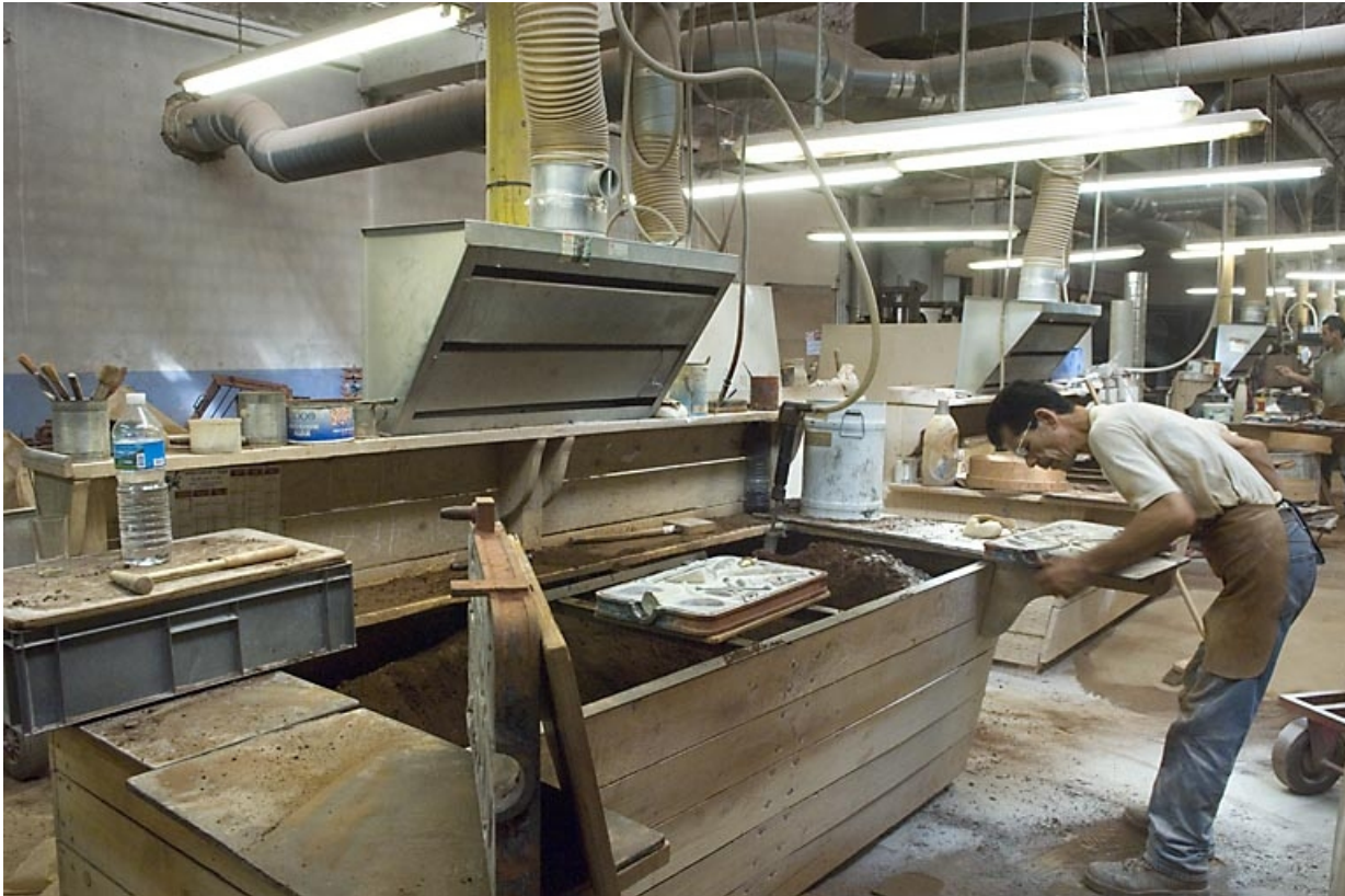
Poste de moulage. Préparation d'un moule. 70, Saint-Sauveur, 44 rue du Maréchal Lyautey