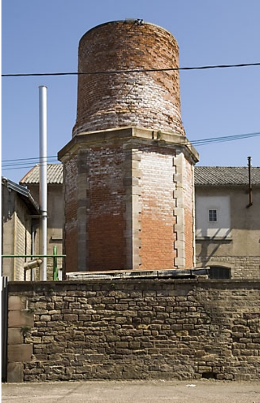
Base de la cheminée.

70, Saint-Sauveur, 44 rue du Maréchal Lyautey