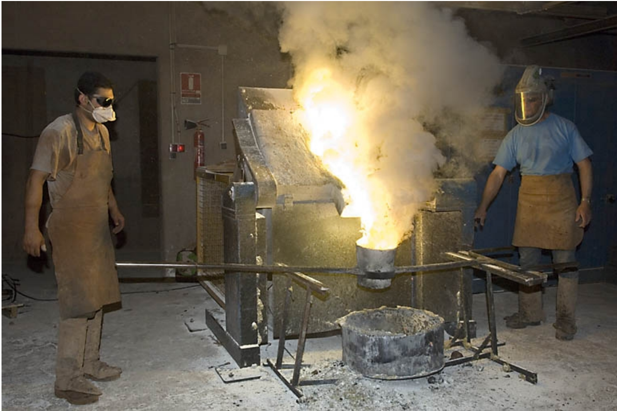
Four électrique. Remplissage de la poche.

70, Saint-Sauveur, 44 rue du Maréchal Lyautey