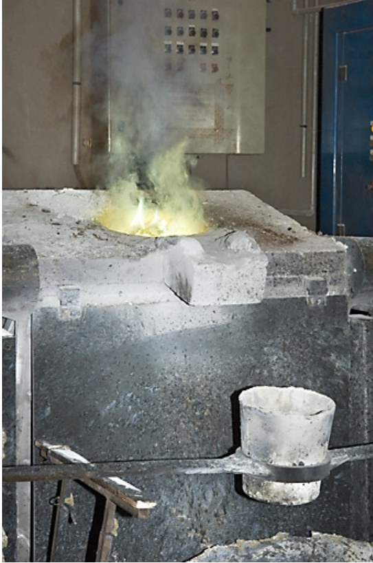
Four électrique. Bascule du four pour la coulée. 70, Saint-Sauveur, 44 rue du Maréchal Lyautey