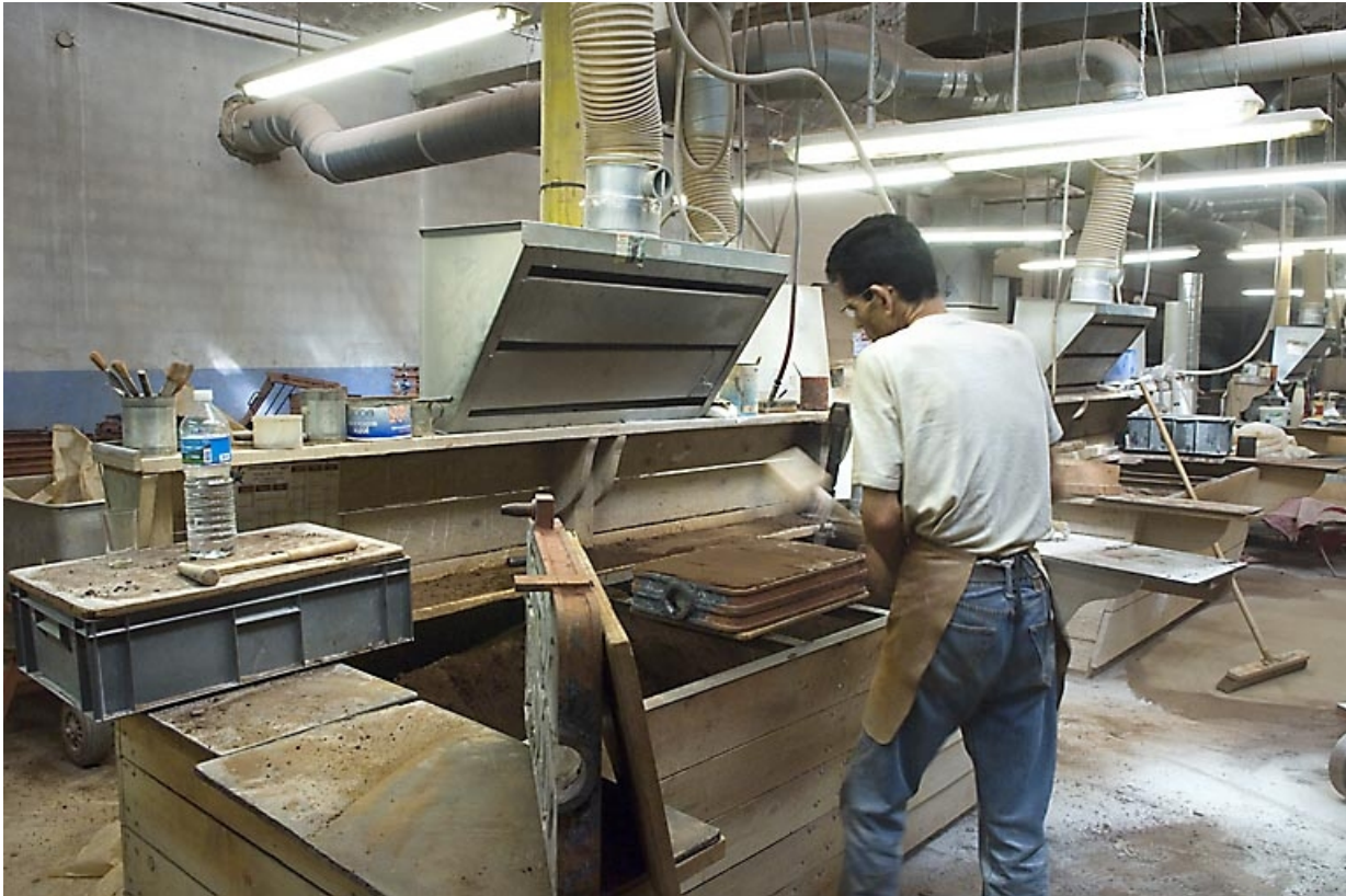
Poste de moulage. Le sable est tassé avec un instrument manuel.

70, Saint-Sauveur, 44 rue du Maréchal Lyautey