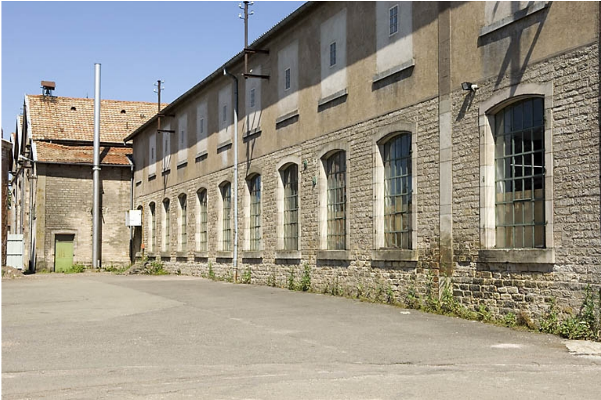
Elévation sur rue de l'atelier de préparation. 70, Saint-Sauveur, 44 rue du Maréchal Lyautey