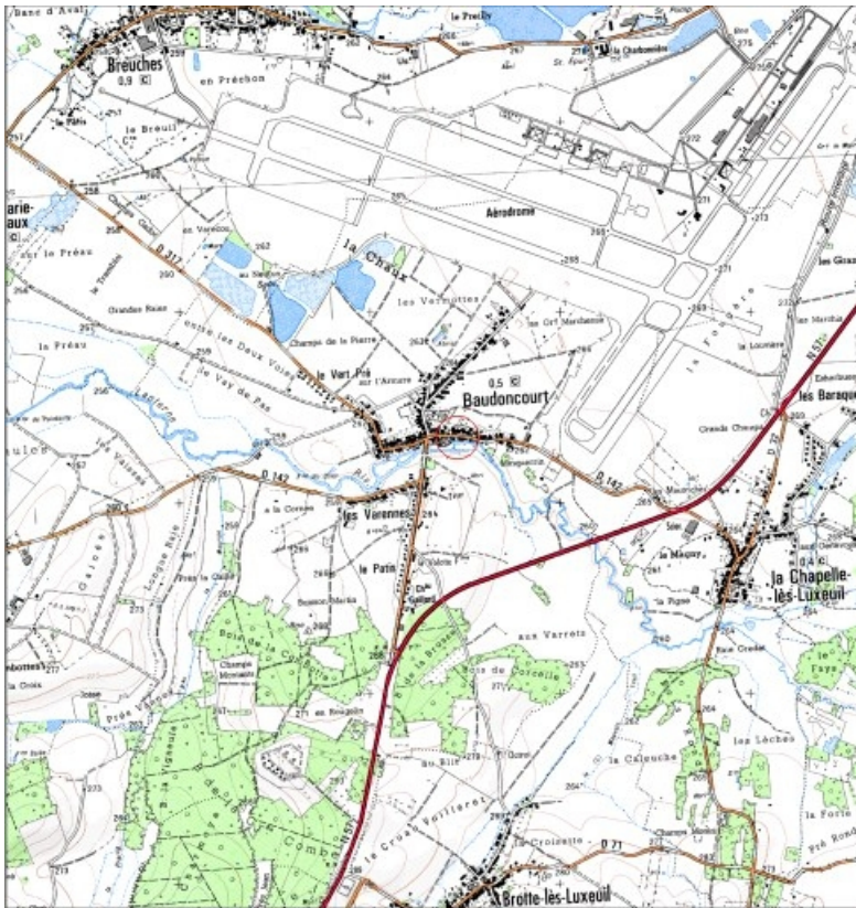
Carte de localisation. Carte topographique au 1:25000, I.G.N., Luxeuil-les-Bains, 3420 E. SCAN 25 © IGN - 2008, Licence n°2008CISE29-68.