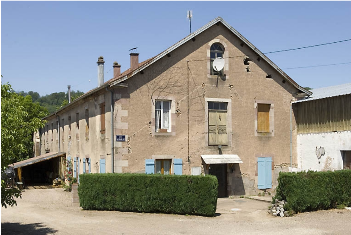
Atelier de fabrication. Vue depuis le sud-est. 70, Breuchotte rue du Grand Pré