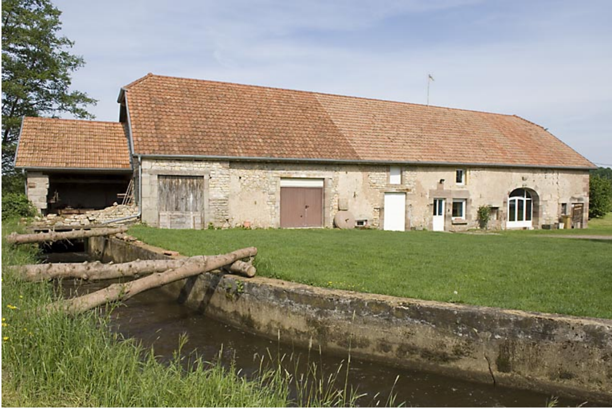
Bief d'amenée et façade antérieure.