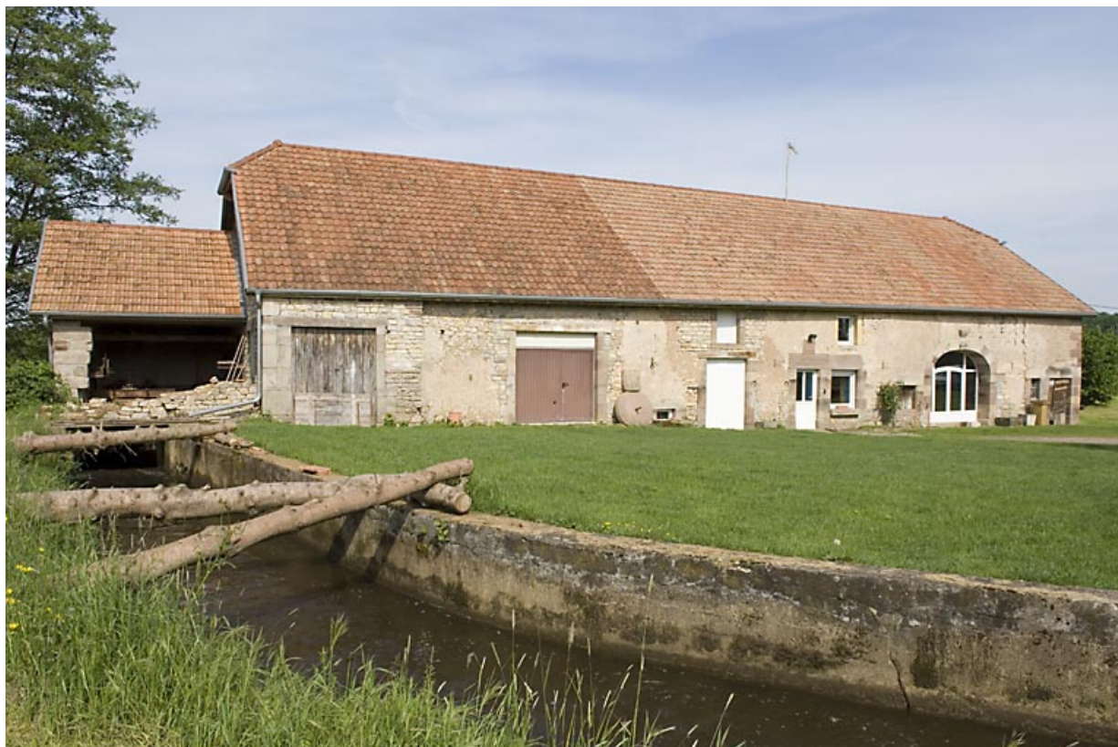
Bief d'amenée et façade antérieure.