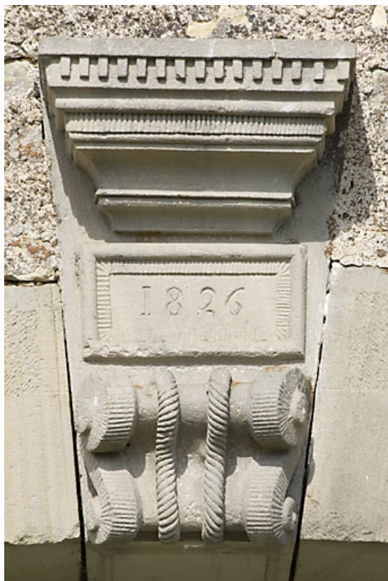
Arcade de la grange. Détail de la clef.