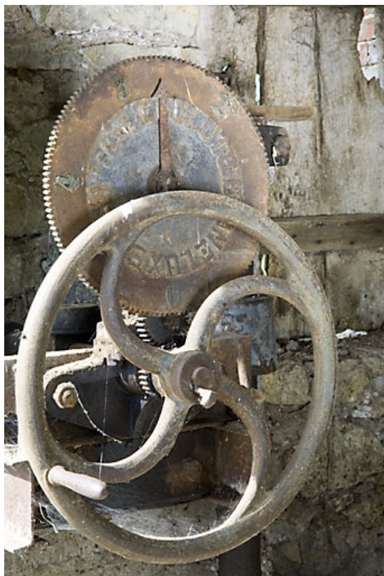
Atelier de scierie. Volant du mécanisme d'admission d'eau de la turbine.