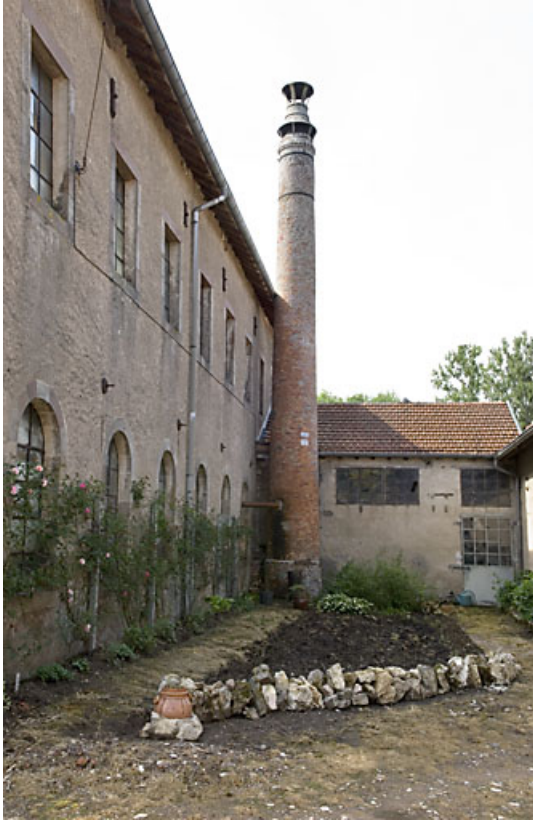
Façade occidentale de l'atelier de filature, cheminée et chaufferie.

70, Citers rue de la Hache, lieudit : la Hache