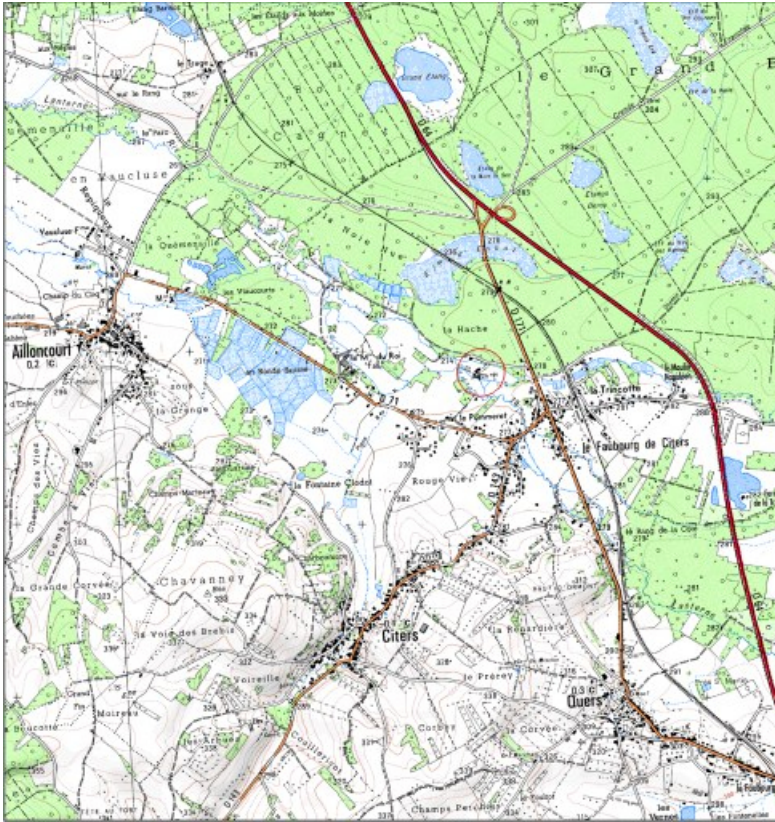
Carte de localisation. Carte topographique au 1:25000, I.G.N., Luxeuil-les-Bains, 3420 E. SCAN 25 © IGN - 2008, Licence n°2008CISE29-68.

70, Citers rue de la Hache, lieudit : la Hache