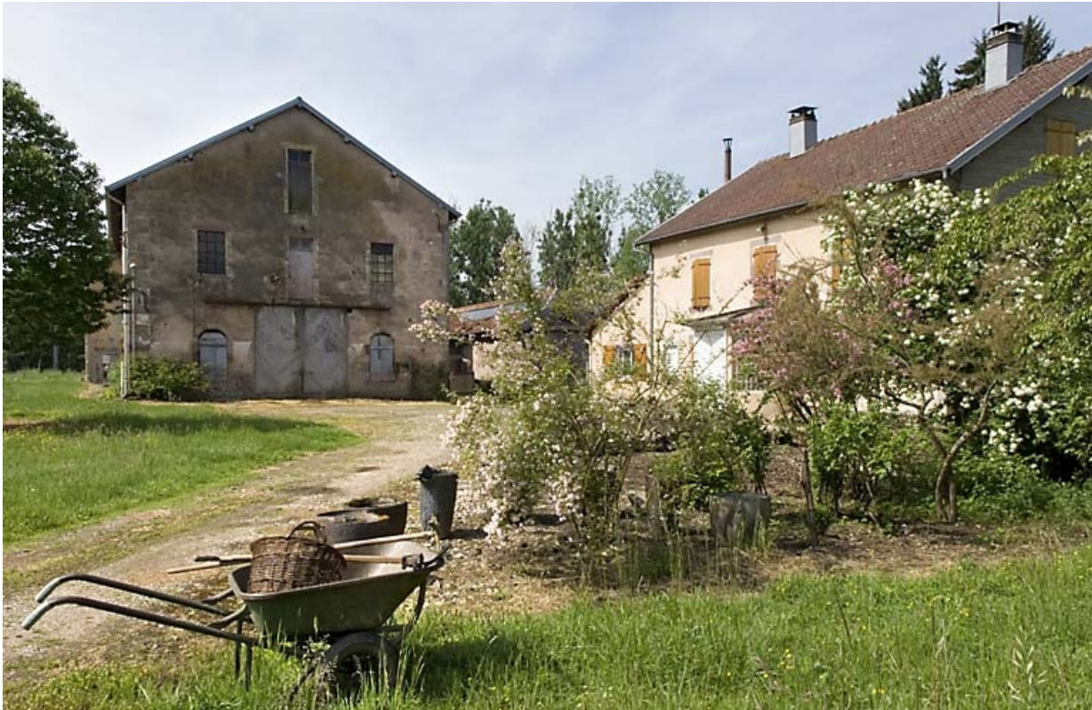
Atelier de filature et logement depuis l'est.

70, Cîteaux rue de la Hache, lieudit : la Hache