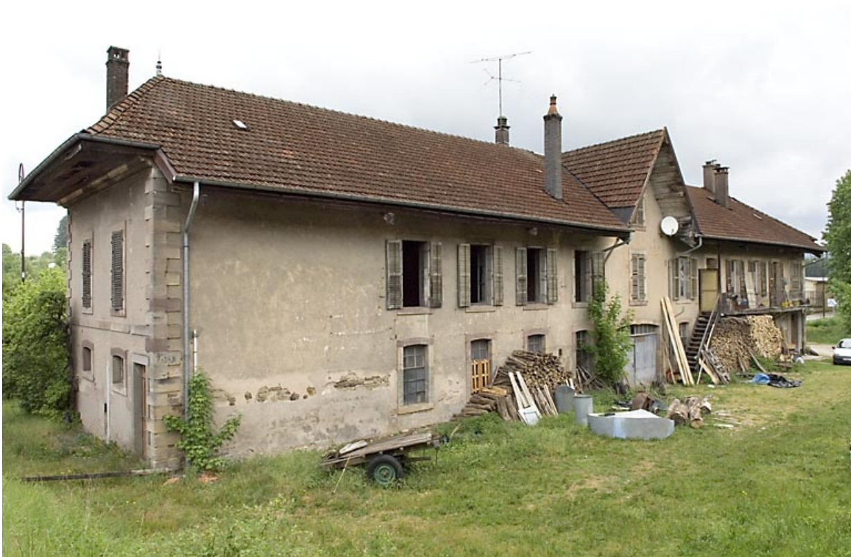
Vu de trois quarts arrière.