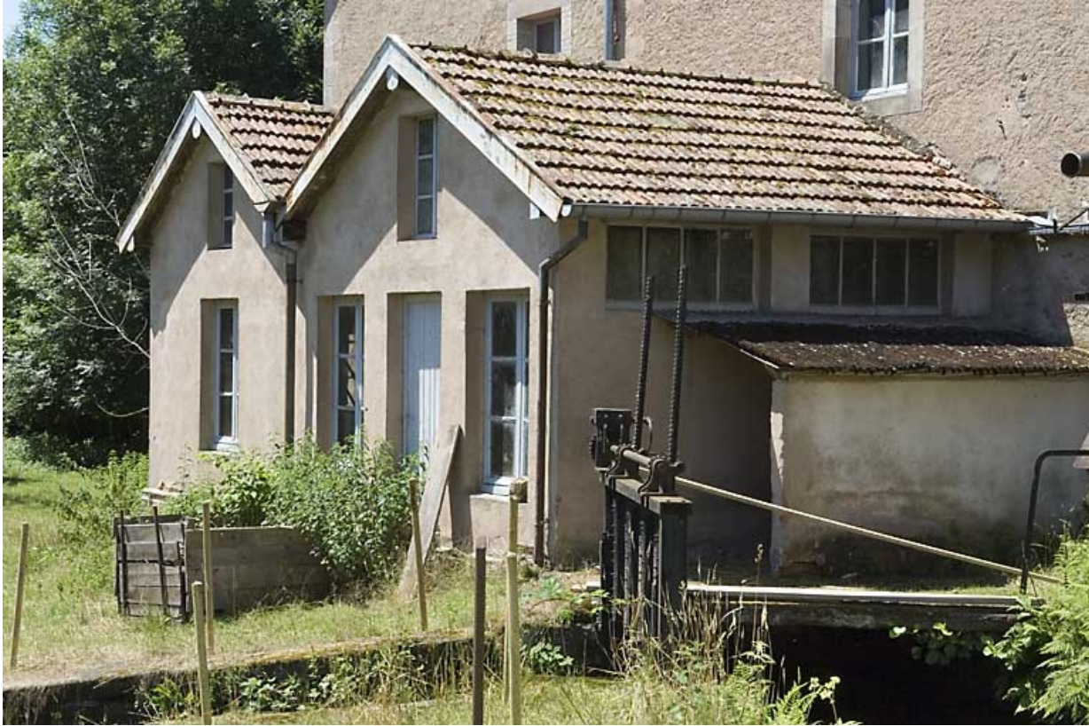
Le bâtiment d'eau et le vannage de décharge.

70, Fougerolles, lieudit : Fougerolles-le-Château