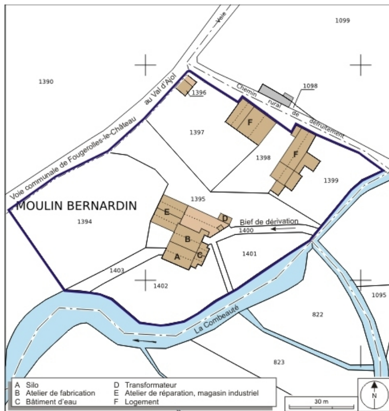
Plan-masse et de situation. Extrait du plan cadastral numérisé, 2008, section B, 1:1000. Source : Direction générale des Finances Publiques - Cadastre ; mise à jour : 2008.

70, Fougerolles, lieudit : Fougerolles-le-Château