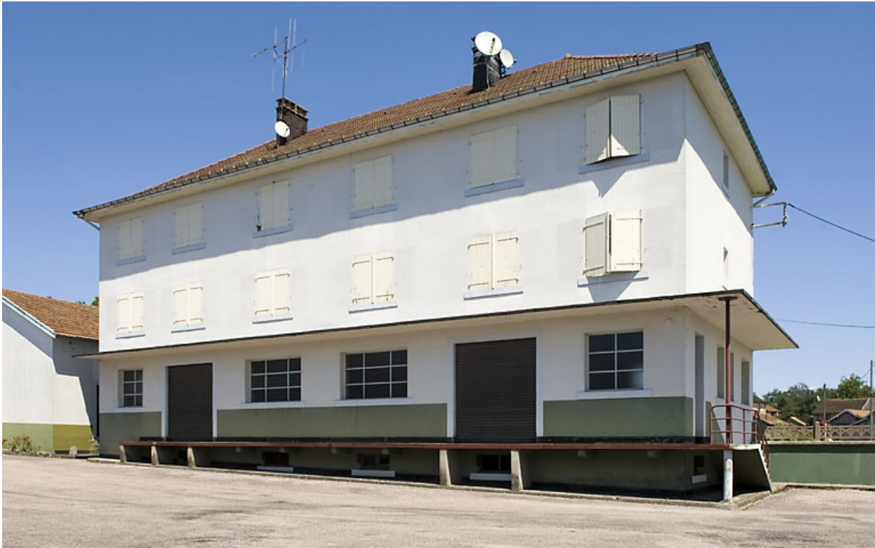
Extension nord de l'usine. Réception des matériaux et logements.