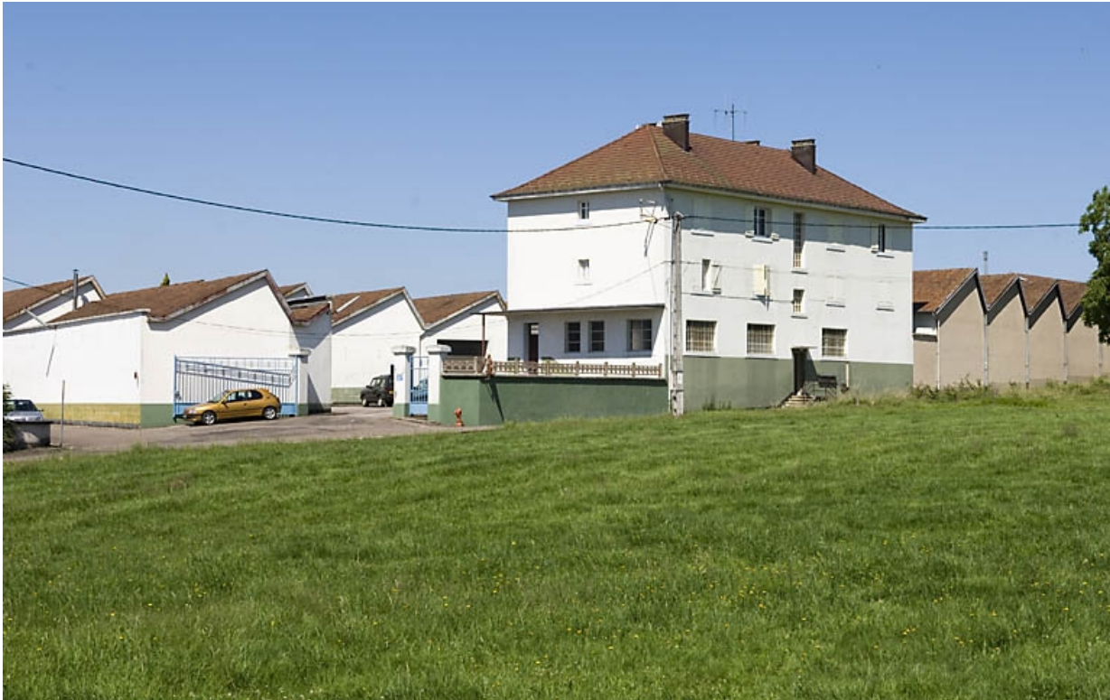
Extension nord de l'usine (réception et stockage des matières premières).