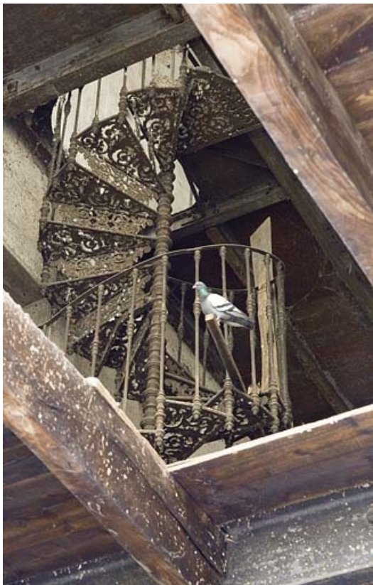
Bâtiment de rectification. Escalier intérieur en fonte.