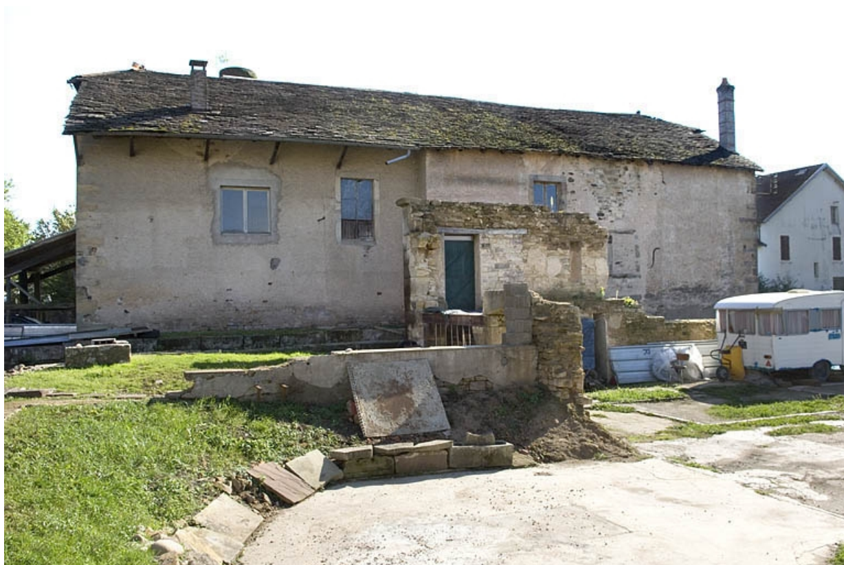
Façade nord de l'atelier de tonnellerie. Vue depuis l'emplacement du moulin. 70, Fougerolles Grande-Rue