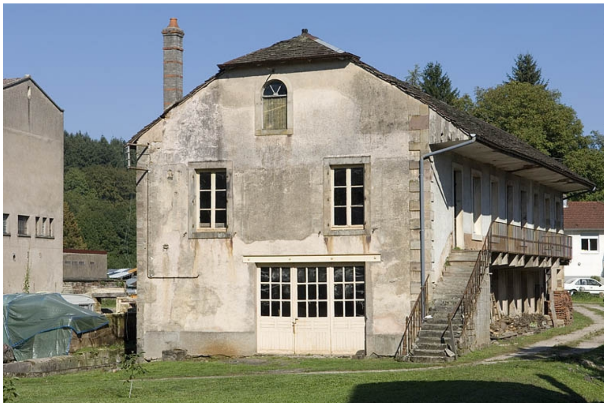
Atelier de tonnellerie. Vue de trois quarts. 70, Fougerolles Grande-Rue