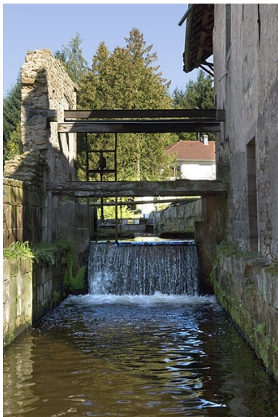
Bief de dérivation depuis l'aval.