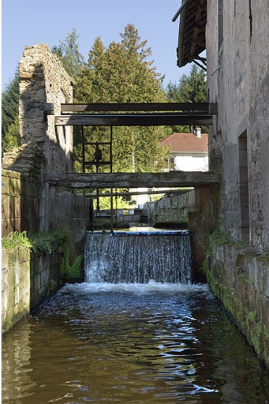
Bief de dérivation depuis l'aval.