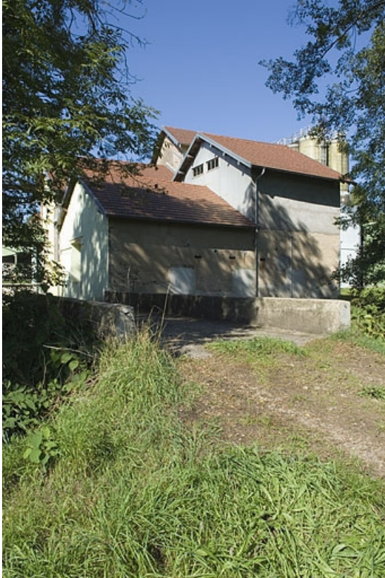
Vue du moulin depuis le sud-est.

70, Fougerolles, lieudit : Fougerolles-le-Château