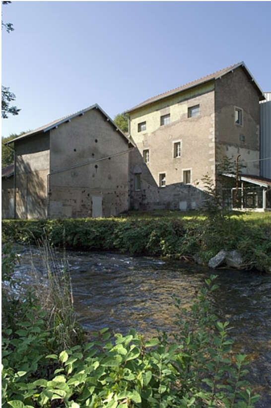
Elévation sud. Vue de trois quarts arrière.

70, Fougerolles, lieudit : Fougerolles-le-Château