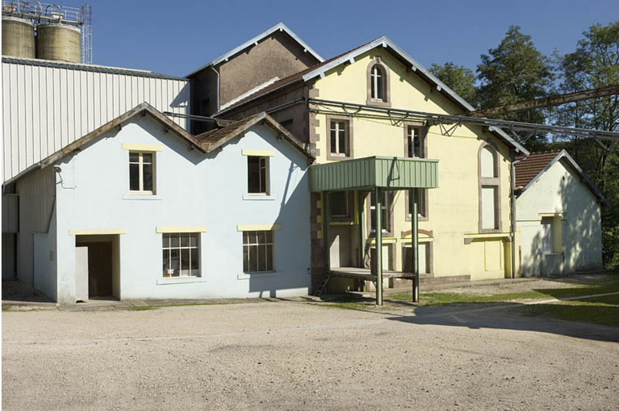
Façades occidentales du moulin.

70, Fougerolles, lieudit : Fougerolles-le-Château