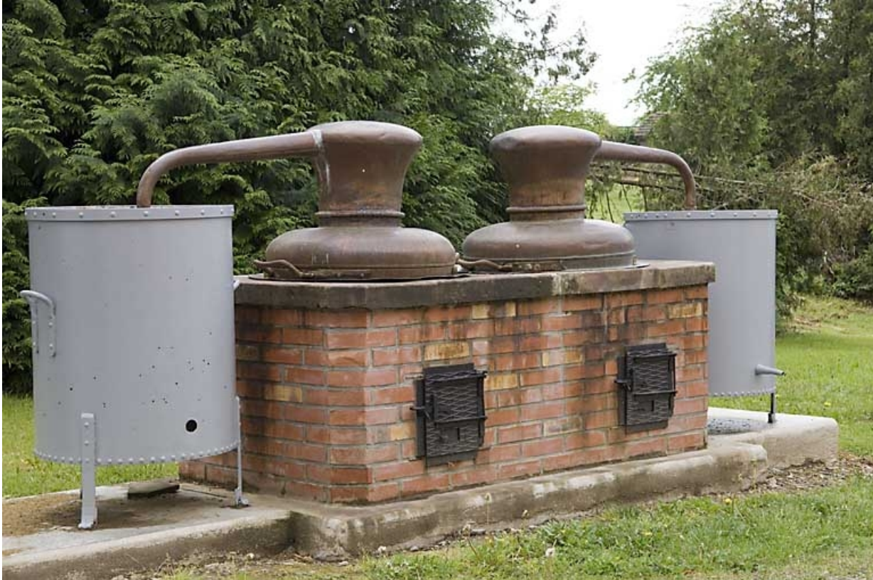
Alambics doubles, à feu nu, exposés à l'extérieur.

70, Fougerolles, 7, 9 rue des Moines Hauts