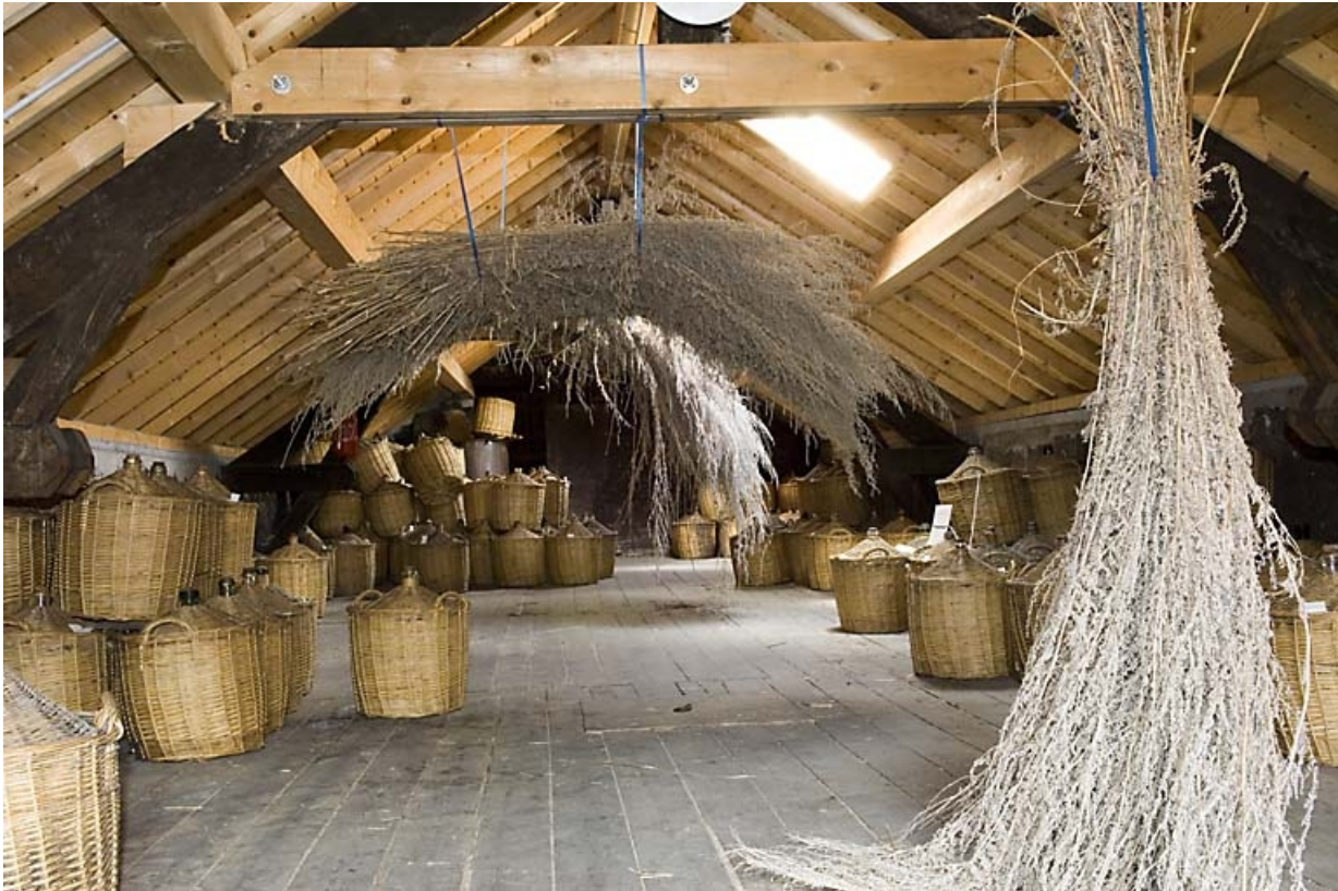
Chai à l'étage de la cuverie (vieillissement des eaux-de-vie en bonbonnes).

70, Fougerolles, 7, 9 rue des Moines Hauts