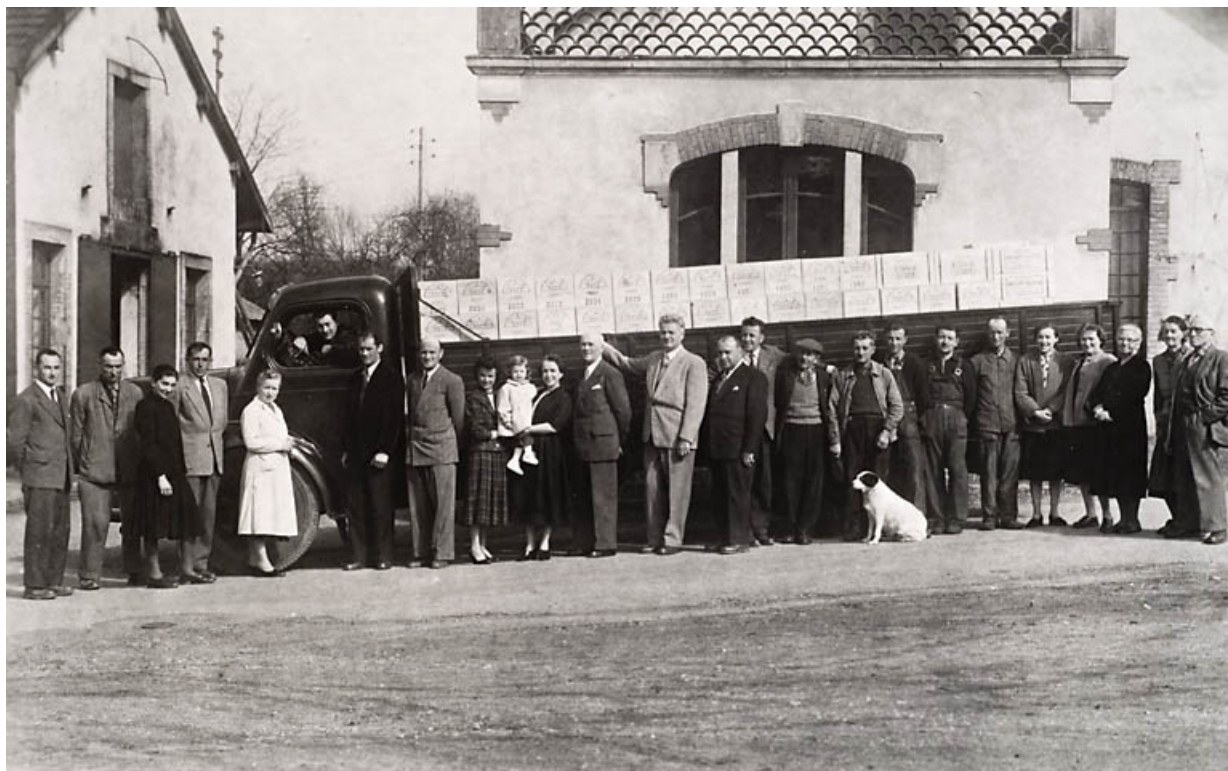
Le personnel de la distillerie.

70, Fougerolles, 7, 9 rue des Moines Hauts