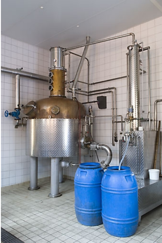
Atelier de distillation. Alambic Arnold Hosstein.

70, Fougerolles, 7, 9 rue des Moines Hauts