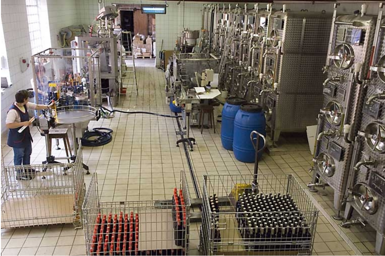
Chai et atelier d'embouteillage.

70, Fougerolles, 7, 9 rue des Moines Hauts