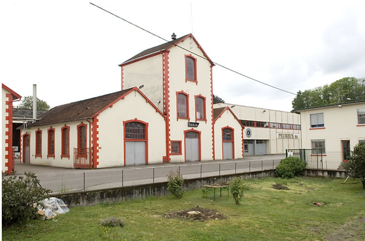
Bâtiments industriels. Vue de trois quarts gauche.

70, Fougerolles, 43 avenue Claude Peureux