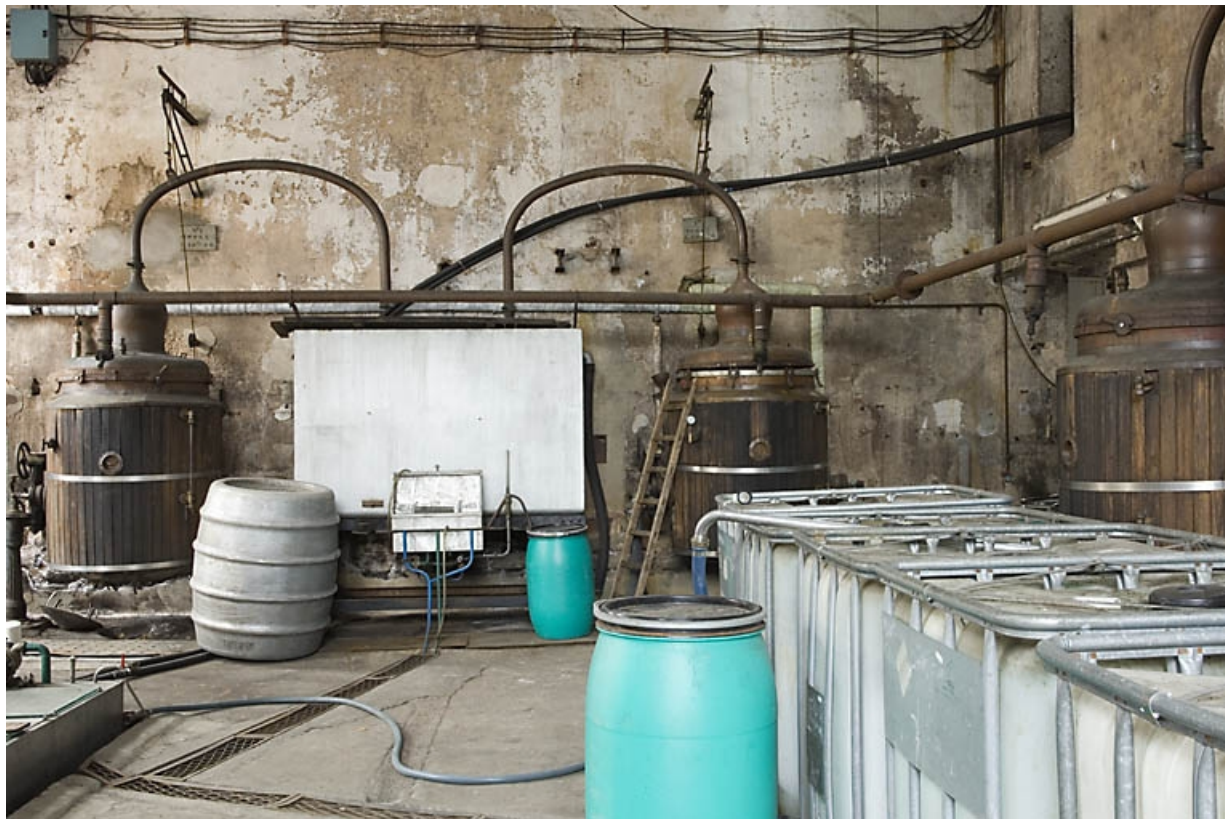
Ancien atelier de distillation. Vue d'ensemble. Alambics Egrot-Grangé.

70, Fougerolles, 43 avenue Claude Peureux